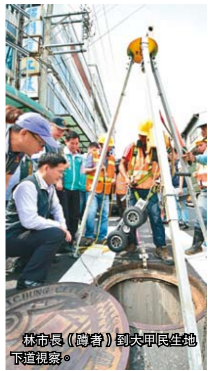
林市長（蹲著）到夫甲民生地下道視察。

臺中市長林佳龍親自到場操作「忍者龜」即時影像車，對水利局在洪汛來臨前完成任務相當滿意；他說，市府投注4千萬元，要確保居民與用路人的生命安全，相信以後不會再有類似情況發生，居民可安心使用這條地下道了。