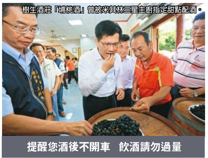
樹生酒莊「埔桃酒」曾被米其林三星主廚指定為甜點配酒。

然農法栽培而成，不但食安無虞，米粒也Q彈，特別適合做成飯條、發糰、蘿蔔糕等米食類加工產品。