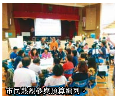
市民熱烈參與預算編列。

公民時代來臨，自己的預算自己編！臺中市政府推動參與式預算，首示範區鎖定在中區，經過市民提案投票選出六案，市府編預算執行；中區8里街道美化工程已開始進行，中山路257巷人文巷道也已著手規劃。