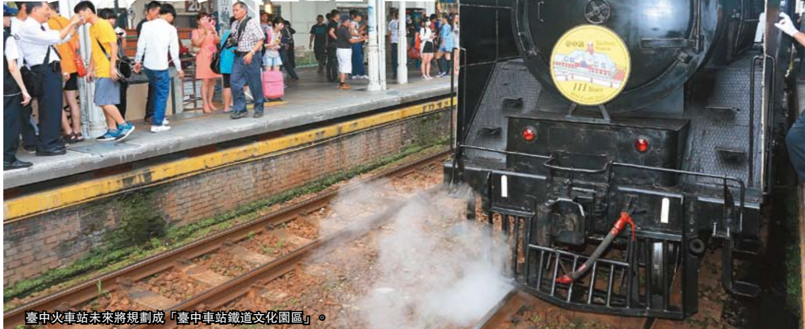
臺中火車站未來將規劃成「臺中車站鐵道文化園區」。

臺中鐵路高架化後，臺中火車站也跟著東移，是一座全新的車站。已被指定為二級古蹟的原臺中火車站前站、第一月台及原後站也被指定為歷史建築；加上臨近車站的臺中20號倉庫群是國內首座公辦民營藝術村，全區富文化古蹟資源，交通部臺灣鐵路管理局規劃要打造成「臺中車站鐵道文化園區」。