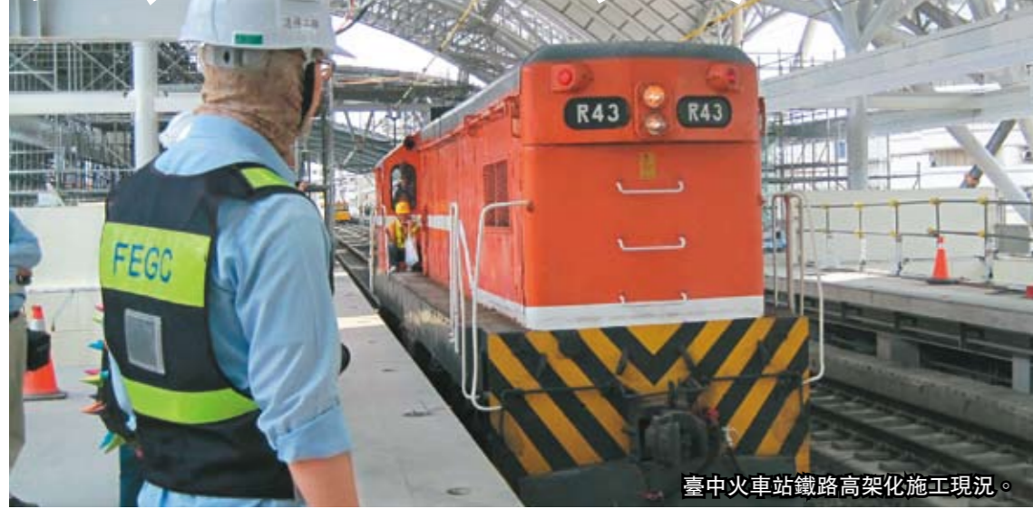
臺中火車站鐵路高架化施工現況。