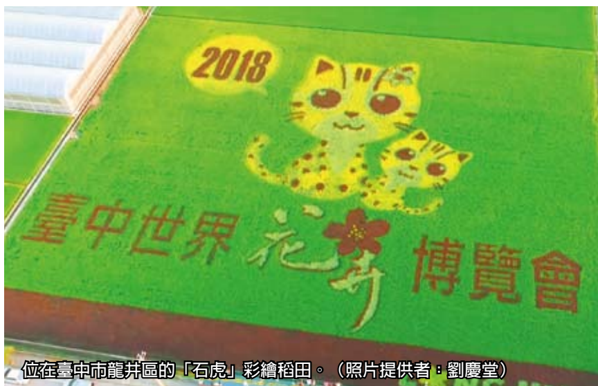
位在臺中市龍井區的「石虎」彩繪稻田。

泉國小學童和農民一起插秧，計算到了7月，稻田進入抽穗期，屆時彩繪稻田會變成整片的金黃色，因此建議最佳欣賞期是6月底前。