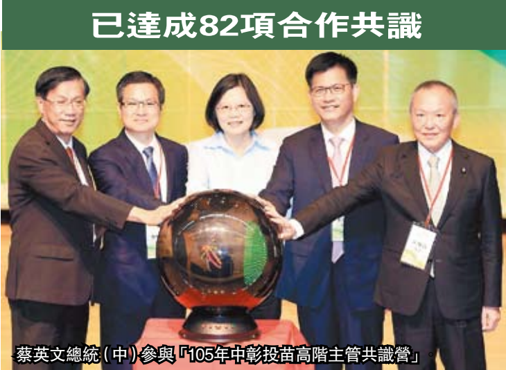
已達成82項合作共識

中彰投苗首長是在今年第一次會議中，決議共同籌辦「中彰投苗高階主管共識營」，由彰化縣政府主辦；共識營計畫從總統與地方首長的對談、區域治理專題探討，及各縣市標竿學習交流，逐步凝聚共識與合作。