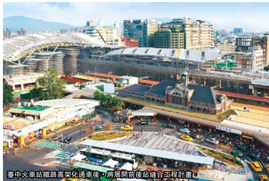
臺中火車站鐵路高架化通車後，將展開前後站縫合工程計畫。