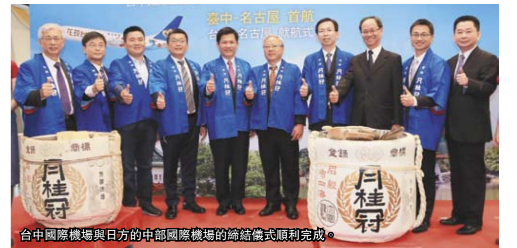
台中國際機場與日方的中部國際機場的締結儀式順利完成。

去年中台灣7縣市與日本昇龍道12縣市簽訂「觀光友好交流備忘錄」後，台中市政府持續推動雙方觀光發展及國際主題活動交流，台中國際機場更與名古屋中部國際機場締結為姊妹機場，成為名古屋在亞洲的第一個姊妹機場；兩城市包機直飛也從「不定期」提升為「每週定期3班」，可望為彼此帶動另一波國際交流。