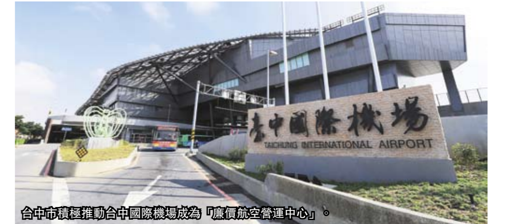
台中市積極推動台中國際機場成為「廉價航空營運中心」。

台中市推動台中國際機場成為「廉價航空營運中心」，兩年來陸續接洽十多家廉航辦理說明會；繼香港快運飛香港，今年1月越捷航空直飛胡志明市，3月台灣虎航也已進駐飛澳門，泰國越捷航空預計6月啓動「台中—曼谷」直飛航線，市府盼帶進更多東協旅客中進中出，帶動中台灣全面觀光發展。