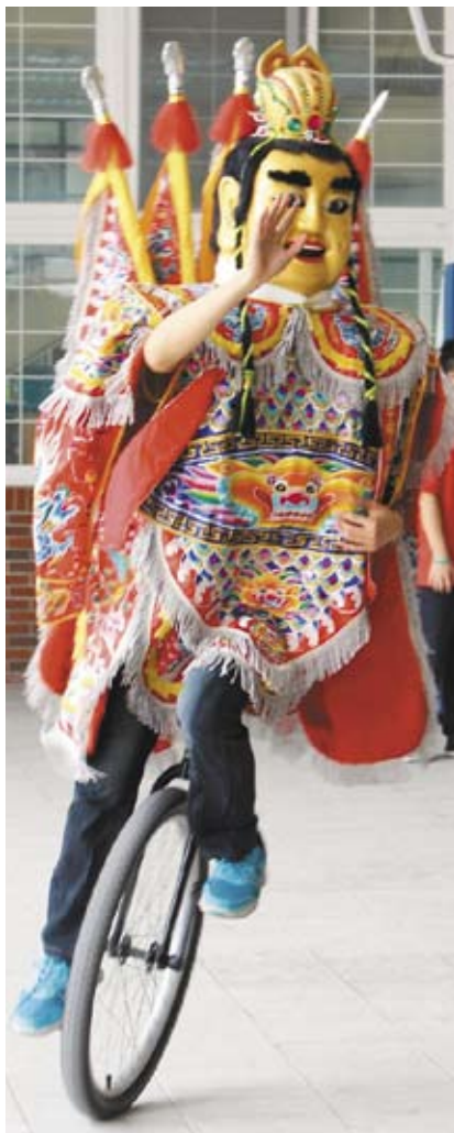
台中特殊教育學校師生5月騎獨輪車前進花東，學生都是特殊教育的孩子，他們穿著三太子服裝騎車，自我挑戰。

教育局長彭富源表示，騎乘獨輪車需要技術與耐力，特教學生熬過訓練，克服肢體障礙在台前表演，精神令人佩服。