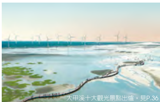
大甲溪十大觀光景點出爐，見P.36

發行人－林佳龍 總編輯－卓冠廷 副總編輯－吳超男、林尚賢、陳文信 編輯委員－陳瑜、黃少甫、張淑君、林宜夔、王珈宜 專案主編－林宜諤 企劃發行－台中市政府新聞局 / 台中市西屯區台灣大道三段99號文心樓8樓 / (04) 2228-9111 分機15211 / http://www.taichung.gov.tw 編印－艾德文生整合行銷有限公司 / (02) 2545-9691 創刊日期－2015年2月1日 / 發行日期－2016年10月1日