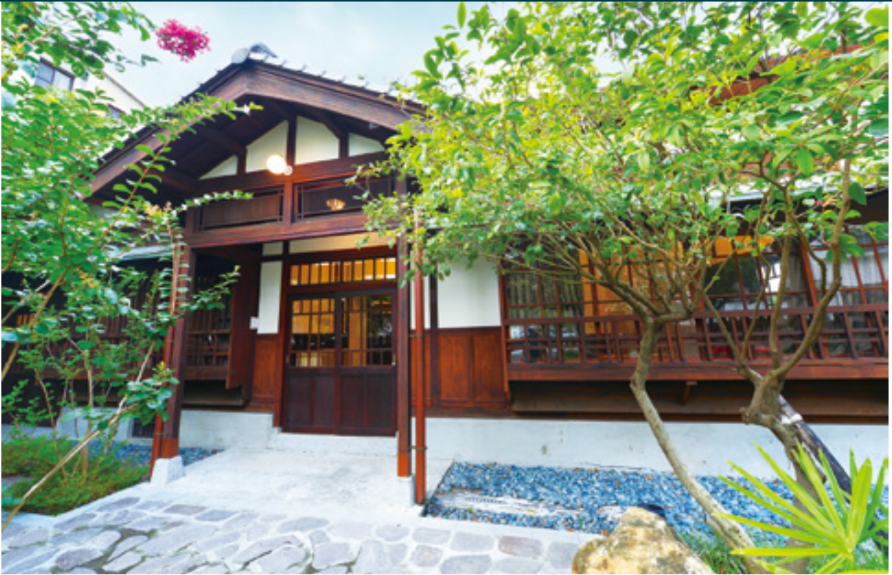
台中文學館原本是日治時期的警察宿舍，如今已成為台中文學的推廣基地。

「台中文學館」基地原本是日治時期警察宿舍，全區包含「台中文學館」及「台中文學公園」，面積約 1,800 坪；館區一邊面臨樂群街與自立街，緊靠著第五市場等傳統市集，深具濃厚的庶民生活況味；一邊銜接台中市的柳川，與林之助紀念館、台中師範學校（今為台中教育大學）等歷史建築以及大墩文化中心、國立台灣美術館等文教空間銜接串聯，是台中市重要的人文流域。