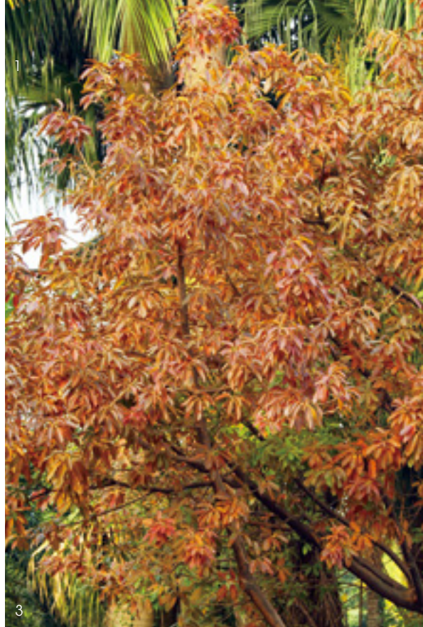
1. 結果期的雀榕滿樹紅果，吸引鳥雀來取食。2. 雀榕的白色托葉具有保護內部嫩葉的功能。3. 白色托葉脫落後，露出火紅的嫩葉。

這兩棵老樹保留了台灣原始林相的特徵，也是一個活生生的自然競爭絕佳教材，後續的演替過程，究竟誰贏誰輸，值得繼續觀察。