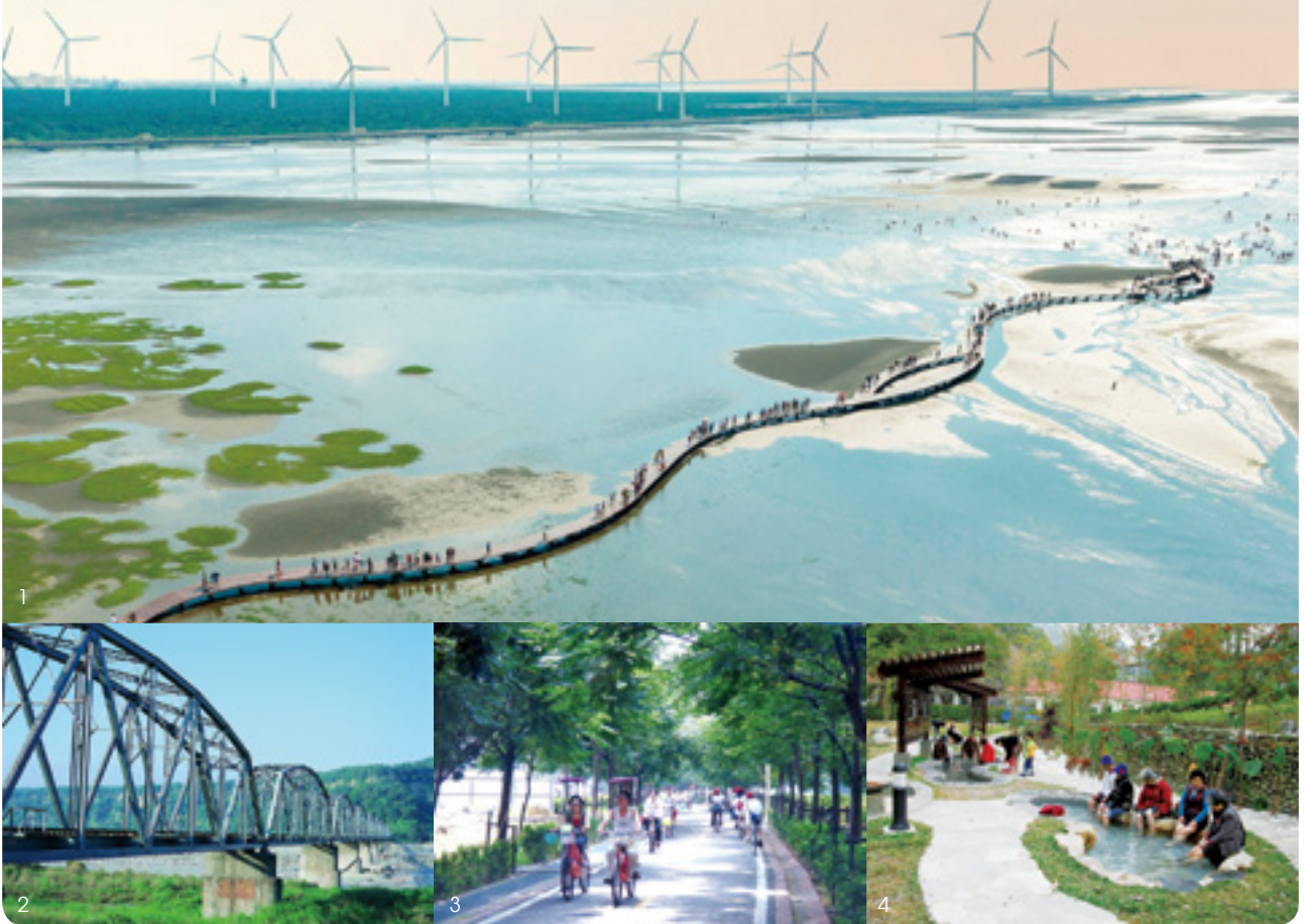
1. 以落日美景聞名的高美濕地，是「大甲溪十大景點」票選第一名。2. 花樑鋼橋橫跨大甲溪，是台灣鐵路舊山線上的四座鐵橋之一。3. 東豐自行車綠廊每逢假日人潮不斷。4. 在谷關溫泉風景區內的谷關溫泉公園，可以免費泡腳，放鬆身心。

大甲溪是大台中的母親之河，沿線孕育了豐富的物產和自然、人文景致，很值得國人深入拜訪。台中市政府觀光旅遊局舉辦「大甲溪觀光文化祭」，配合推出「大甲溪十大景點」網路票選，票選結果前十大景點，依票數高低順序為：高美濕地、武陵農場、東豐—后豐鐵馬道、大甲鎮瀾宮、谷關風景區、大雪山森林遊樂區、梨山風景區、泰安鐵道文化園區、石岡壩、新社白冷圳。