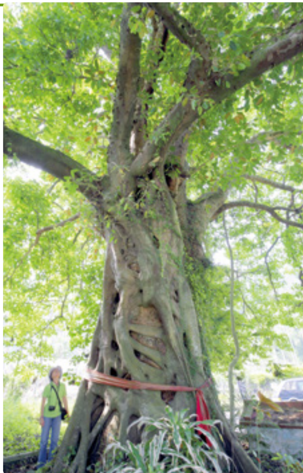
雀榕伸出章魚爪般的氣生根，將老樹樹幹緊緊包住。

這些榕樹對於大樹是可怕的惡魔，是無聲無息的殺手。但對於鳥類來說，雀榕結果卻是大快朵頤的自助餐廳，兩者有著很緊密的依存關係，是一個生物間互相合作，彼此獲利的有趣現象。