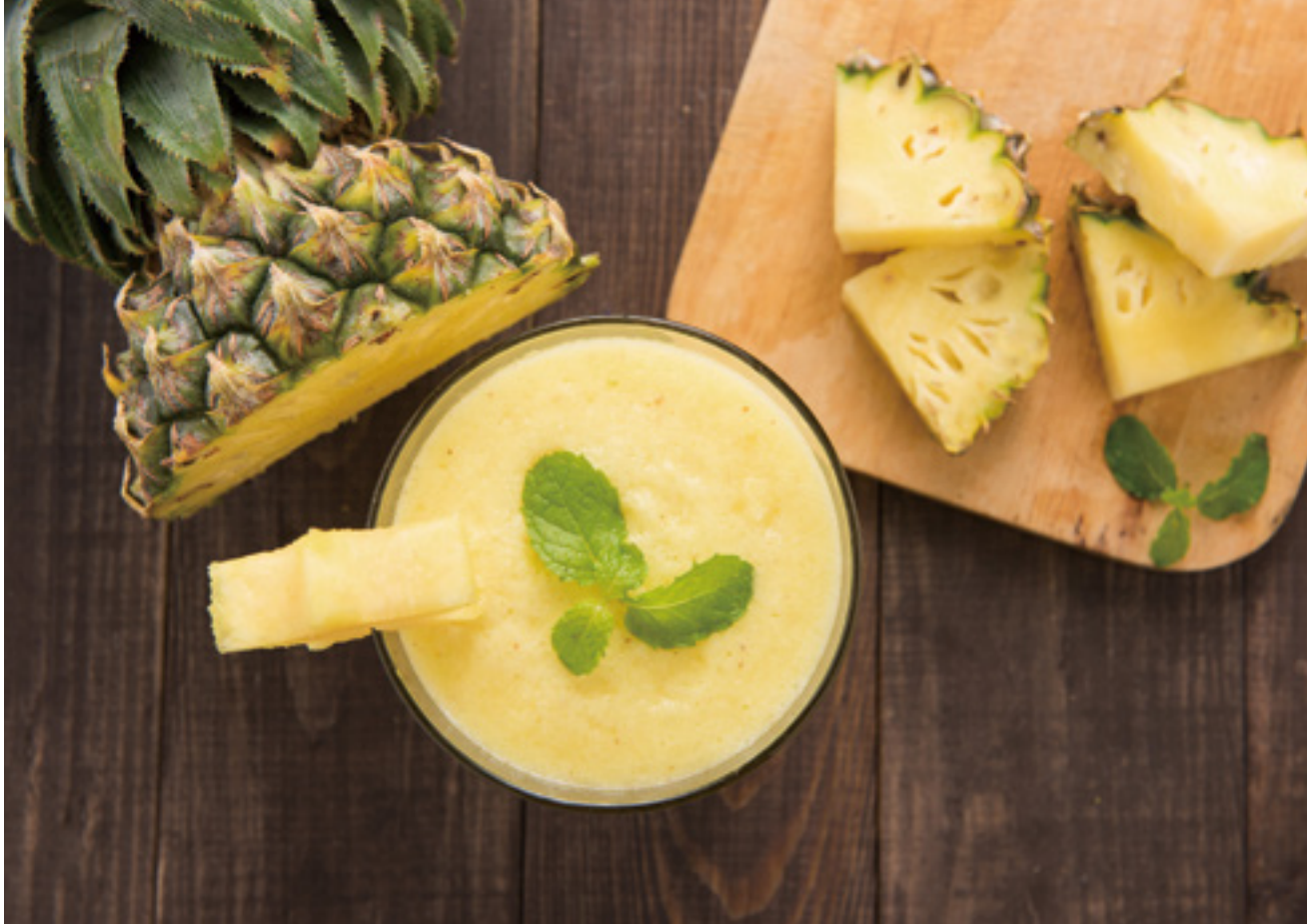
鳳梨含有的鳳梨酵素具有抗發炎、增加免疫力及溶解血栓的功效。