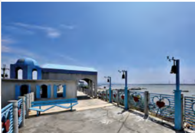
尋找消逝的台中「港」，見P.40