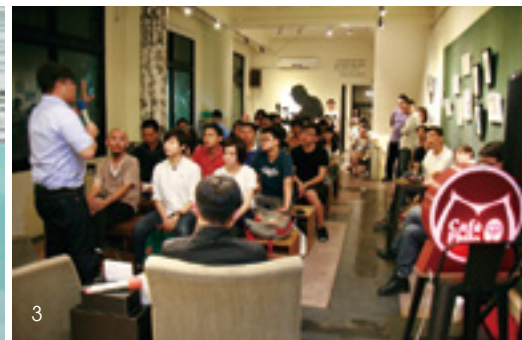
1. 好民文化行動協會的辦公室「好民邸家」，黑板上是他們計畫要做的事。2. 《好民報》是好民文化行動協會發行的刊物。3. 哲學星期五（Café Philo）是每週固定舉辦的免費公民論壇。