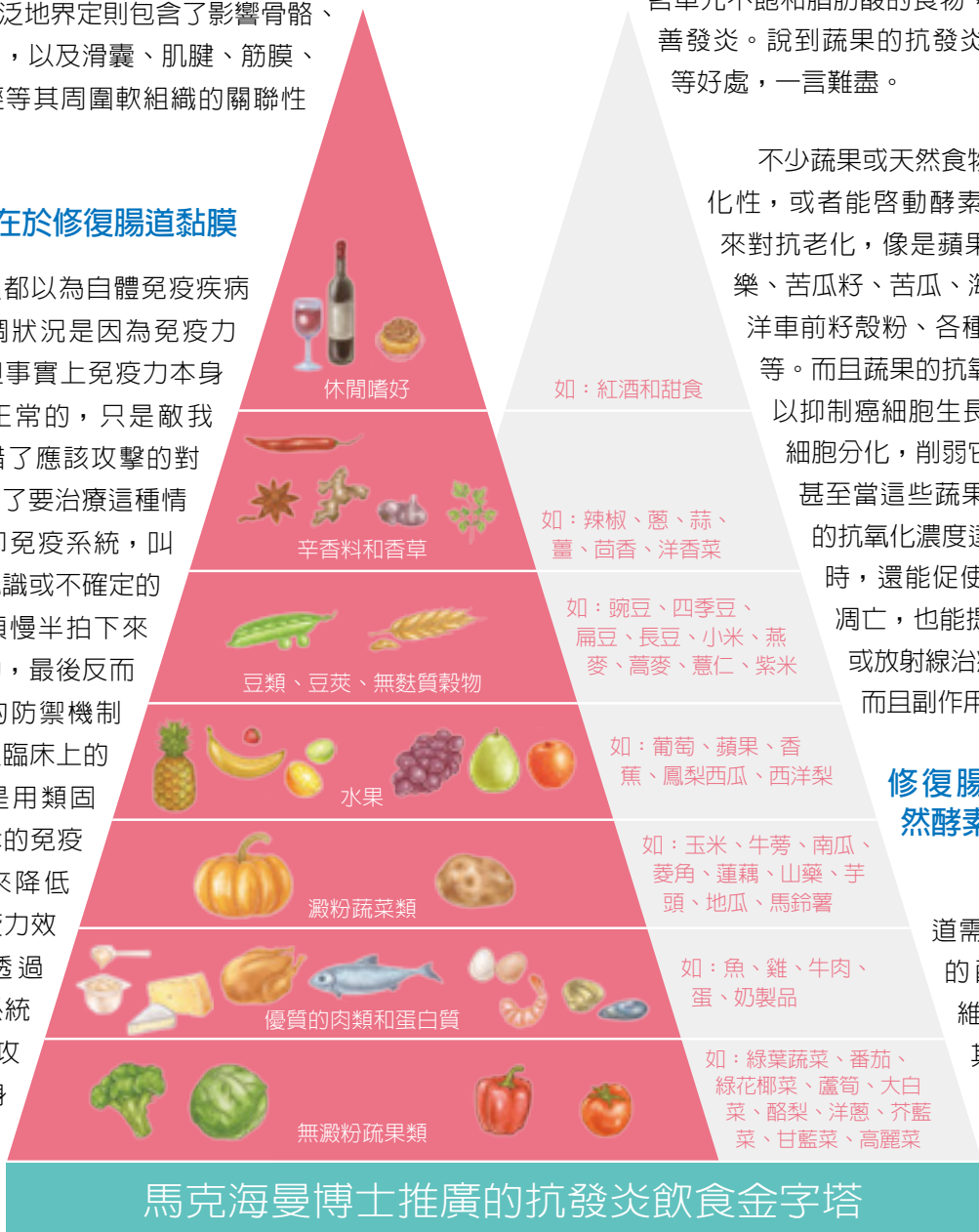
馬克海曼博士推廣的抗發炎飲食金字塔