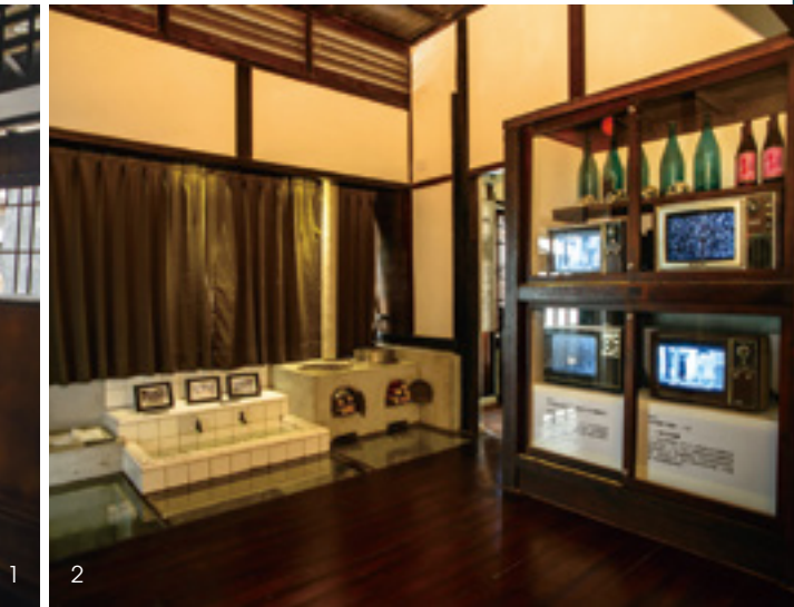
1. 整個場館空間，大膽運用了「減量」的手法，讓歷史建築述說精彩的文學故事。2. 原有的廚房空間作為「社會關懷與批判」的展區，呈現作家對民生、社會議題的關切。

發現建築師企圖將之打造成一處異質桃花源的意圖，室內主要空間結合枯山水意象，與後院飛瀑似的榕樹氣根聯成一氣，讓空氣中自然散發出強烈的文學性，猶如一處令人屏息的文學劇場。靜坐景石之上，腳邊撩撥起水波漣漪，溪魚嬉戲之間，浮現台中城區、山城、海線及屯區各場域的文學訊息，讓您一窺作家、作品與台中地理關聯的印象，然後在書牆上的書籍、電子書中，延伸閱讀。造訪這個空間時你會發現：當你正欣賞著這個迷幻的風景時，你自己也已經成為風景的一部分！