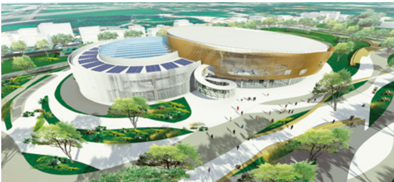
后里馬場園區展館模擬示意圖。

2018年，台中市將舉辦世界花卉博覽會，將台灣的精華與美好放入其中，向全世界展現這座美麗之島，傳達島上人民最珍視的綠色、自然與人文精神，進而珍惜這片土地，並以之為榮。