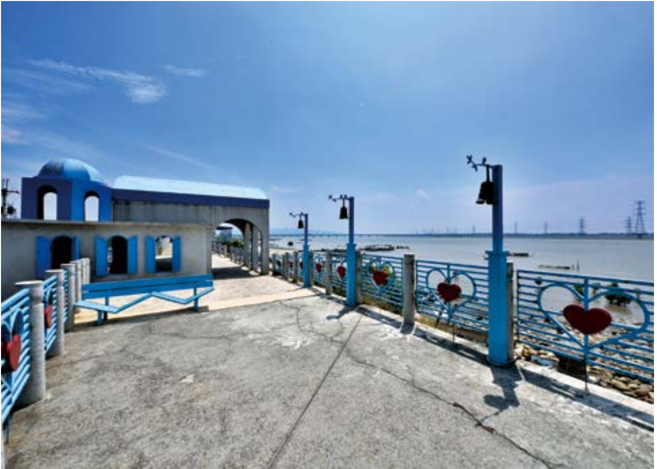
The former Shuiligang was renamed Lishui harbor. Today, its Greek-style scenic viewing platform is a favorite for visiting tourists and couples.