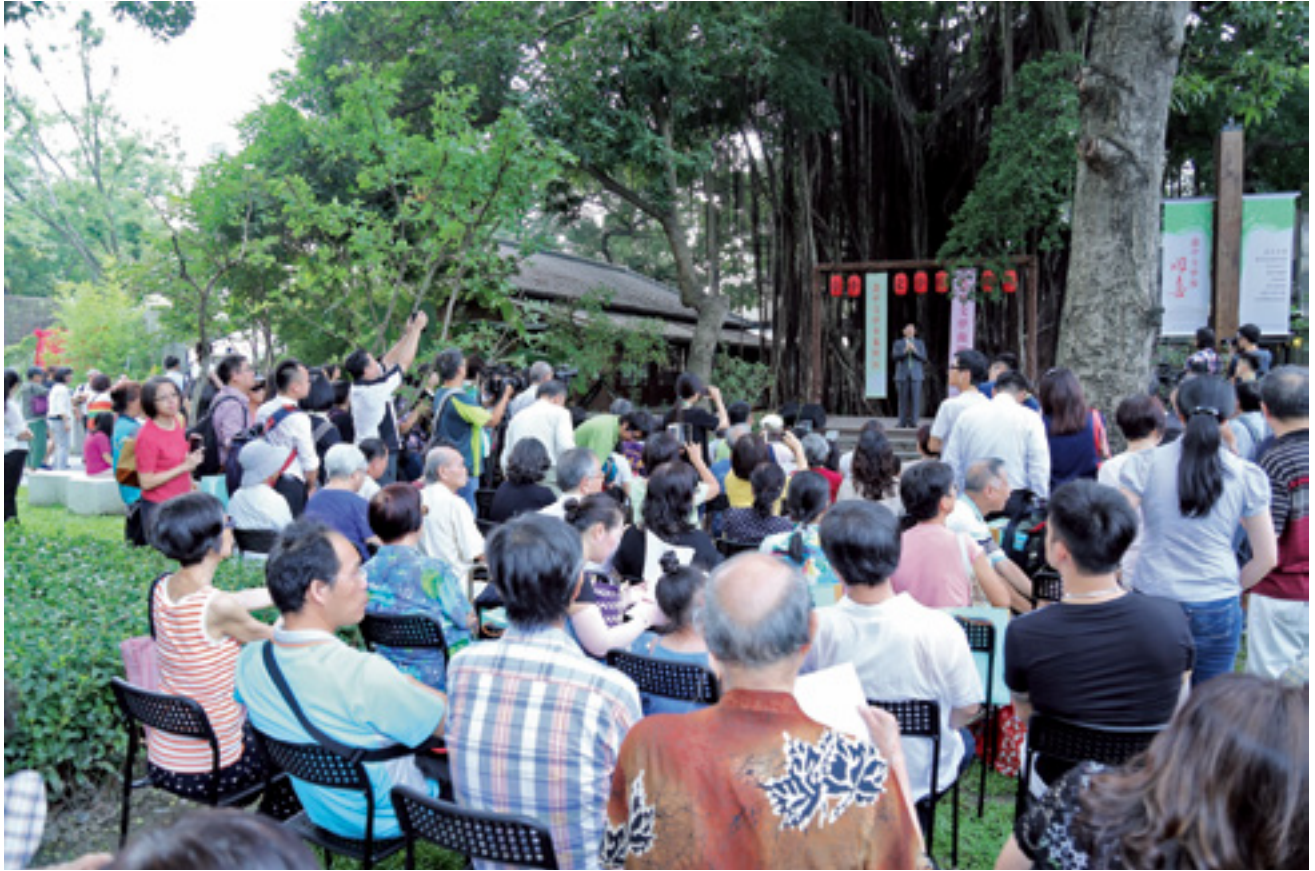
台中文學館已於 8 月 26 日全面開館，並舉辦連續兩、三個月的宣傳活動。圖為市長林佳龍在開幕時致詞。

最 近，無論南北東西，稍具文化敏感度的人，或許會在學術研討會或文友聚會場合，聽到有關「台中文學館發燒」、「台中起風了」等有趣的耳語。