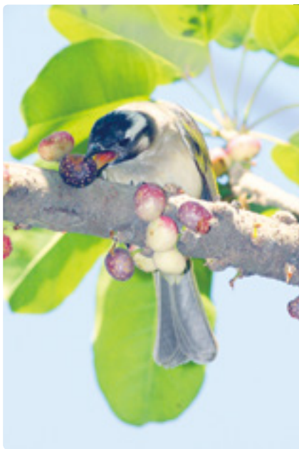
白頭翁正在吃雀榕果實。