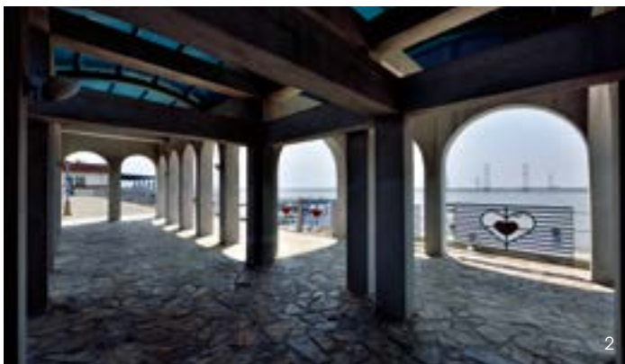
1.2.Taichung's "Atlantis", located beneath Lishui harbor, used to be one of central Taiwan's three major ports.

What was once Shuiligang by Dadu River is today Lishui harbor in Lishui township, Longjing district. Its scenic Greek-style viewing platform on top of a river embankment is a famous tourist spot, popular with couples and groups who come here to bike and enjoy beautiful sunsets and evening scenes under starry skies. Nowadays, it's certainly hard to imagine that this fascinating place also has a significant historic legacy related to famed central Taiwan pirate Tsai Qian.