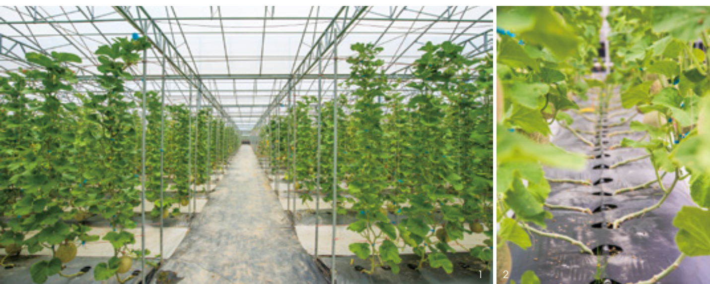
1. 溫室的地面多以塑膠布覆蓋，雜草無法生長，可省下大量的除草人力，也不需要噴除草劑。2. 塑膠布底下是一條條黑色的灌漑管線，這是從以色列引進的滴灌技術。

果實長出來後，還得要紋路美，賣相才會好。除了重量，網紋要完整、紋路寬、立體，才代表這顆瓜的成熟度夠，但要種得美，需要注意的細節就多了。從開花授粉、初期果實的膨大、到後期網紋的形成，每個階段的肥料和水分管理都不一樣，必