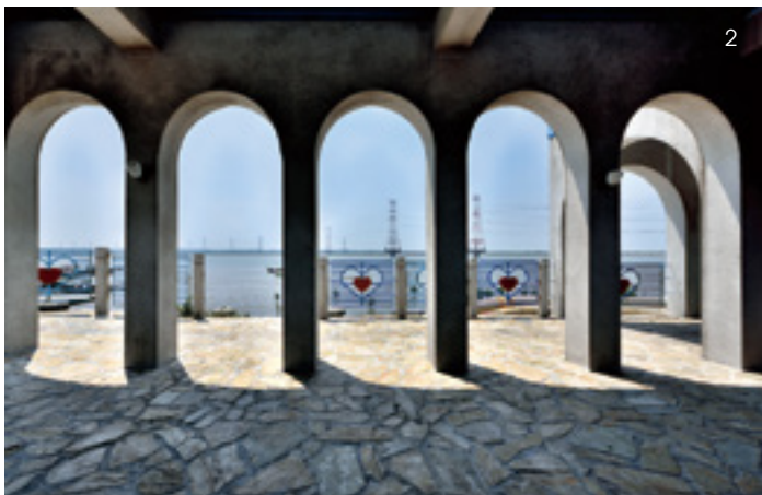
1.2. 昔日的水裡港，今日已成為「麗水漁港」。堤防上豎起一座希臘風情的觀景平台，成為許多遊客與情侶造訪的地方。