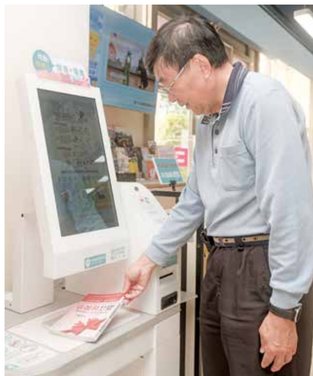
讀者可利用自助借還書機自行完成借還書程序。