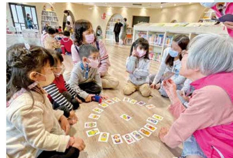
市圖的兒童閱覽區時常舉辦活動