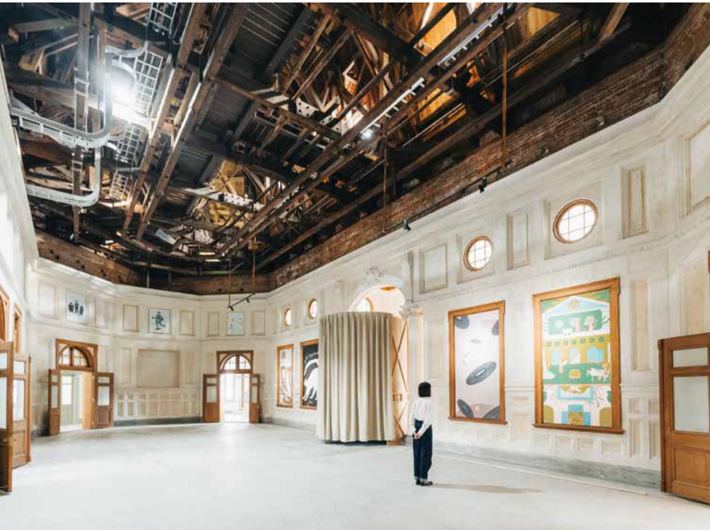
「城中美術館」由插畫家以貓的形體呼應貓道，進行一場美感激盪。

時空交疊的文資場域經過修復，能夠開啓怎樣的的可能性？歷經 4 年，串遊季重回臺中城，串聯過去、現在與未來，「另存新檔」後，與民衆一同回顧過去的設定，並重新定義對於這座城市的未來想像。