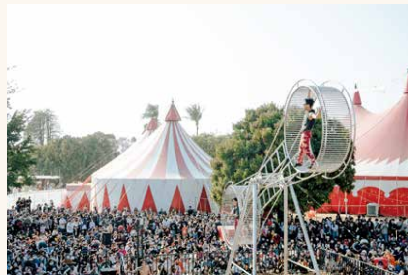
FOCA 擁有全臺首座大型馬戲篷，更打造 8 萬人次造訪的 FOCASA 馬戲藝術節。