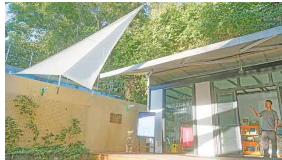
貓頭鷹故事屋將親子共讀帶進桐林社區