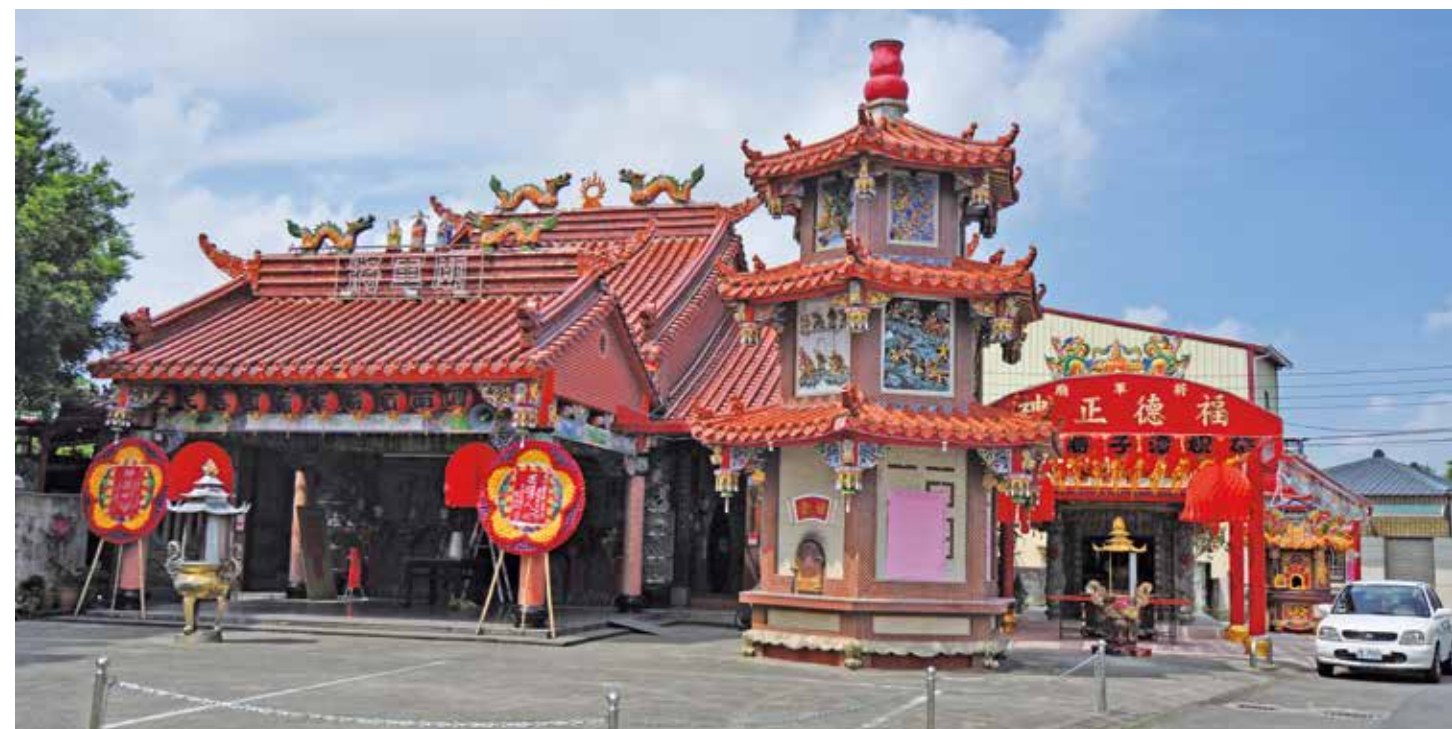
頭家厝將軍廟全景

位處頭家里和平路（原稱頭家巷）上的「將軍廟」，廟中奉祀 68 甕抗日義民骨灰罈，為中日於甲午戰爭簽署馬關條約，割讓臺澎金馬於日本，隔年 1895 年侵臺，8 月間日軍由葫蘆墩欲往彰化八卦山方向前進，軍隊抵頭家厝與舊社溝背附近，與當地民兵義軍發生兩天一夜戰役，日方文獻稱為「頭家厝之役」，而臺灣稱為「溝背之役」，後於 1990 年間大家樂盛行，信眾捐款不斷，2 年內廟宇即建築竣工，為見證抗日史蹟最佳鄉土教材。