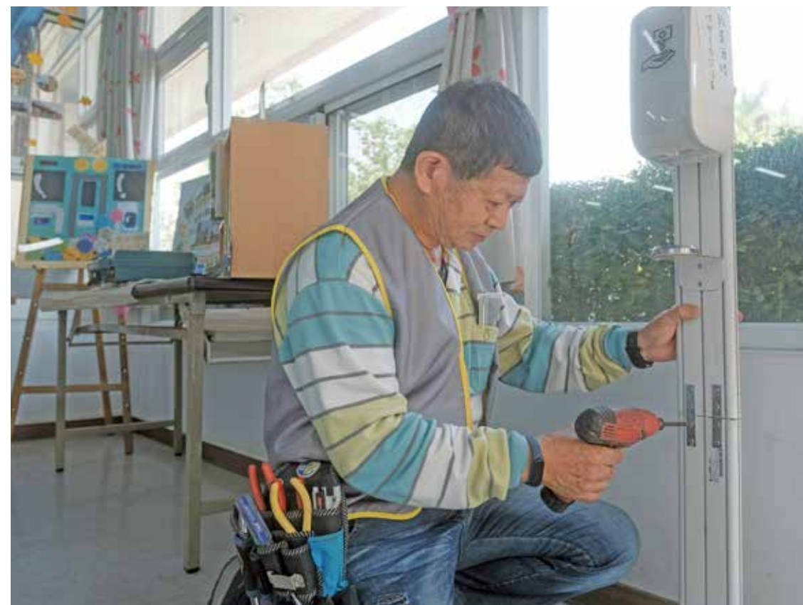
從大到小的硬體設施陳進發都能維修