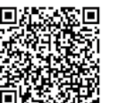
書寫臺中城粉絲專頁