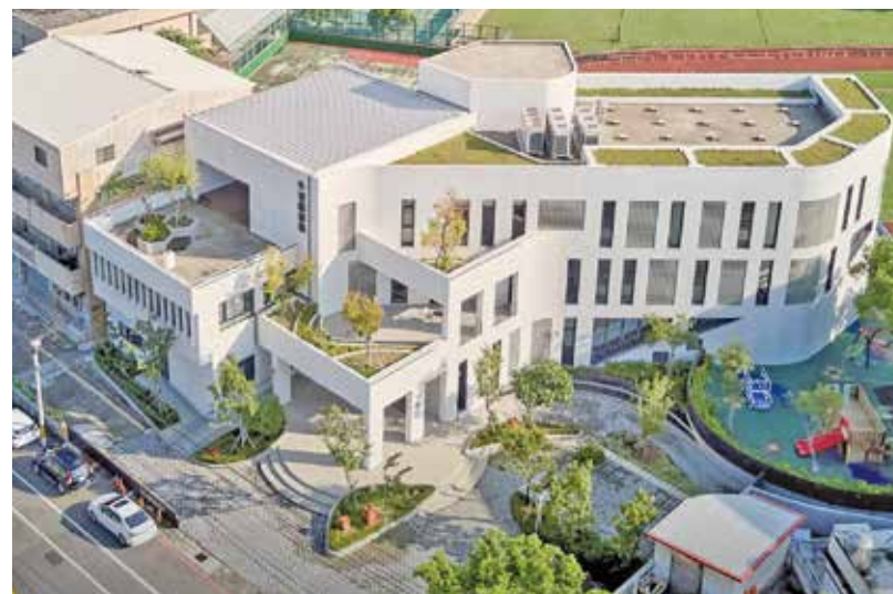
有「小白宮」美稱的外埔圖書館獲國家卓越建設獎肯定

總館3樓的青少年閱覽區，除了青少年喜愛的漫畫書之外，其它適合青少年閱讀的散文等文學書籍，內容都很不錯，不同的年齡層閱讀，也會有收穫。