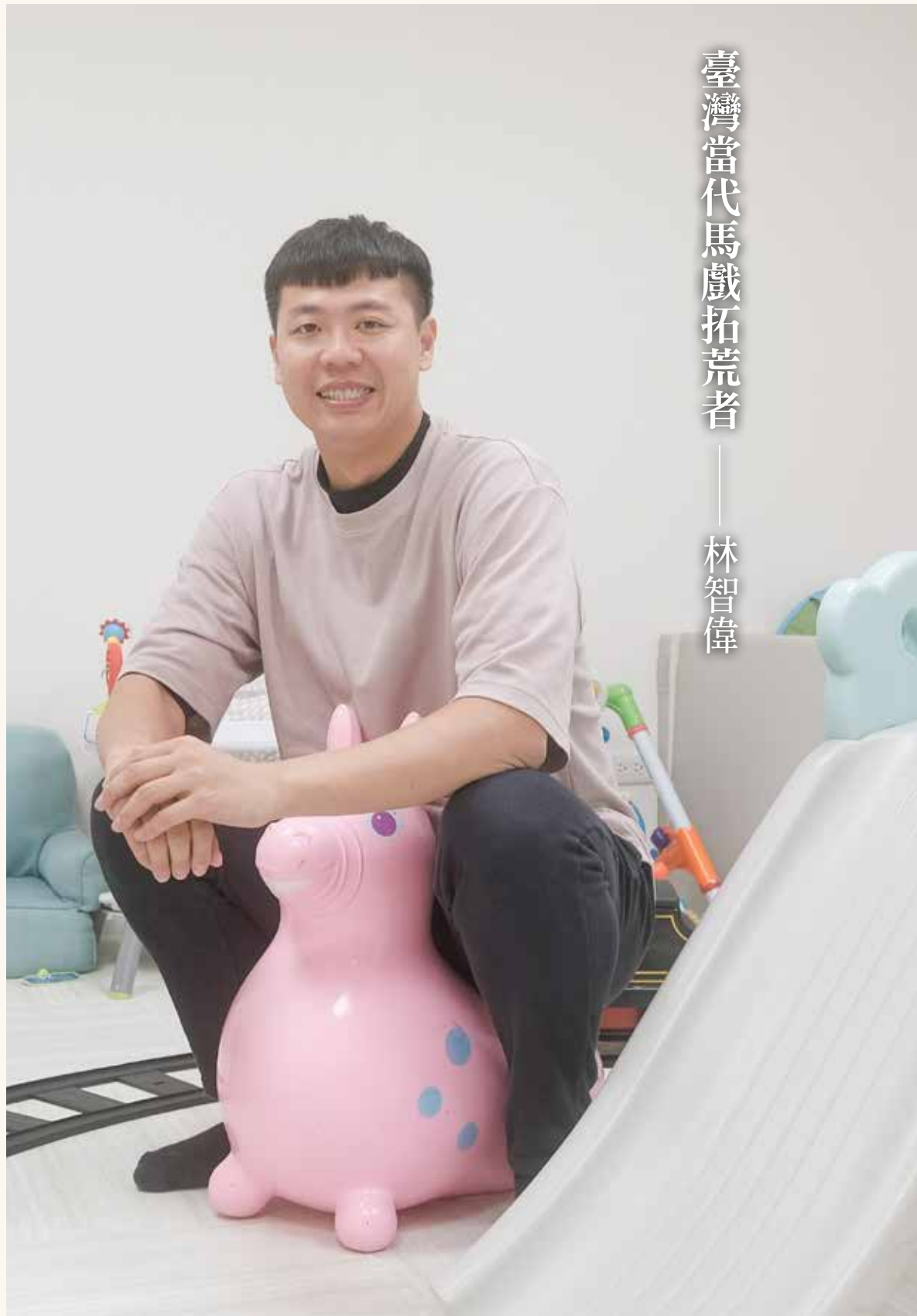
因應團內「馬二代」陸續誕生而打造的親子遊戲室