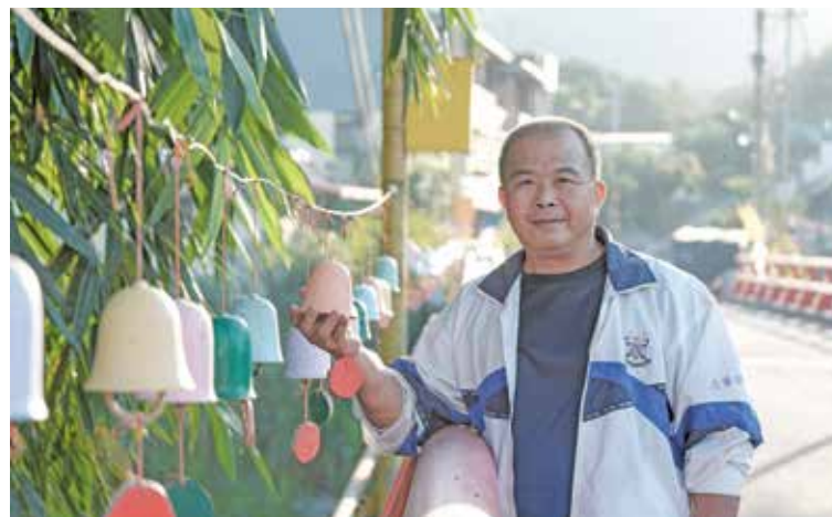
貓頭鷹風鈴文藝橋已成為打卡熱點