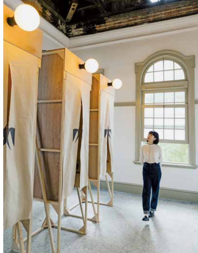
「請問市長室」邀請觀者一同想像州廳的未來