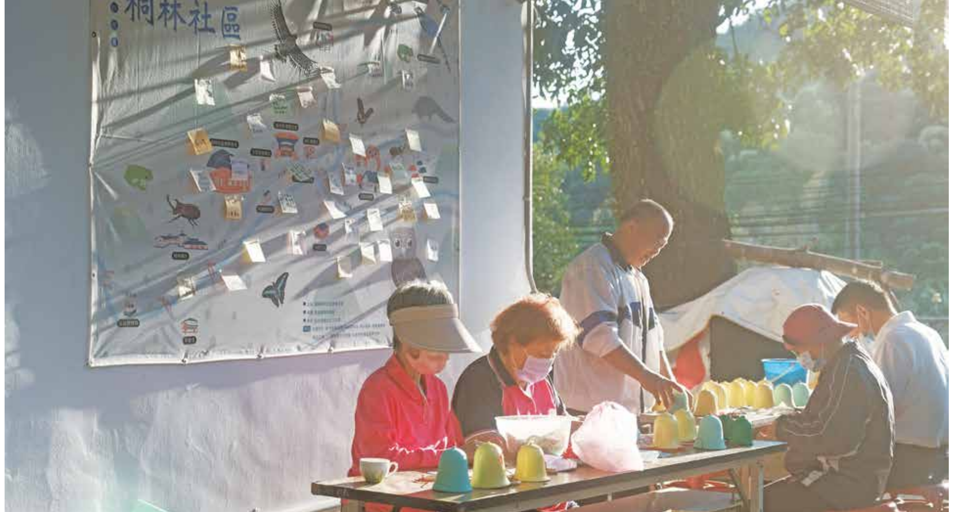
社區志工正在準備阿罩霧風鈴文藝季的布置