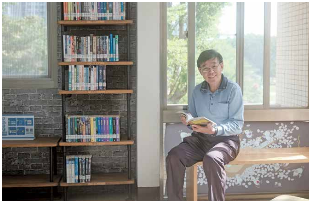
游校長邀請大家善用臺中豐厚的圖書資源