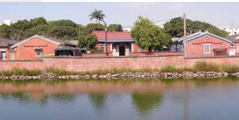
頭家厝和泰堂林家祠堂（攝於 2004 年）

還有位於嘉仁里中山路與 74 號快速道路叉口附近的「王氏祠堂」，為早期至大陸經商有成的企業家王建堃董事長所建，因為要紀念其父親王永棋，而稱之為永棋館，於 2016 年所精心建造的 5 層樓 RC 建築，如今已成為臺中市王氏宗祠，祠內 1 樓除了奉祀開閩三王王審知三兄弟的泥塑神像外，3 樓亦典藏著近千本各姓氏的族譜與文史專書，顛覆一般人對祠堂的概念。