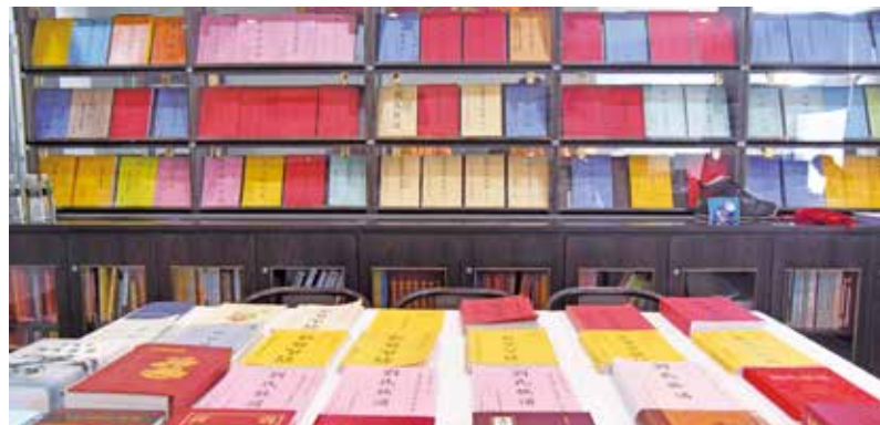
王氏宗祠典藏各姓族譜