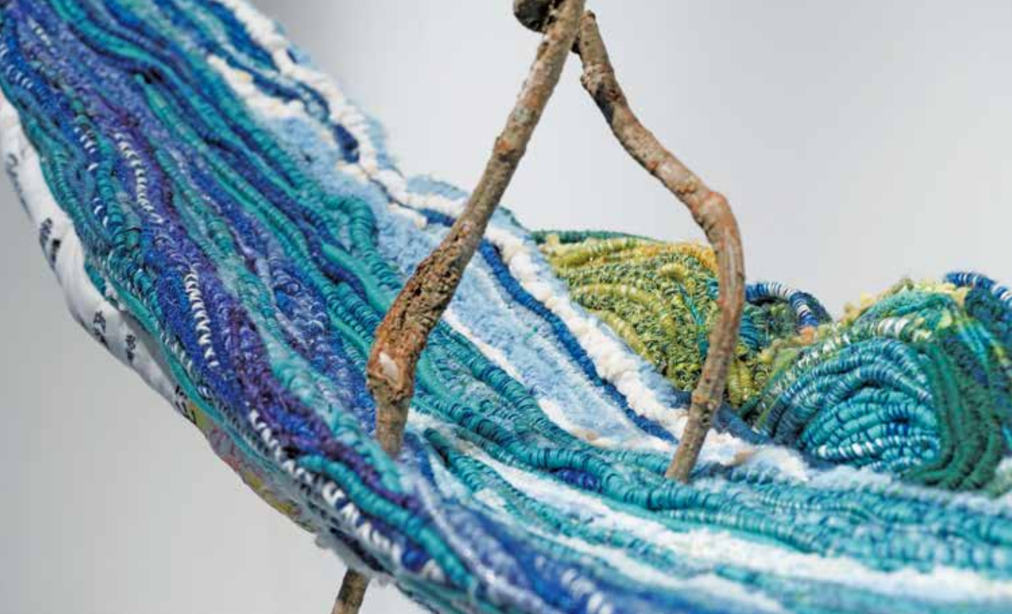
人間國寶尤瑪·達陸藝師作品《「聽說……但是」——逆寫歷史》