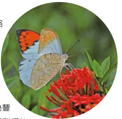
怡藝園內生態極為豐富

位於環中路近中山路的「怡藝園」，為林姓家族私人植物園，園內臺灣原生種植物超過數百種以上，並有一條龍溝圳由中穿流而過，使得園區動植物生態變得更為豐富，是大臺中都會區，很難得一處生態休閒寶庫。