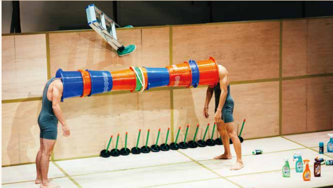
FOCA 勇於挑戰各種演出形式