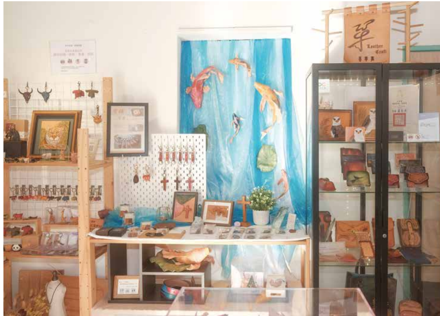
店內擺設溫馨，更有信仰主題的布置。

他提到選擇皮革作為創作素材很重要的其中一個原因，是皮革來自生命的犧牲而成為我們的祝福，正是信仰中的恩典，且皮革所保留的溫暖，亦非常適合傳達這一份永恆的愛。像是「吾革事」非常受到歡迎的寵物雕刻系列作品，正是來自於無數主人與寵物間的濃厚情感，他總是靜靜地聽著來訪委託的客人們訴說，那些關於從生到死的陪伴點滴，還有家人間的情感寄託，將這些真摯情感都藉由他的手轉化為動人的深刻藝術。