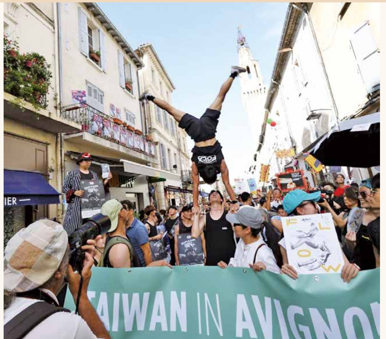
2023年 FOCA 遠赴歐洲參與法國外亞維儂藝術節