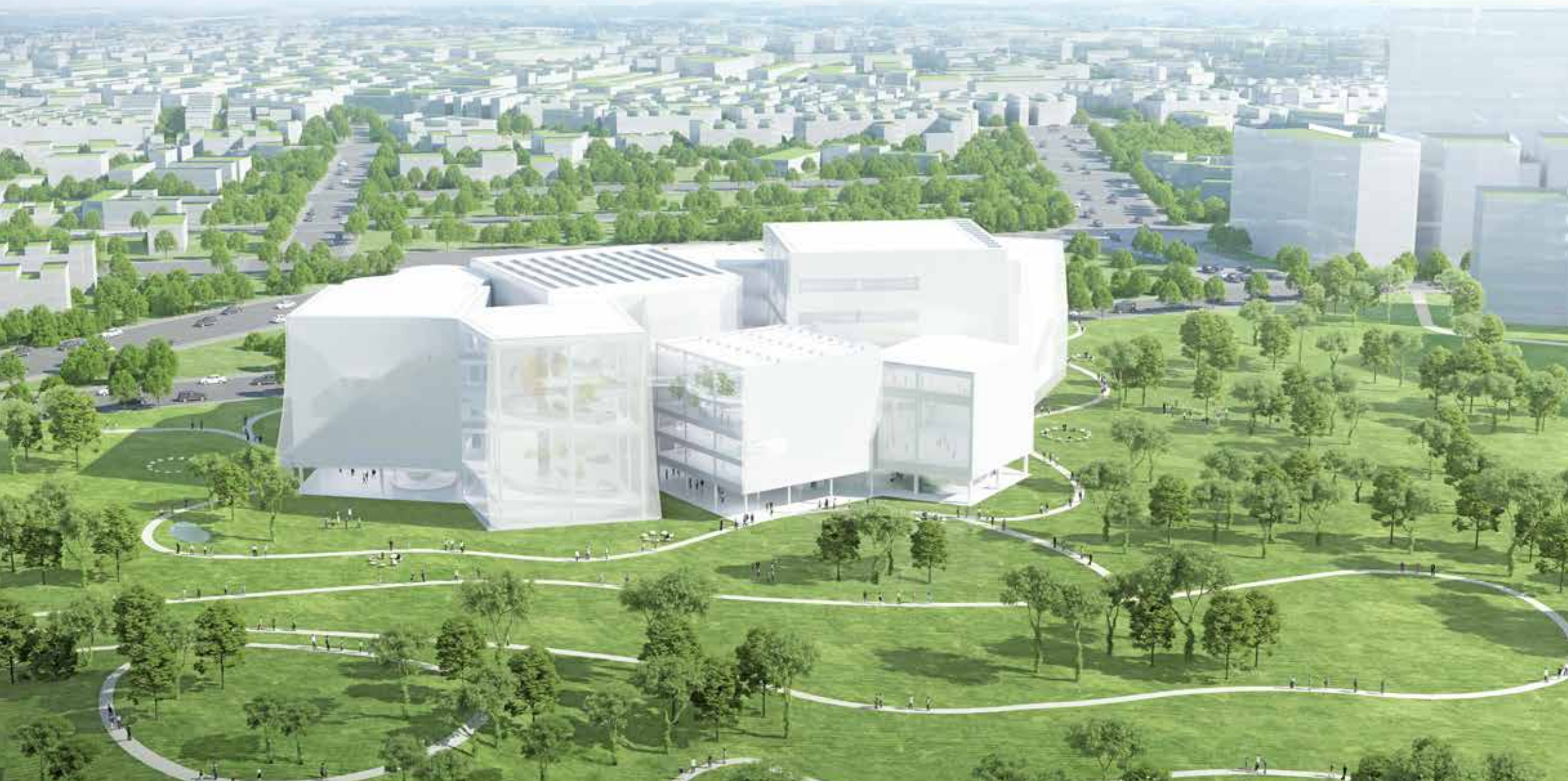
綠美圖將成為臺中城文化發展的新指標