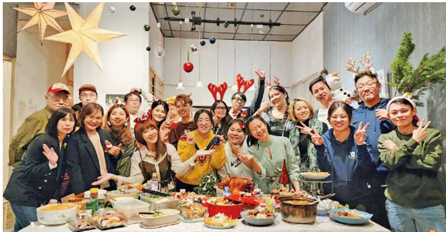
下班族聚會每年舉辦溫馨的聖誕派對，一人一道菜加上交換禮物留下難忘回憶。