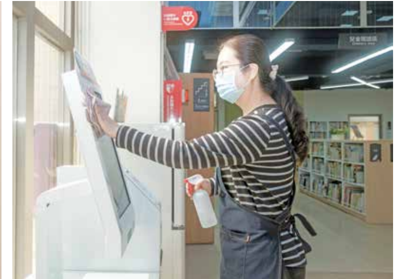
清潔、維護環境讓民衆安心使用設施