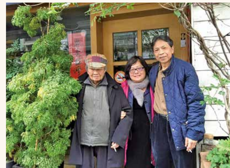
2016年封德屏親赴桃園龍潭探望人稱臺灣文學之母的鍾肇政（左），右為其子鍾延威。

封德屏引領的團隊，為文壇豎立了老者安之，朋友信之，少者懷之的行儀典範。那位古道熱腸的俠女在紀州庵現身，以作家私房菜留住來訪者的胃，薪傳著文學的火種，傳承著文學的倫理，在峰頂持續綻放著曦光，為文學的未來照亮前行的道路。✍