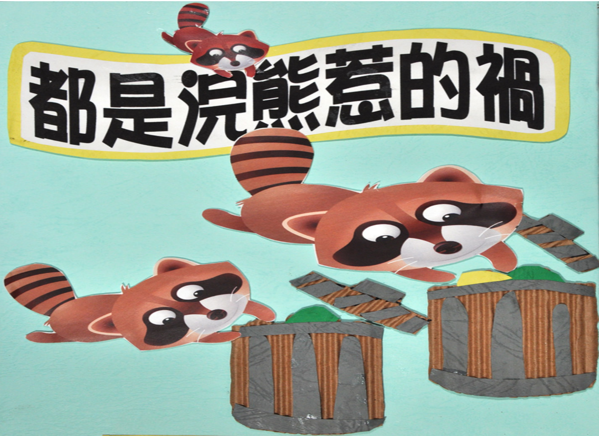
圖 · 文：黃子睿 · 黃水源