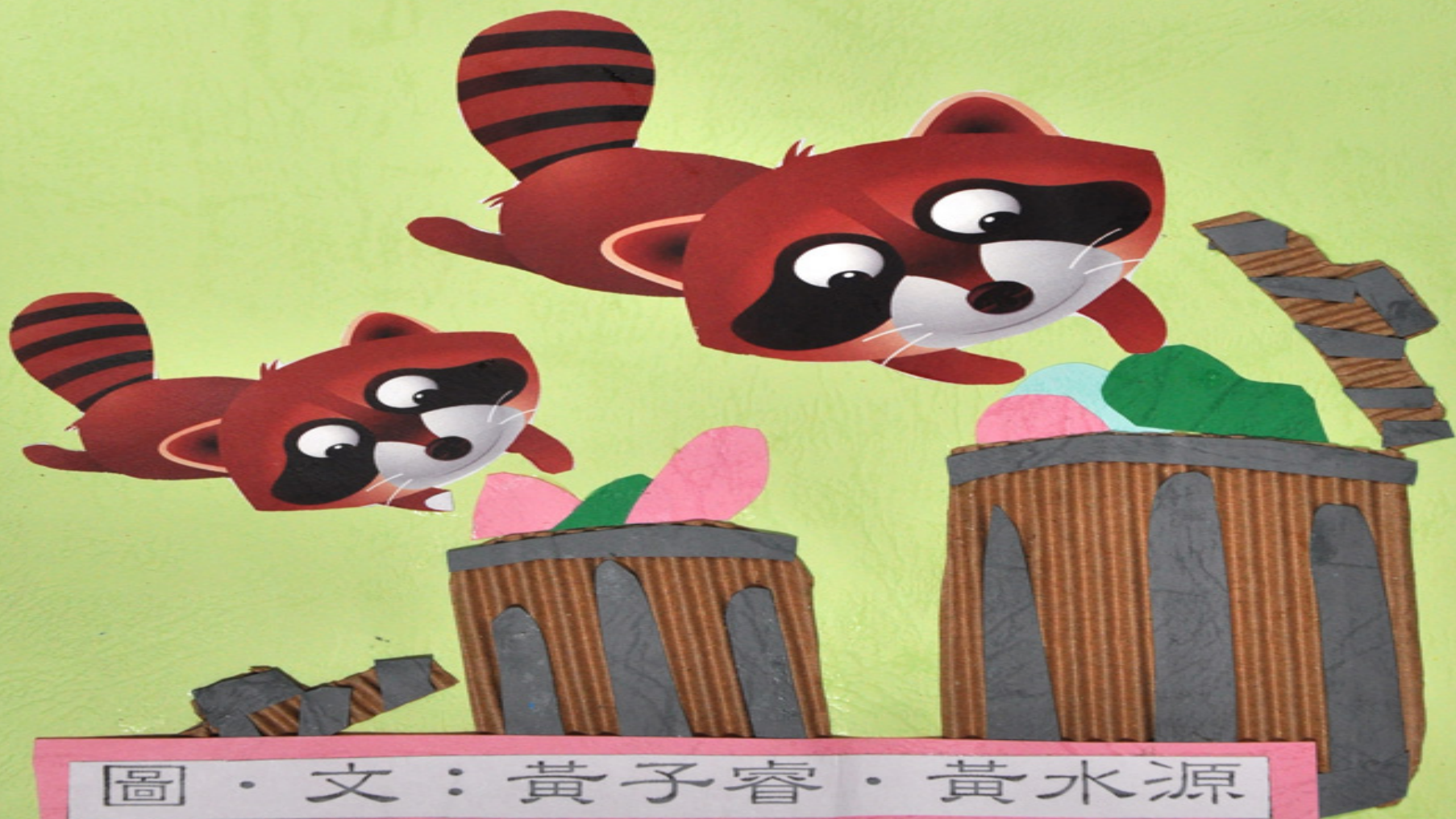
圖 · 文：黃子睿 · 黃水源