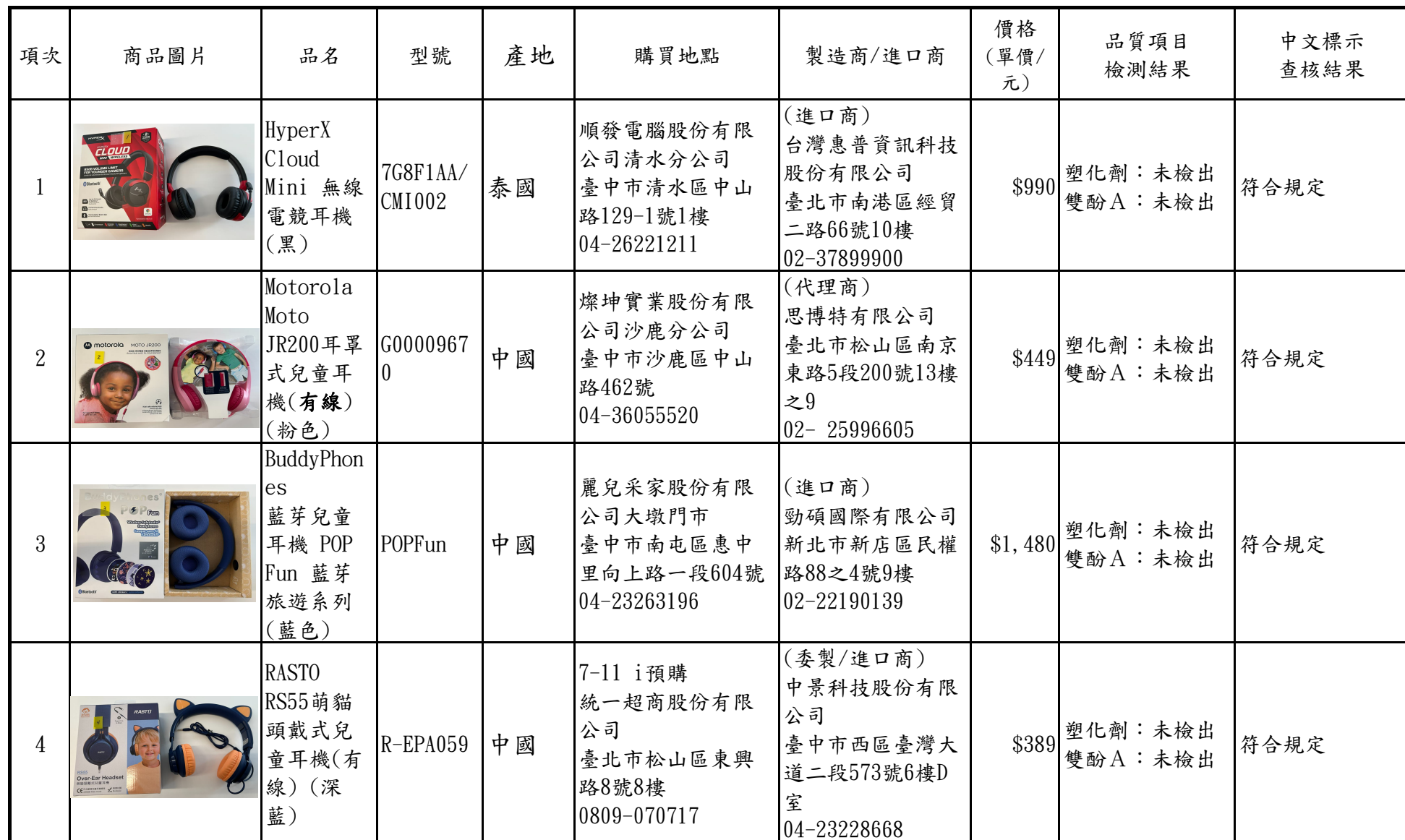
臺中市政府115年度市售兒童耳機檢測及標示查核結果彙整表