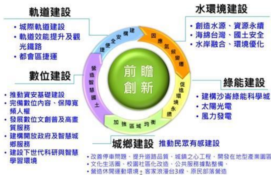
圖 1：前瞻基礎建設計畫說明

因應國內外新產業、新技術、新生活趨勢的關鍵需求，行政院會在今年3月23日通過國家發展委員會擬具的「前瞻基礎建設特別條例(草案)」，內容含蓋軌道、水環境、綠能、數位科技與城鄉建設等五大項，以未來30年臺灣發展需求為考量，期透過促進區域平衡及地方整體發展，達到奠定國家發展基礎之目標。