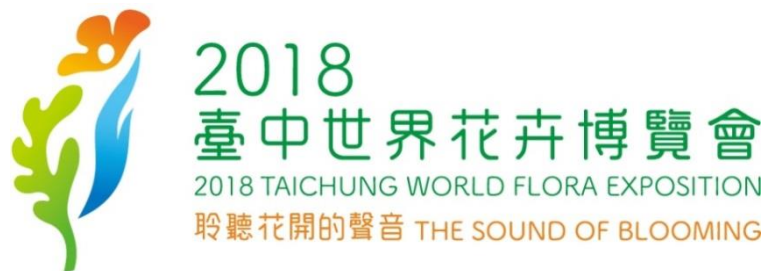
圖 2：2018 臺中世界花卉博覽會標誌

本次臺中花博展覽主題訂為「花現 GNP 自然怡人新花都 (Discover GNP: Green, Nature, and People)」，呈現 Green 綠色生態、Nature 自然生產及 People 人文生活三者和諧發展的美好價值，而此亦展現在臺中花博標誌中，分別由橘色花朵、綠色樹葉、藍色水流代表；其間以「圖地反轉」形式穿插人形，象徵以人為本核心價值，代表由人串起生態、生產、生活。