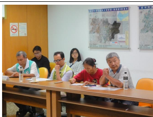
出席土地所有權人意見交流(四)