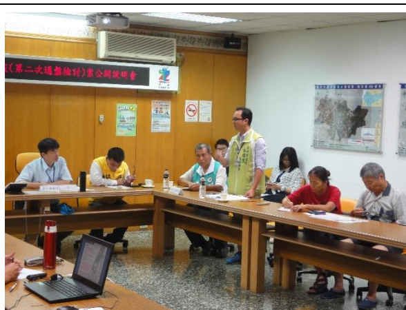
出席土地所有權人意見交流(三)