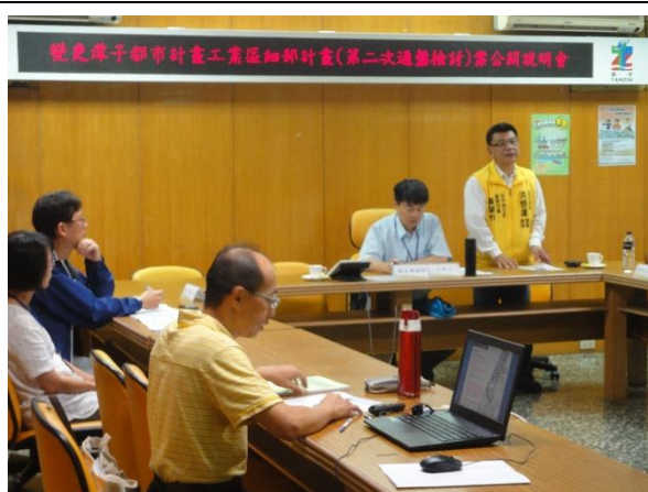
出席土地所有權人意見交流(一)