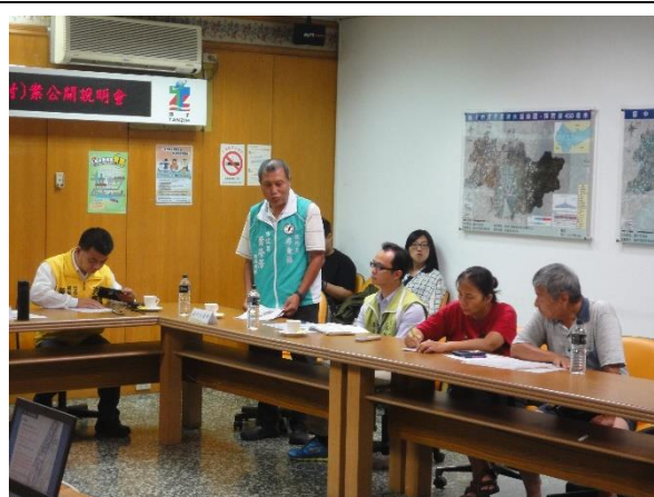
出席土地所有權人意見交流(二)