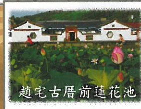
趙宅古厝前蓮花池