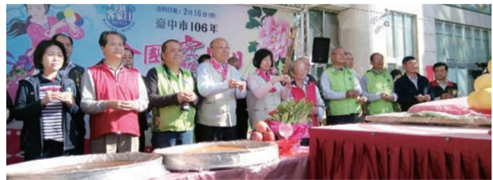
▲副市長帶領原、客長官一起祭天祈福，展現本市族群共榮之特色。