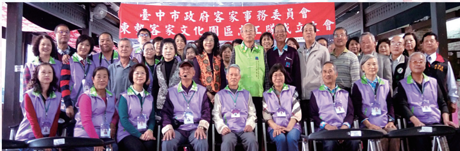
▲與會觀禮來賓及志工隊大合照

本會主委除感謝志工們公益付出，更表示支持市長推動的「HOPE 125 志工首都」，期盼每位鄉親每月提供至少2小時的志願服務，可創造出5倍的公民社會力量，如此齊心協力下，讓山城客家文化成為臺中最美麗的風景。