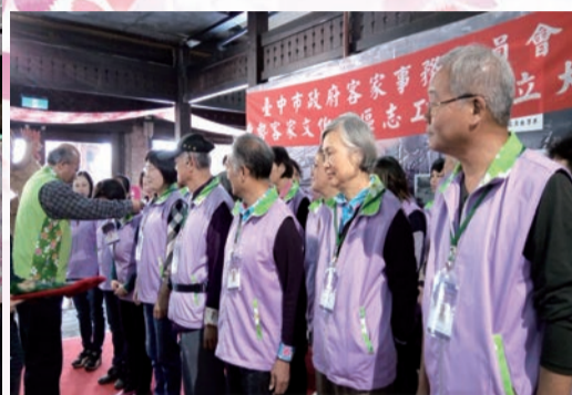
▲主委一一為志工們配戴志工服務證