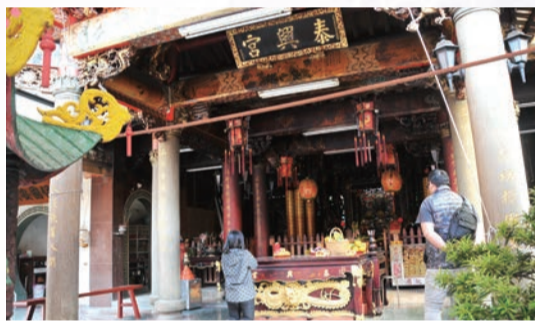
▲泰興宮為居民的信仰中心