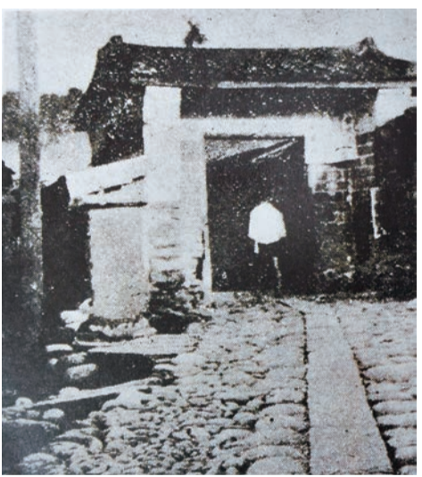
▲早年坐落村落的隘門守衛地方安全

泰興宮不只是大茅埔庄地理中心，也是象徵庄民的精神堡壘，除了廟中供奉三山國王外，在村落東西南北四處設有「將寮」，是供奉將軍令旗的小祠