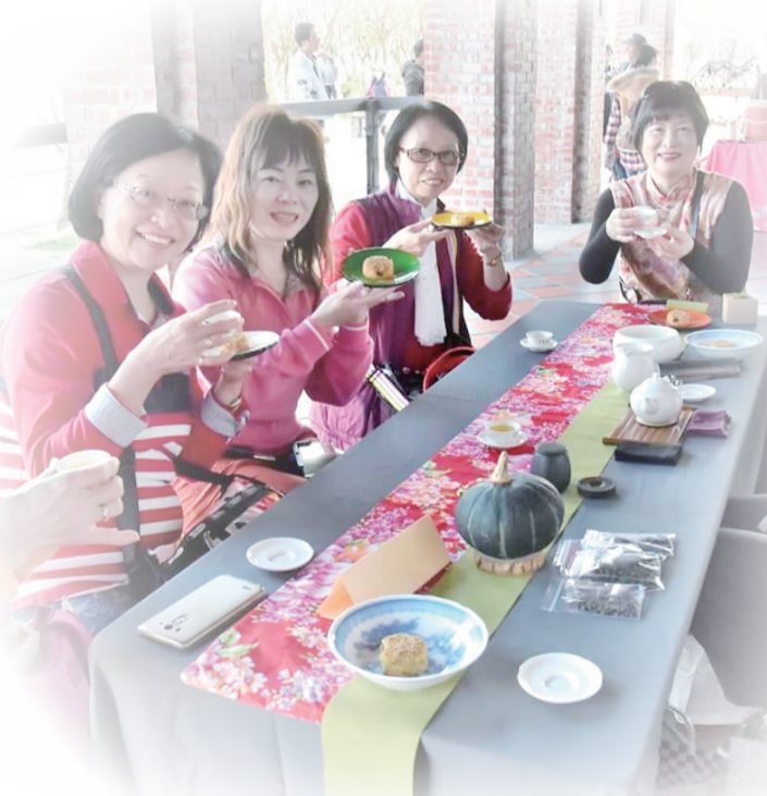
▲茶香茶點一級棒，民眾讚不絕口。