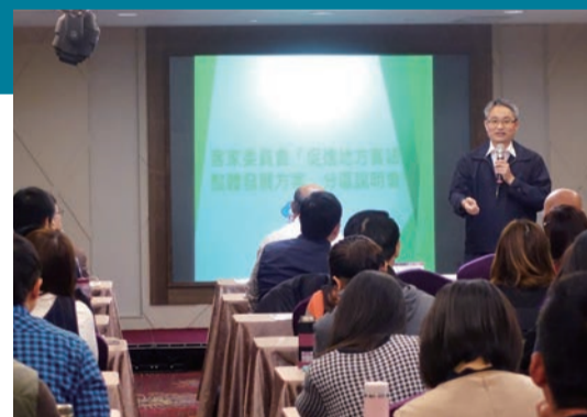
▲客委會綜規處江處長說明「促進地方客語整體發展方案」精髓

客委會綜規處江處長表示，過去客家活動多為嘉年華式的活動，缺乏整體規劃難以延續，新推動之「促進地方客語整體發展方案」，鼓勵各級地方政府以客語為主軸，運用整體思維推動客家語言及文化之整體發展。參與評核之地方政府分甲、乙二組，各組應於106年3月31日前依轄內實際狀況，因地制宜，提出客家整體發展計畫，客委會將依評核結果予以獎勵。