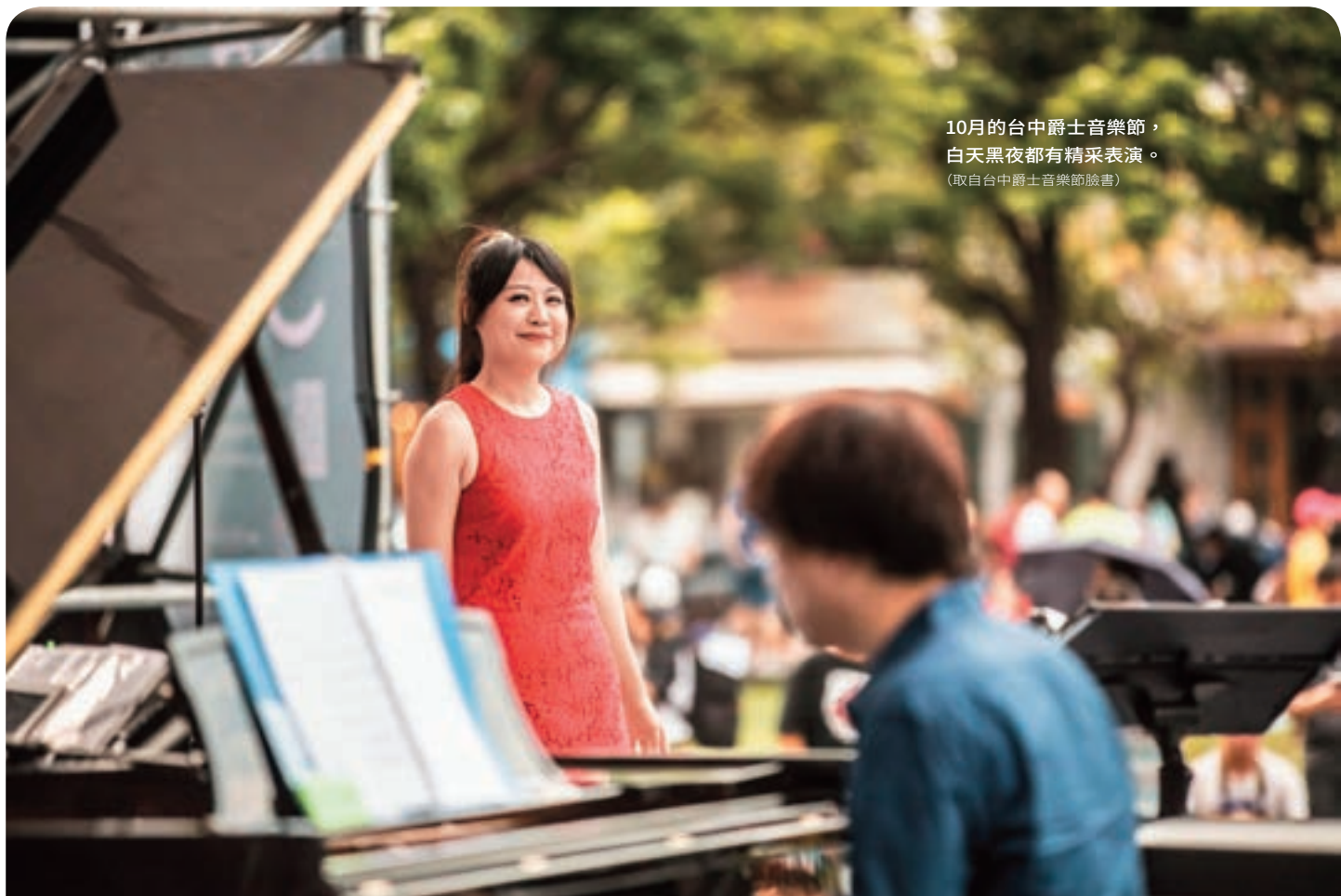
10月的台中爵士音樂節，白天黑夜都有精采表演。