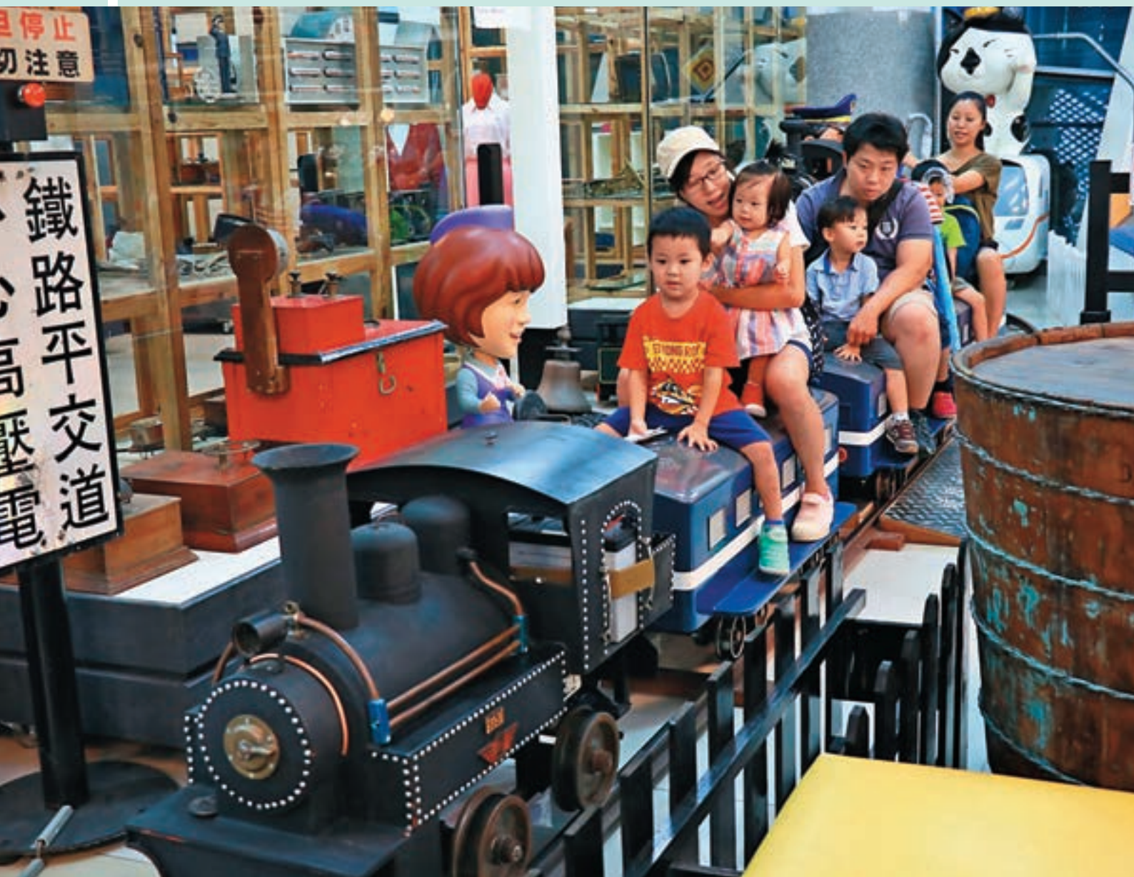
↑台灣鐵道故事館內的電動小火車，是大小朋友的最愛。