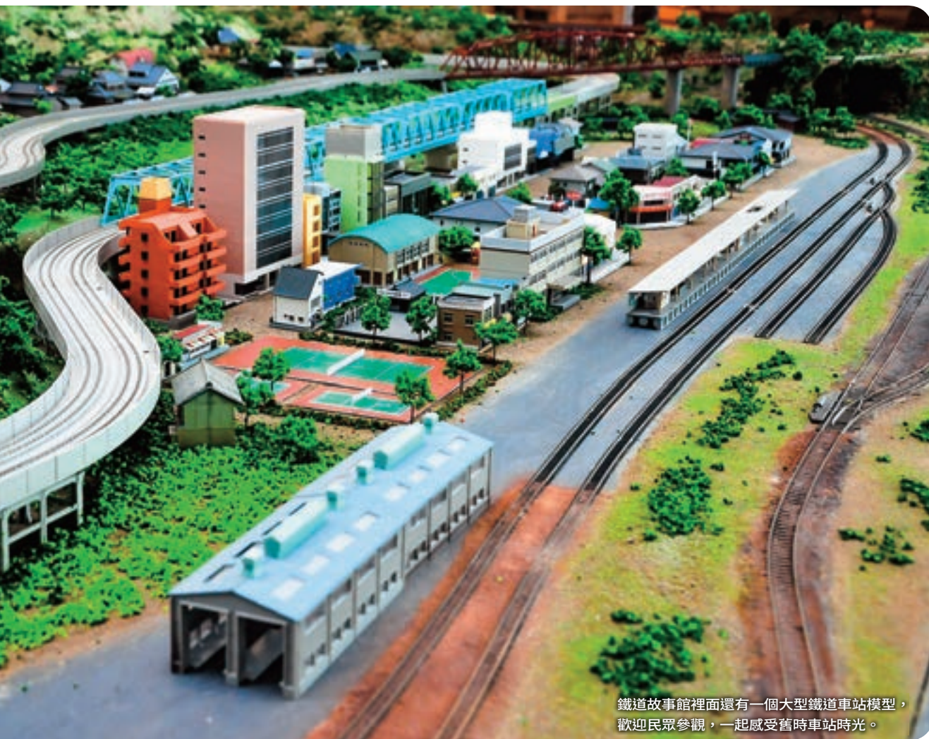
鐵道故事館裡面還有一個大型鐵道車站模型，歡迎民眾參觀，一起感受舊時車站時光。

的登山景點，富雨也與當地企業合作，開發出谷關七雄傘，現在還打算與合歡山松雪樓餐廳合作，推出可以兼做登山杖的傘，傘布就用合歡山景。