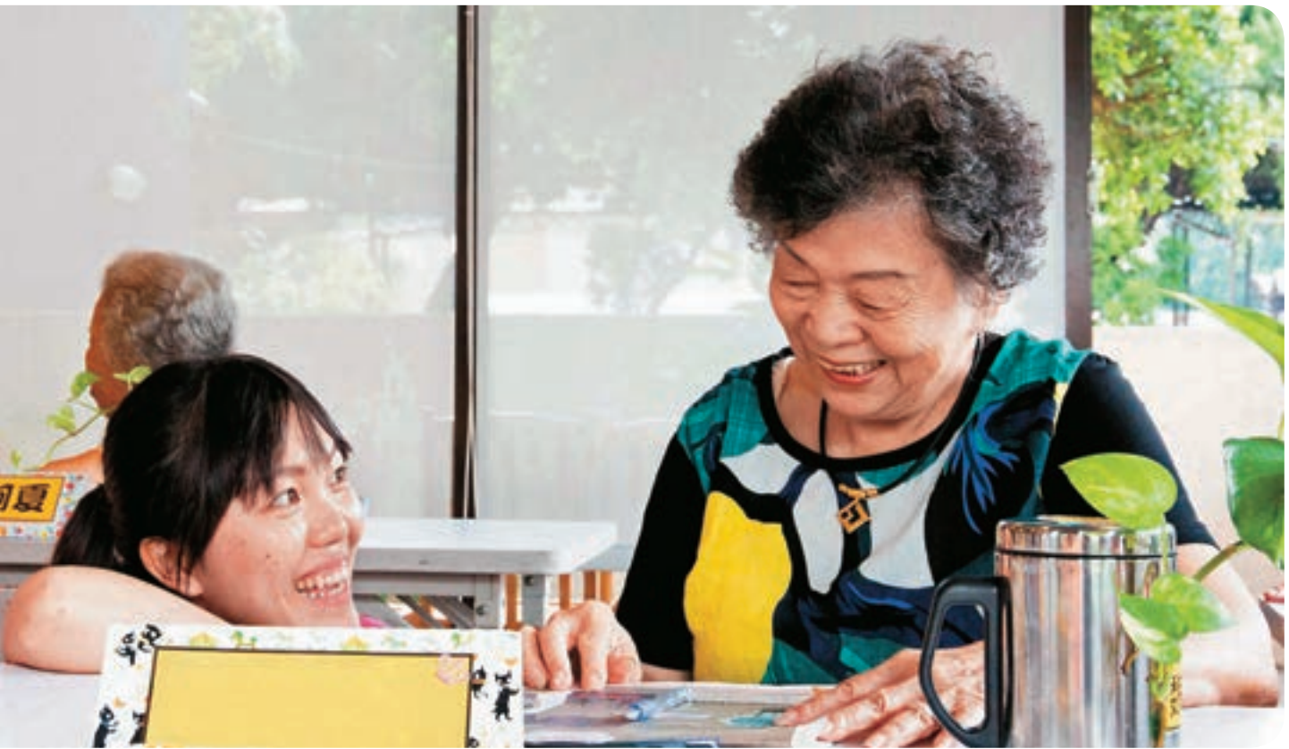
↑台中長青學堂提供長輩們與社會重新連結與互動的機會。