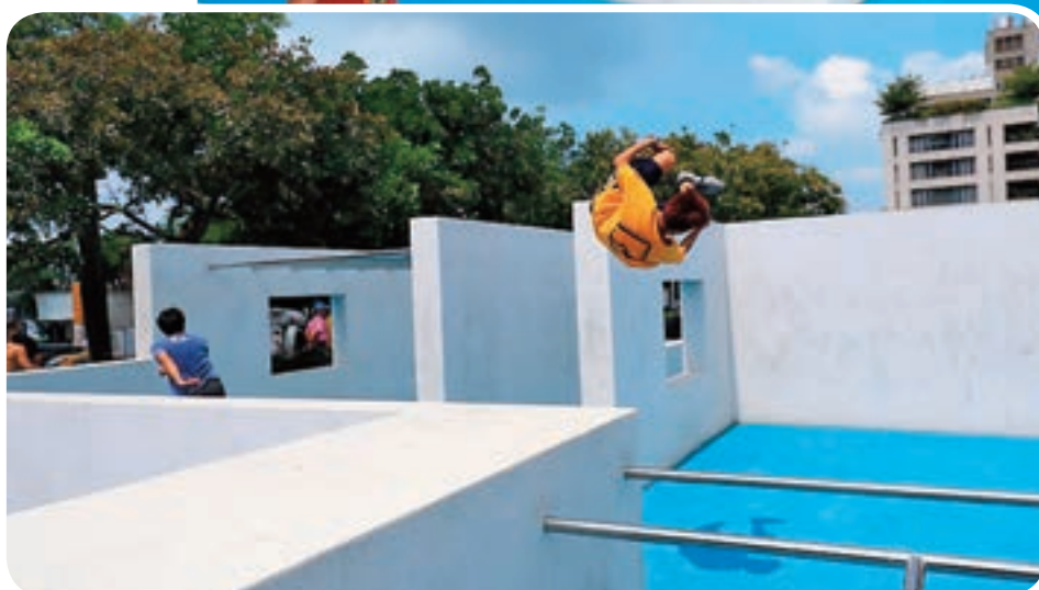
← 豐樂雕塑公園的跑酷練習場可以見到不少年輕人跑跳穿梭。

到三十人，主要是對跑酷有興趣的民眾，會相約到公園練習。去年她的跑酷推廣團隊成立，提供一系列課程，加上今年7月25日豐樂公園的跑酷練習場正式啟用，讓台中喜愛跑酷的人士增加，活躍玩家超過六十人，相關參與人士更超過二百人，目前還有國中小邀請她到學校開設講座，讓更多人認識這項活動。