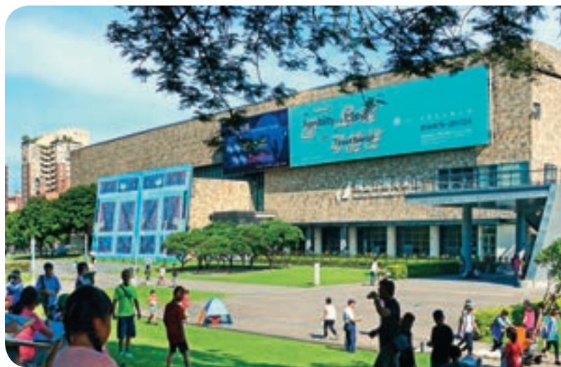
↑國美館將結合國內外四大美術館藏品推出「花之禮讚——四大美術館聯合大展」。

大樹旁、花叢間的玻璃屋中看書，聆聽花香與書香舞出新樂章，也是體驗花博的另一種方式。國立公共資訊圖書館推出結合花博精神的「花現GNP主題書展」系列活動與工作坊，除了攜手台中市各圖書館舉辦以綠色、生態、環保為主題的書展，並將於后里花博主題場館打造一間以樹為中心的透明圖書館，內部書架全採用書本造型，館方並將提供五百冊與花有關的主題書籍，讓現場宛如一座森林小學，賞花時也能同時感受書與花的力量。