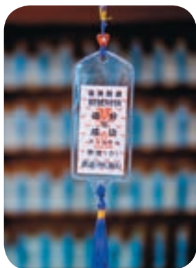
← 追分成功護身符是年輕學子間最受歡迎的紀念品之一。