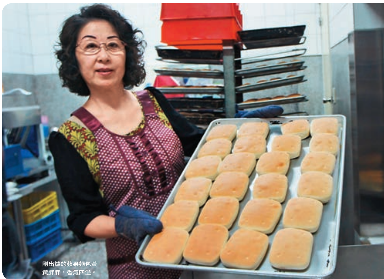
剛出爐的蘋果麵包黃黃胖胖，香氣四溢。

條販售，不只在全台掀起跟風，也因為整條土司必須裝袋販售，一條條包著透明塑膠袋的土司，也為塑膠業創造意外商機。