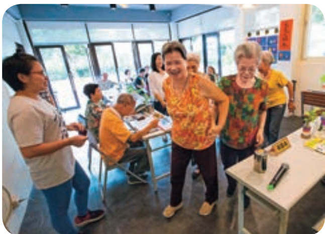
↑長青學堂裡的長輩們彼此互相照應。