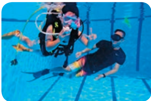
← 中心曾舉辦過潛水營隊活動。