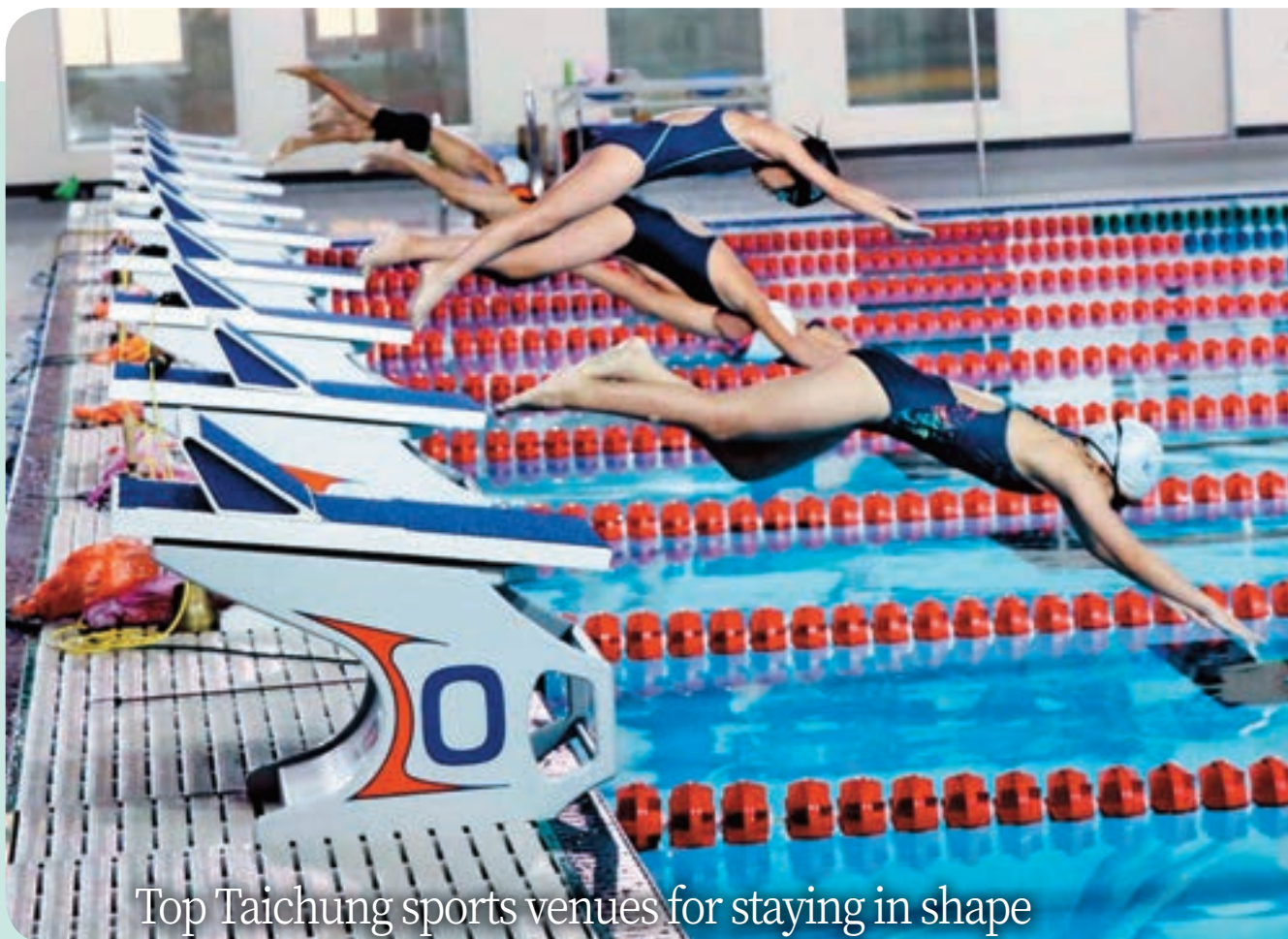
Top Taichung sports venues for staying in shape