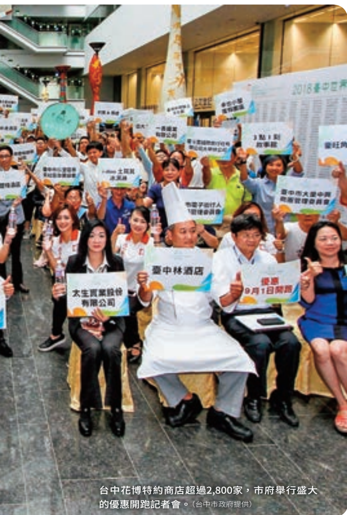
台中花博特約商店超過2,800家，市府舉行盛大的優惠開跑記者會。

台 中市民專屬的「花博卡」申請人數已突破130萬張，從9月3日起凡是台中市民攜帶身分證到各區公所申請，均可隨到隨辦並領卡；花博卡除了在展期期間享有免費一日參觀花博各個園區外，包括公有停車場停車費五折、搭乘公車10公里免費、兩千多家特約商店的優惠均已啟動！