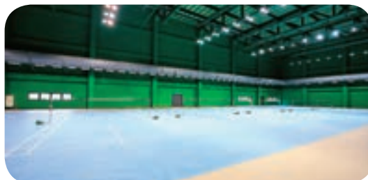
↑↓ 朝馬國民運動中心的羽球場達到奧運等級，也會舉辦相關運動賽事。