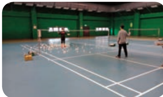
↑ Chaoma Sports Center's badminton courts meet international Olympic standards and have hosted many competitions.