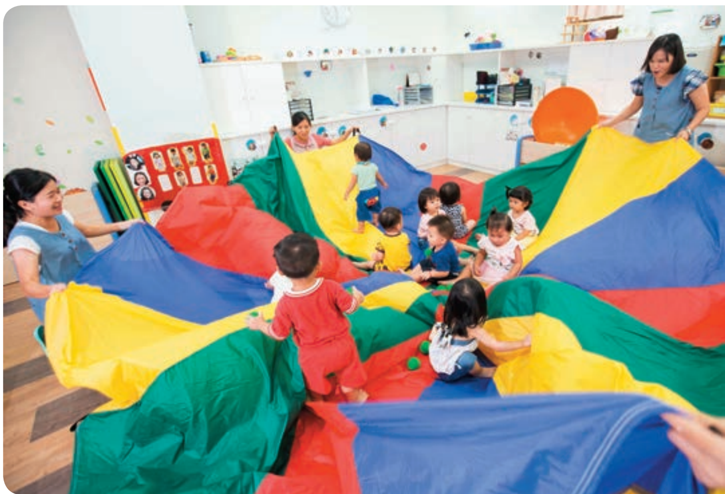
↑台中市托育福利政策完善，儼然成為全國示範。