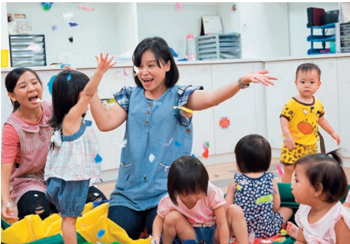
↑台中托育一條龍，讓台中新手爸媽愈來愈能安心築一個家。