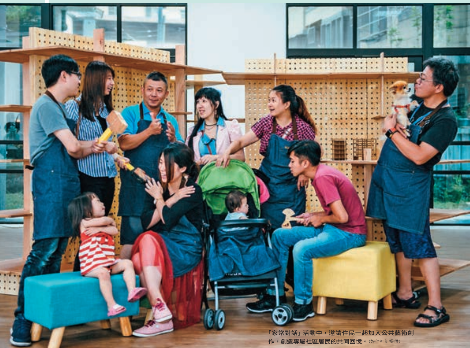
「家常對話」活動中，邀請住民一起加入公共藝術創作，創造專屬社區居民的共同回憶。