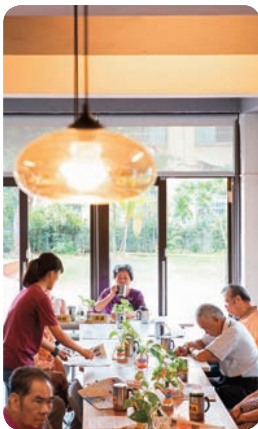
↑長青學堂空間明亮，提供長輩們學習的新環境。

另一方面，台中市人口達280萬人，躍居全台第二大都市，六十五歲以上長者約32萬人，占總人口數的12%，老化程度尚不嚴重。呂建德說，施政貴在防患未然，社會局於2015年度起推動「721托老一條龍」計畫，依台中市老年人口中，七成是健康長者，二成亞健康及輕度失能者，一成中重度失能、失智需長期照顧者的比率，分別提供關懷據點及長青學苑、多功能日間托老中心等照顧服務，維護長者身心健康，預防失能，延緩老化，進而讓失能者能維持最高獨立性功