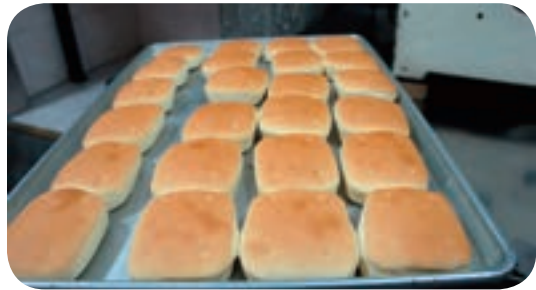
↑方方正正的蘋果麵包，樸實的外表，滋味卻令人難以忘懷。

問團指定的國際標準設廠，一邊在美軍採購人員指導下，依照他們提供的配方，從和麵、烘焙基本功學起，就這樣劉麵包廠 LIU'S BAKERY 順利於1962年誕生，開始供應駐台美軍每日所需的麵包、蛋糕和土司。