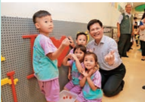
↑ 台中市長林佳龍在南屯親子館開幕時，開心地與幼兒們合影。

台 中市推動「一區一親子館」計畫，第一座南屯親子館於2017年8月開幕以來大受歡迎，至今已服務逾四萬人次；2018年再開辦太平、北區、豐原、大里等四座親子館，其他區域也將逐年設置，以一區一親子館為目標，為嬰幼兒及家長營造更優質的親子空間。