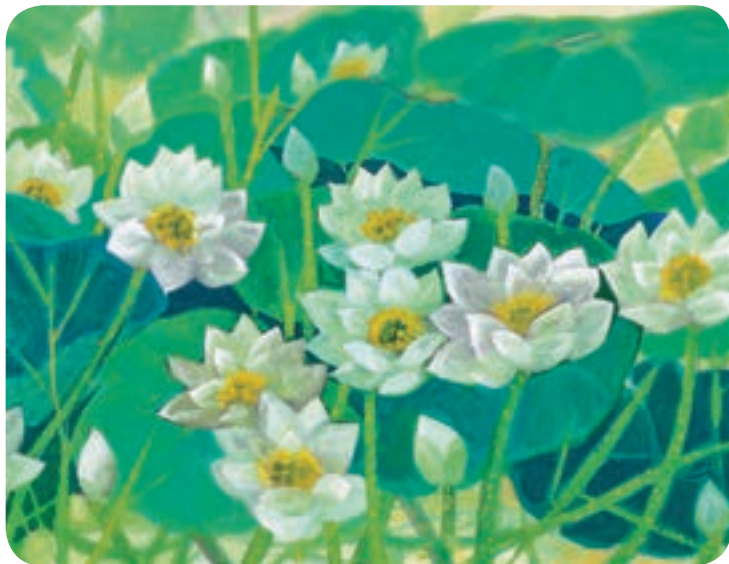
←亞大美術館將策劃「花語花博」，邀國內外知名藝術家詮釋花語。