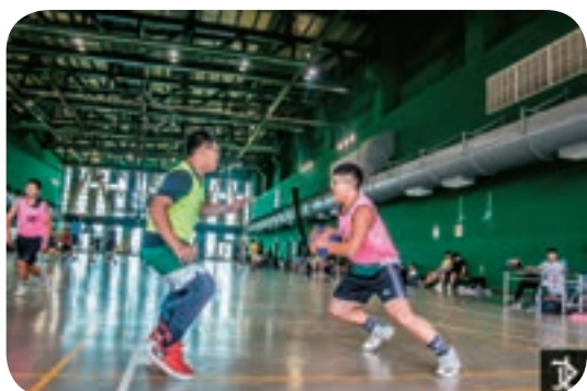
↑ Many competitions are held and all are welcome to join.

clubs and individual practice. Since opening about 20 months ago, the courts have been used by a total of 1,238,811 individuals, accounting for 10.13% of the total number of center visitors.