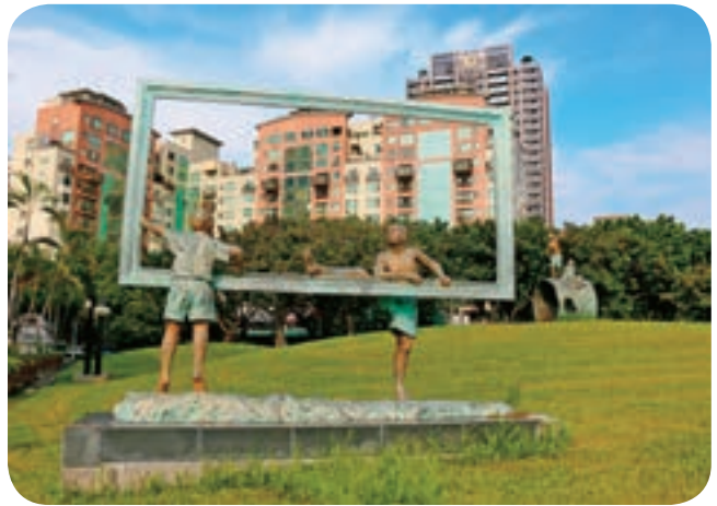
↑豐樂雕塑公園不只是台中大型主題公園之一，也是全台唯一擁有跑酷練習場的公園。

性格，也慢慢靠自己的熱情召集一群跑酷同好，這一年來開始專職擔任跑酷教練，讓更多人接觸這項運動。