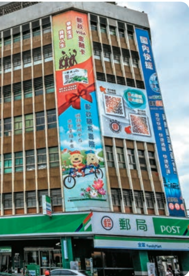
←1993年改建的臺中郵局現貌。