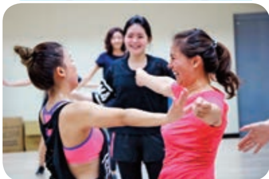
↑ 眾多室內課程是不少民眾的運動首選。