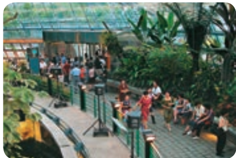
←科博館植物園收藏許多台灣原生植物，將與花博活動相輝映。