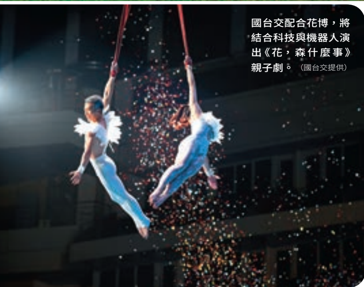
國台交配合花博，將結合科技與機器人演出《花，森什麼事》親子劇。

益更將帶來人們內在的改變，現在花博不只是市政府辦的花博、更是市民辦的花博，有兩萬名志工參與、企業界貢獻展館及文化界連結，就是花博帶來的改變。