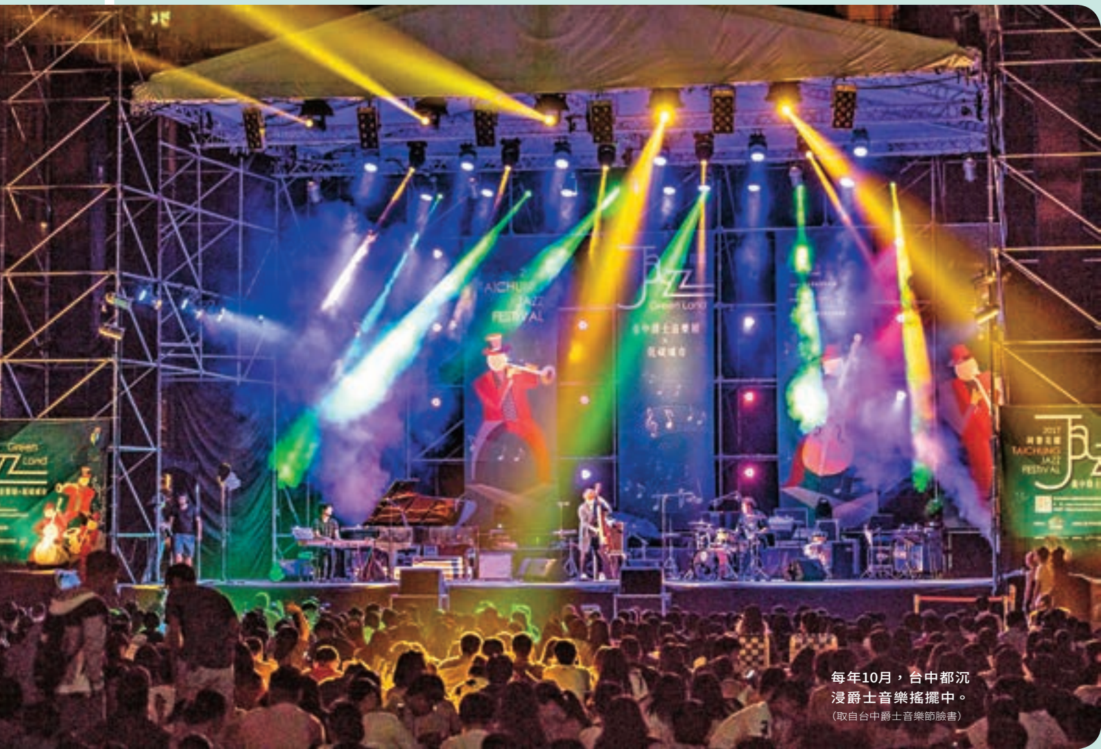
每年10月，台中都沉浸爵士音樂搖擺中。