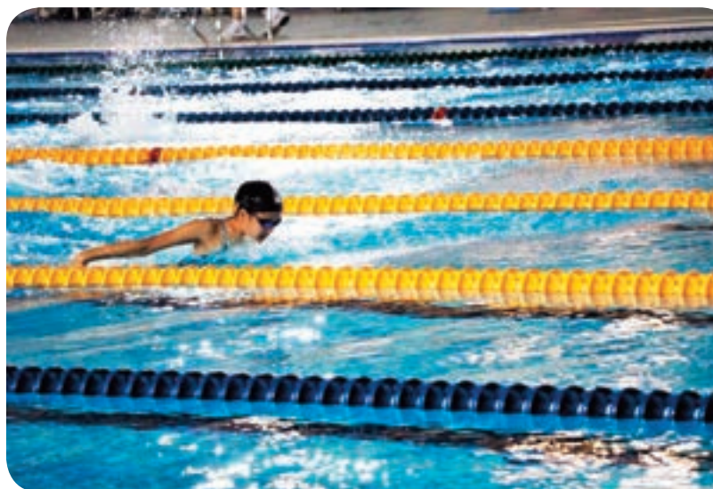
↓ 北區國民運動中心舉辦過游泳競賽。