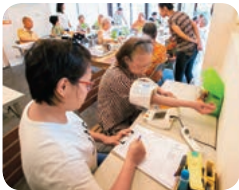
↑長青學堂裡也有提供長者基本的健康檢查服務。