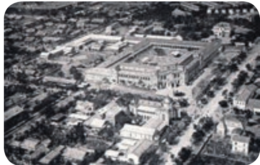
↑為了讓城市街屋都能日曬殺菌，創造衛生健康環境，當時臺中全城採偏移45度格狀市街設計。

1895年乙未戰爭爆發，日本陸軍大臣大山巖發布「軍事郵便規則」，此即為「野戰郵便」之始，次年簽定馬關條約後，日本野戰郵便先行進入澎湖，於媽宮城澎湖廳總署內設立「混成第一野戰郵便局」，起初主要是以供應戰事需求的軍事文書為主，1895年的7月1日，郵政監察使伊藤重英等人來臺，負責臺灣野戰郵便事務計畫，這就是臺灣現代郵政真正展開歷史新頁的日子，初期以傳遞軍事情報為主，日後也擴及辦理匯兌、儲金等項目，後來因島內反抗勢力日漸偃旗息鼓，軍政還歸民政，實