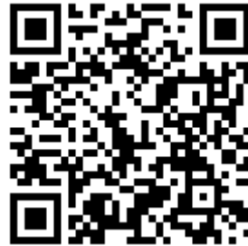
公開說明會視訊會議 QR Code

五、任何公民或團體對本案如有相關意見，得於公開展覽期間內，以書面載明姓名(單位)、聯絡地址、建議事項、變更位置、理由、地籍圖說等資料一式 3 份，向本府都市發展局提出意見，俾供本府都市計畫委員會審議之參考。