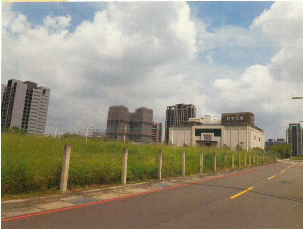
基地內興建中電子遊樂場 (君奕天地)