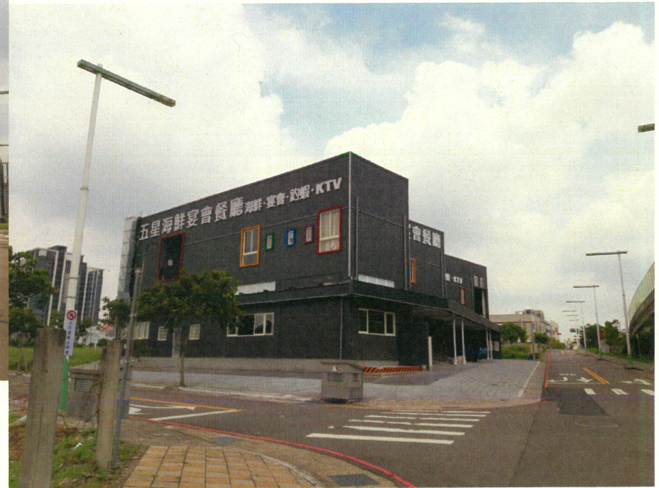
基地內興建中餐廳 (五星海鮮宴會餐廳)