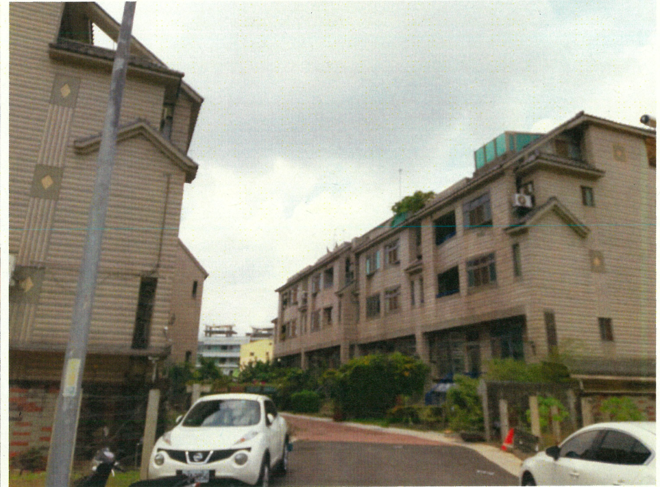
近松竹路原有社區

都市計畫發布實施前，所為之使用(如工廠)，得繼續為同一之使用(工廠)，其使用因變更或停止中斷者(如工廠歇業)，則原來之使用狀態已不復存在，即無從再得繼續為原來之使用(不可以再為工廠使用)。