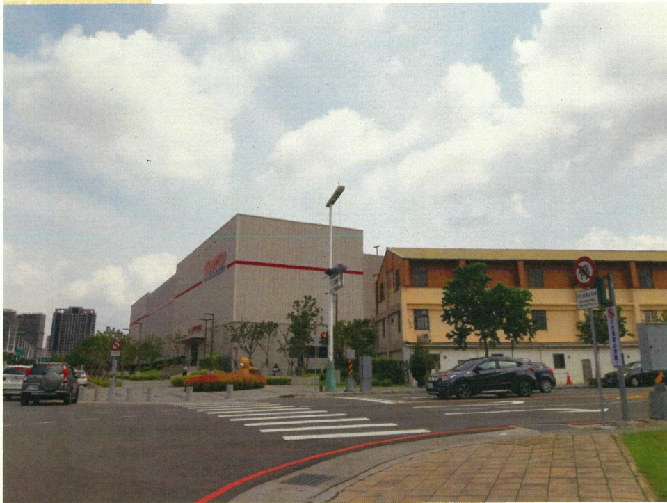
好市多及其前排原有住宅社區