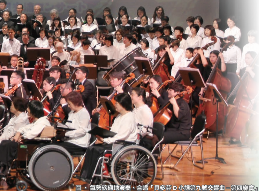
圖 · 氣勢磅礴地演奏、合唱「貝多芬D小調第九號交響曲—第四樂章」