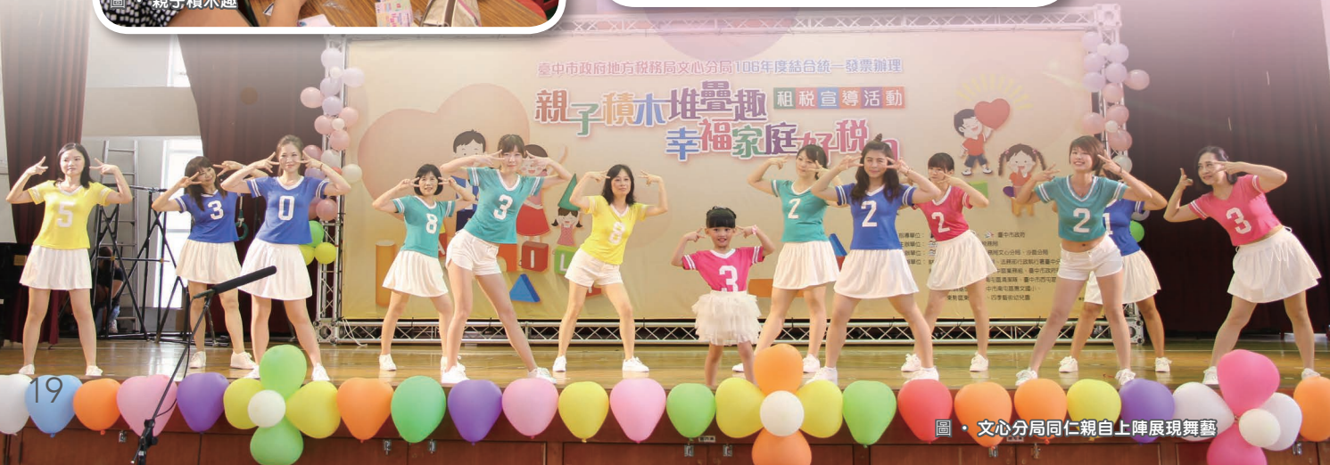
圖·文心分局同仁親自上陣展現舞藝