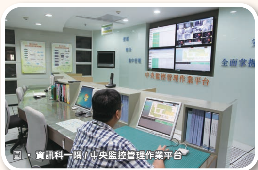
圖・資訊科一隅 / 中央監控管理作業平台