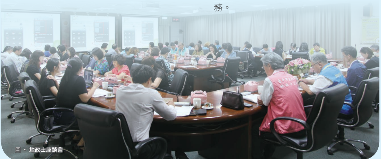
圖・地政士座談會