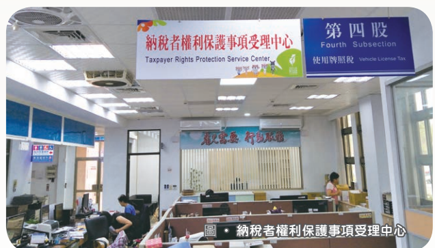
圖 • 納稅者權利保護事項受理中心

為促進納保官服務事項宣導，地方稅務局網站已設置「納稅者權利保護專區」（網址： http://www.tax.taichung.gov.tw/25106/NodeList ），供民眾上網申辦納稅者權利保護事項、查詢相關法令及疑義問答，並公告納保官之姓名、聯絡方式及工作成果，歡迎民眾善加運用，以維護自身權益。◊