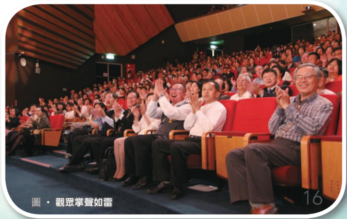
圖 · 觀眾掌聲如雷