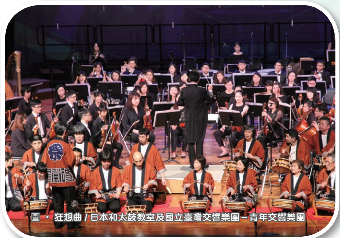
圖 · 狂想曲 / 日本和太鼓教室及國立臺灣交響樂團—青年交響樂團