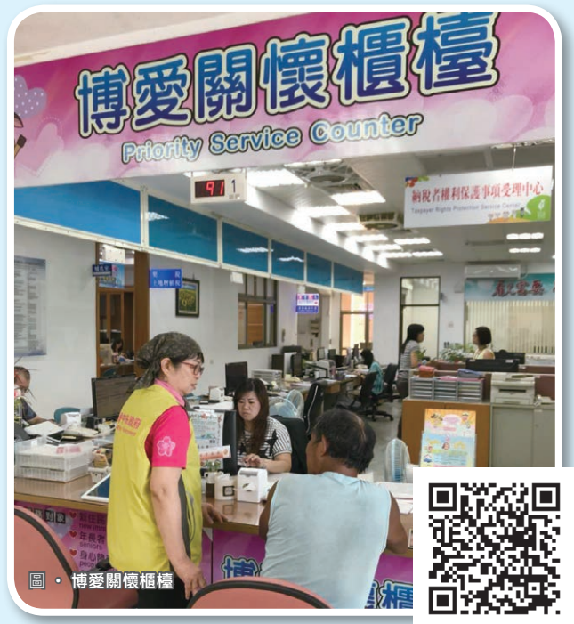
圖 • 博愛關懷櫃檯

有鑑於政府服務品質的提升，首應體認服務對象的屬性差異。地方稅務局依族群特性，發展適性服務，搭配複合策略、延伸服務據點、重視意見回饋，更考量城鄉數位落差，規劃運用網路或輔以其他管道，提供正確、優質且創新的加值服務。我們的誠意，希望能幫到你。◉