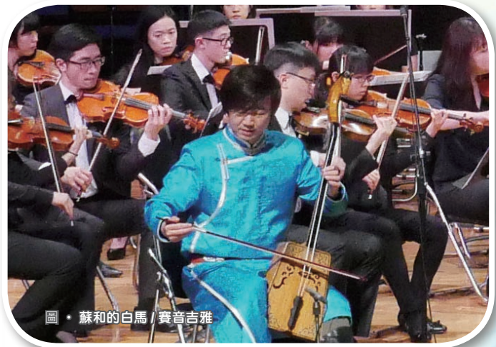
圖 · 蘇和的白馬 / 寶音吉雅