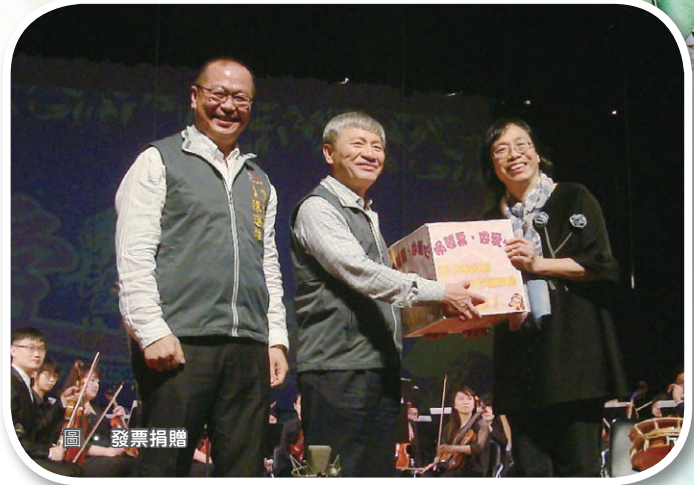
圖 · 發票捐贈

「愛 希望 快樂頌」音樂會讓身障人士在音樂上自由奔放，注入新生命，奏出臺日身障表演團體生命韌性與勇敢，讓我們聽到愛、看見希望！這次盛會雖已在熱烈掌聲中落幕，但身障表演團體的樂聲仍餘音裊裊……震撼在心。◊