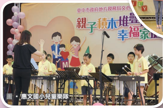
圖·惠文國小兒童樂隊