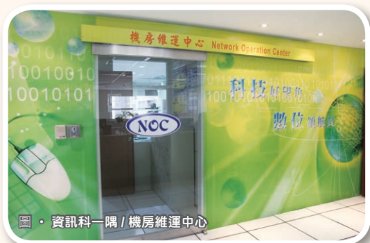
圖・資訊科一隅 / 機房維運中心

4 年前，因為工作調整，我從機器操作股調到了徵課管理股，身分也從原本的設備管理者，轉換為系統執行人。無論與冰冷的機器為伍，還是與鮮活的程式為伴，面對不同的定位，全新的挑戰，我少了初來乍到的膽怯，多了老成持重的沉穩，還有那屬於資訊人乘風破浪的雄心。在這裡，我找到了自己。◊