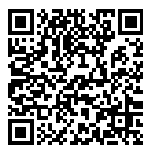
2018 臺中世界花卉博覽會－原生祕境專區