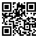
2018 臺中世界花卉博覽會官網

2018 臺中花博園區主要由后里、外埔、豐原三個主要園區組成，並分別發展生態保育、精緻農業及環境營造，呼應生產（Green）、生態（Nature）及生活（People）的「三生」精神，也就是綠色共享、自然共生及人文共好的概念。臺中市政府為了向世界推廣臺灣原住民族文化之美，特地於后里森林園區中設計規劃原住民族園區－「原生祕境」，設計核心為展現臺灣原住民族取之於山林、用之於山林，與大自然和諧共存的生活哲學以及生命之智慧，乃為族人尊敬山林、永續發展的精神。