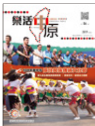
封面故事 / 108 年臺中市原住民族 傳統文化節