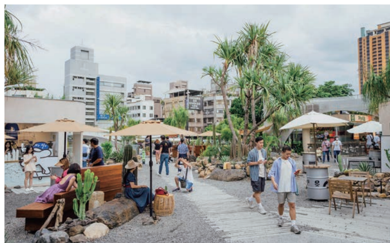
Park2草悟廣場的下沉式戶外廣場呈現超吸睛的熱帶植栽風貌，每到假日人潮絡繹不絕。

越夜越美麗的酒吧，還有甫獲《2023臺灣米其林指南》新入選餐廳的餐館，好吃又好玩，值得造訪。