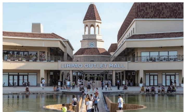
麗寶樂園歐式風格的Outlet Mall，好拍又好逛。

Outlet Mall建築走悠閒歐洲風，正中央設置的鐘樓，是最佳的打卡熱點，擁有超