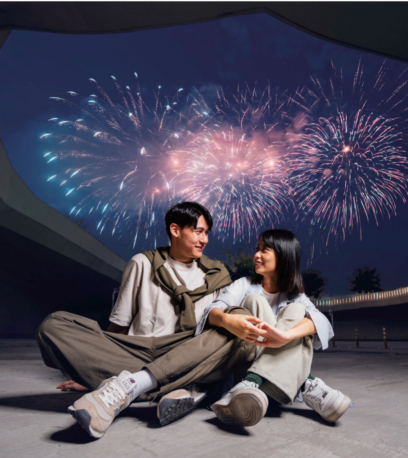
擁有各種魅力景點和美食的台中，讓人從早玩到晚！