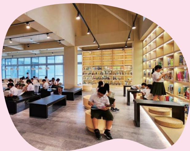
大甲國小陸續打造的圖書室和幼兒園遊具，提供孩子更有品質的學習環境。

但並不是每一座學校都能有禮堂，少了禮堂，甚至連重要的畢業典禮都要向外借場地。為此，市府追加預算為孩子們蓋禮堂，除了已完工使用及施工中的21校禮堂，今年預計再投入24億餘元、補助25所學校興建，讓孩子們可以在禮堂裡無憂地打球、頒獎、練合唱！