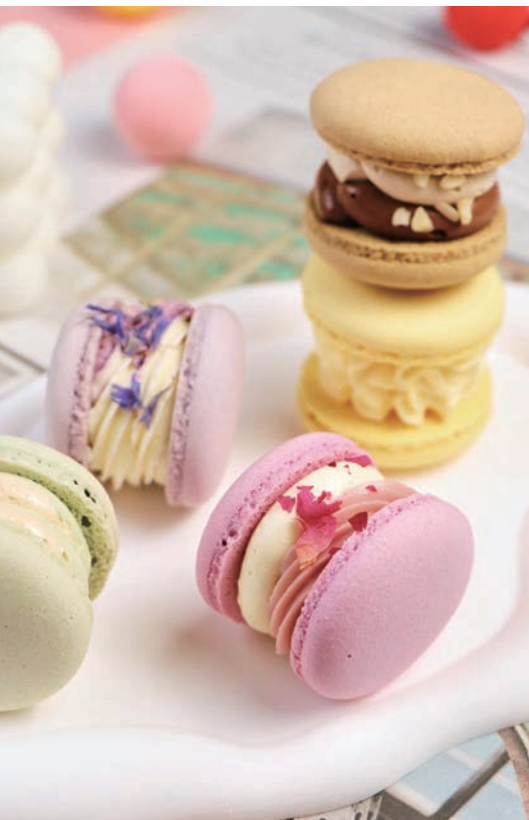
厚餡馬卡龍，繽紛多彩如同其口味一般豐富。

馬卡龍則融合法式甜點與韓式裱花技巧，呈現出華麗風格的「韓式裱花馬卡龍」，韓式裱花馬卡龍外觀厚實、內餡豐盈，搭配玫瑰口味奶油霜及金箔點綴，外層的裱花則採用手工一片片擠出花瓣，而非常見的花嘴，更增添了藝術感。不僅如此，「時境甜點」還推出了「厚餡馬卡龍」系列，其外殼酥軟多彩，內餡極為厚實，且口味多樣，如荔枝覆盆子、藍莓白巧、哈密瓜優格等，廣受歡迎。