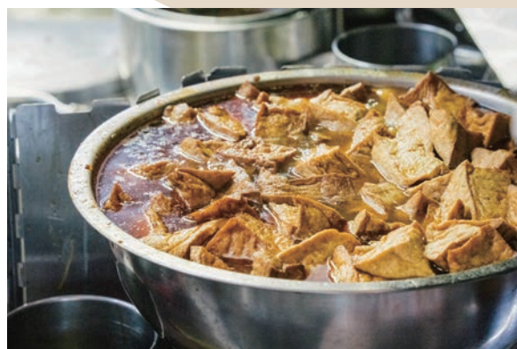
網友們口耳相傳的阿隆麵攤是秒殺級的平價美食。