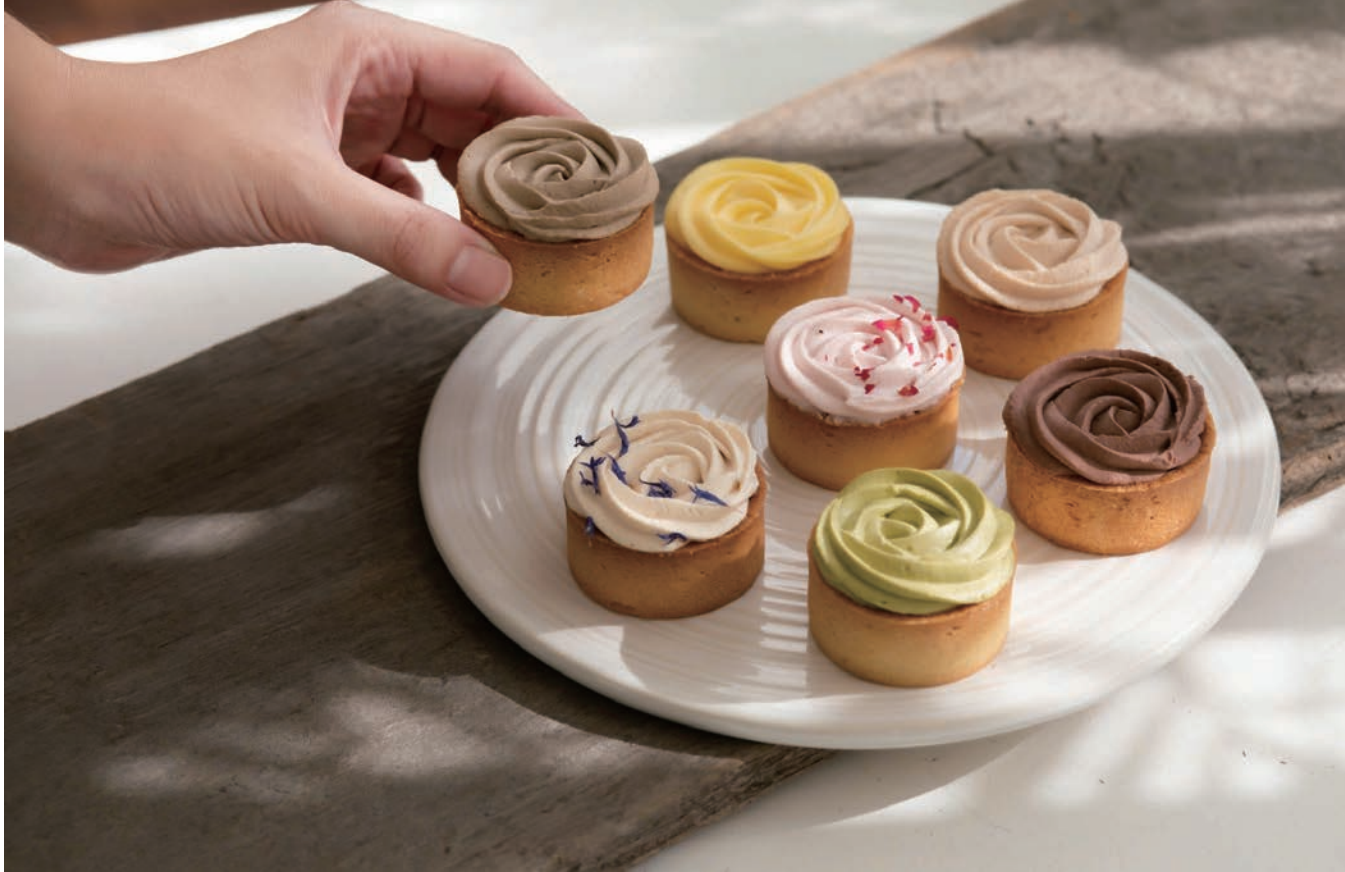
時境甜點的各式玫瑰花造型塔類，光用看都療癒，以酸甜清爽的玫瑰檸檬塔最經典。