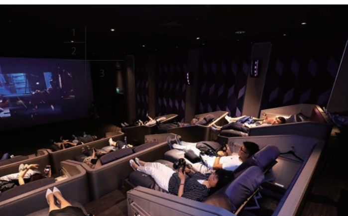
秀泰影城文心店全台唯一的「丹普廳」，讓民眾可以躺著看電影。

台中購物商場魅力十足，是不是每間都超想逛逛看？趁連假來台中玩樂消費，上網登錄發票參加第5屆台中購物節活動，就能享有「天天抽、週週抽、月月抽」等好禮，說不定你就是下個幸運兒！