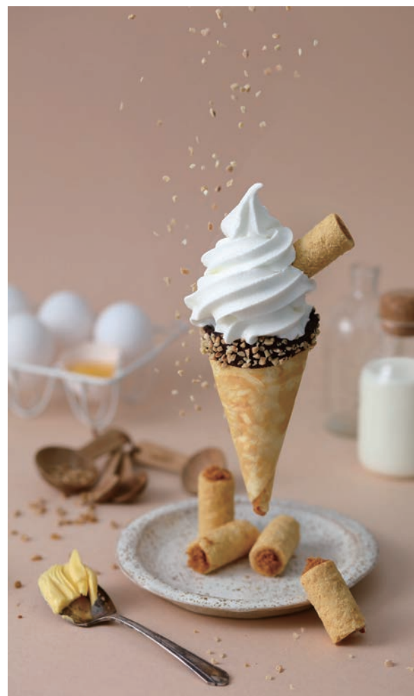
除了各式禮盒，青鳥旅行在台中國美館對面的城市概念店，還有限定「蛋捲霜淇淋」可品嚐。

「青鳥旅行」在台中除了於車站和百貨公司擁有櫃位外，在國美館對面也成立城市概念店，可以品嚐到限定甜品「蛋捲霜淇淋」，這款甜筒冰品結合了蛋捲的酥脆和霜淇淋的滑順口感，令人驚艷。