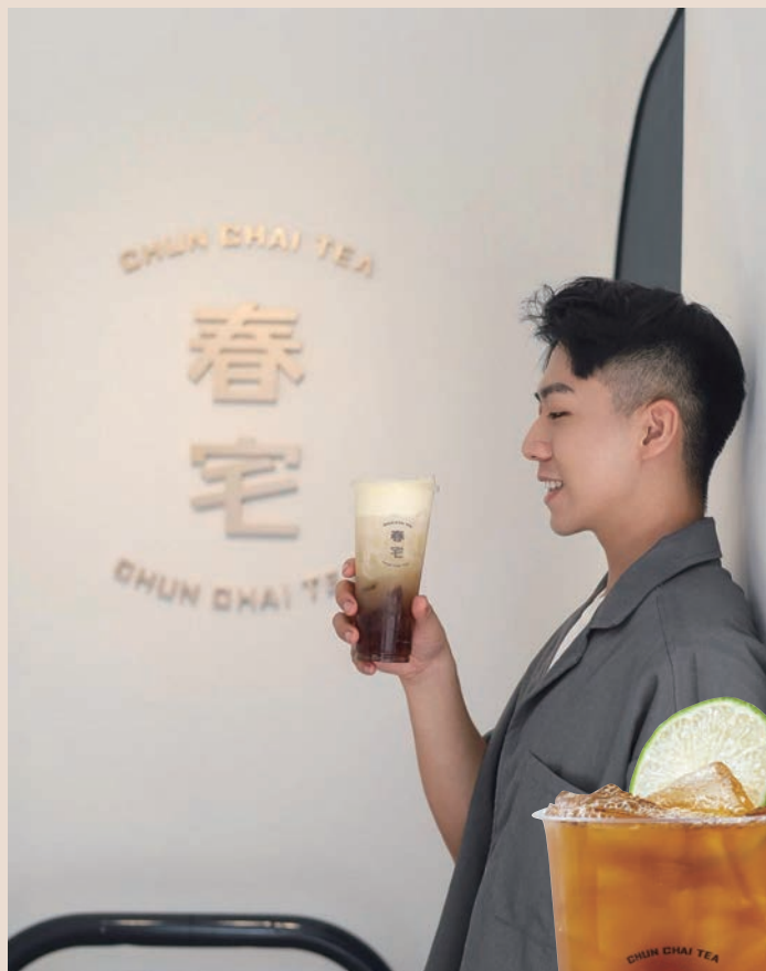
春宅「堤亞青檸」有濃厚的烏龍茶香，又交織著檸檬和桂花香氣。