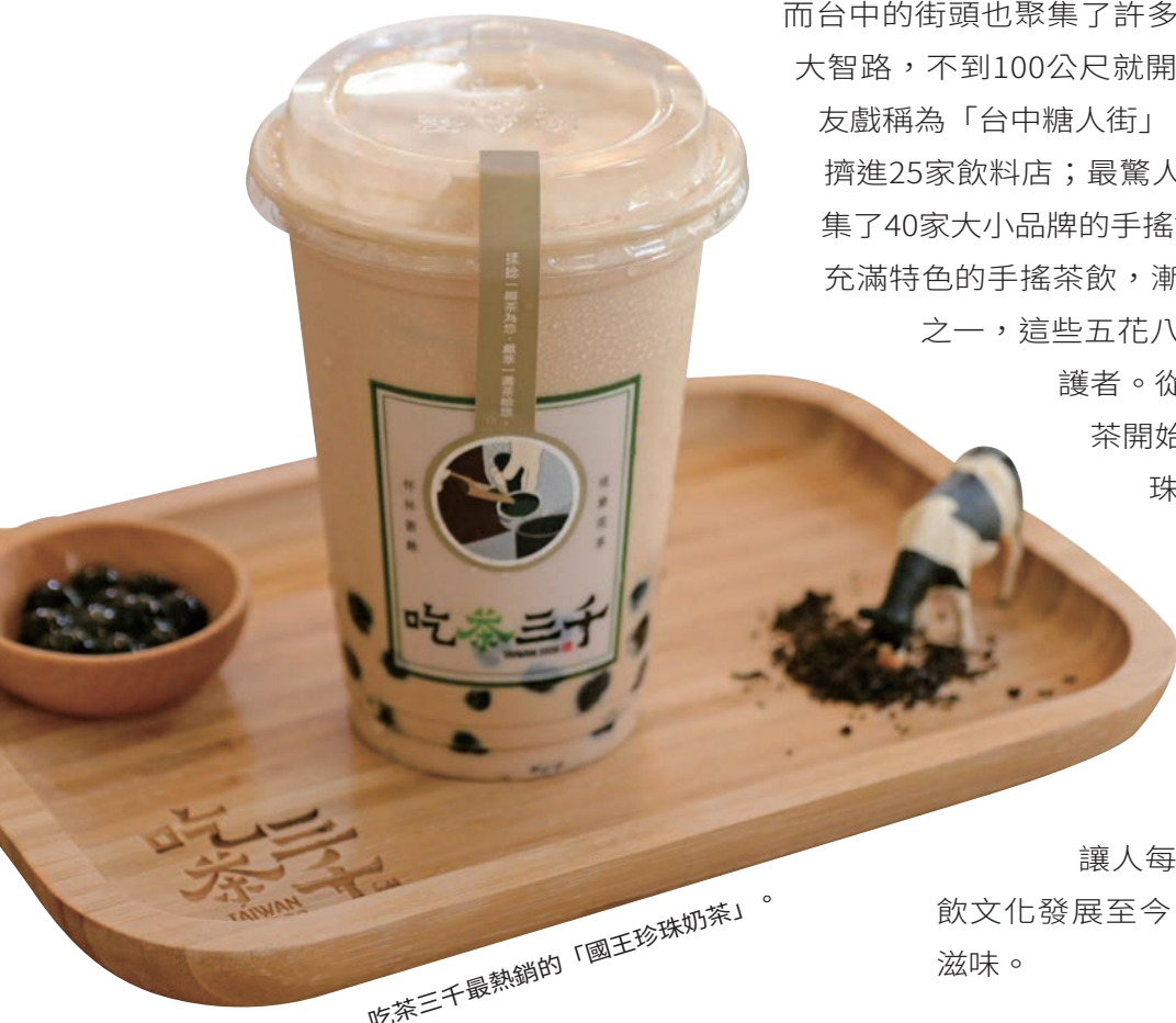
吃茶三千最熱銷的「國王珍珠奶茶」。