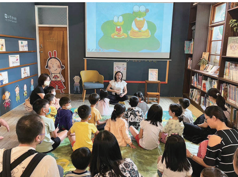
海灣繪本館內常舉辦說故事活動，帶領孩子們進入奇幻世界。