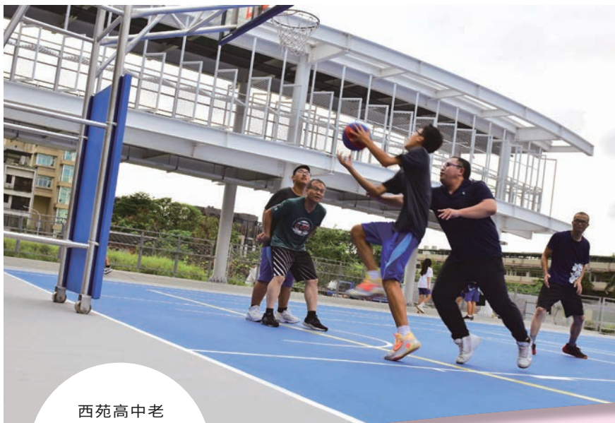
西苑高中老舊校舍改建的最大亮點，就是結合綠地的建築以及寬闊的籃球場。