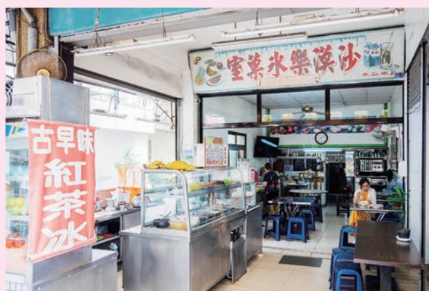
古早味的冰菓室裝潢，加上繽紛的剉冰配料，讓人彷彿一秒回到童年時代。