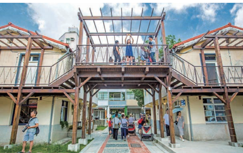
審計新村的眷村老屋和文青市集，總是吸引不少遊客前來。