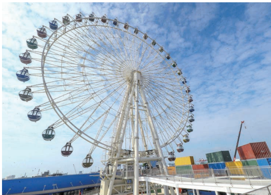
MITSUI OUTLET PARK 台中港融入碼頭和貨櫃元素，是全台唯一海港型Outlet。

過200間精品、時尚、運動、休閒、親子品牌商店及異國美食街，滿足購物與用餐需求。建議搭乘全台最大摩天輪「天空之眼」，從384公尺的高空中向下俯瞰，白天將園區美景盡收眼底，夜晚則能欣賞絢麗夜景，浪漫又迷人。