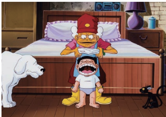
經典重現1998年台灣本土動畫長片《魔法阿媽》（4K數位修復版），將勾起許多大小朋友的回憶。

值得期待的是，本屆觀摩長片選映台灣經典動畫《魔法阿媽》（4K數位修復版）。故事講述農曆7月間，主角豆豆到阿