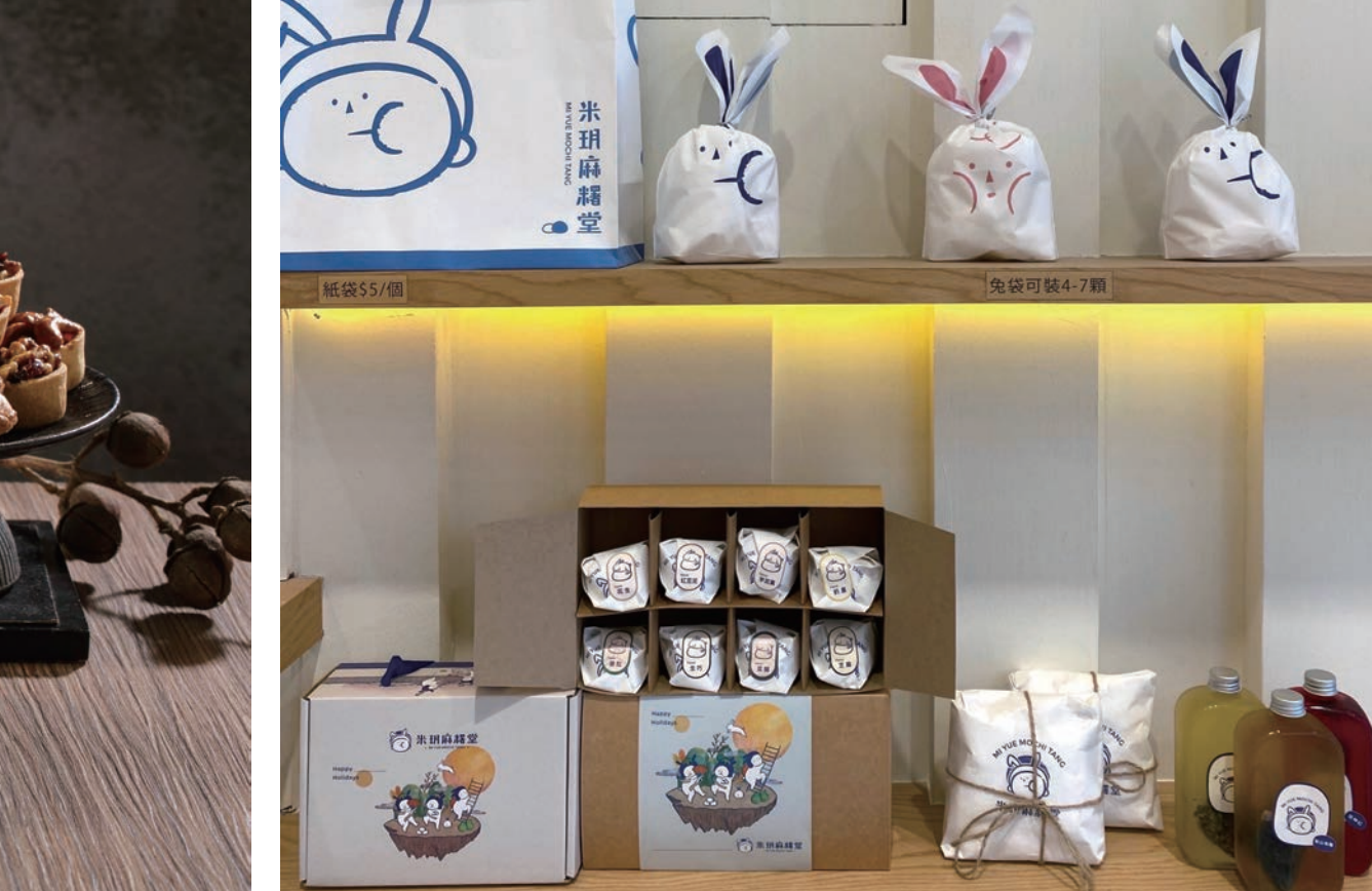
米玥麻糬可愛的兔袋和中藥袋包裝，吸引不少顧客拍照打卡。