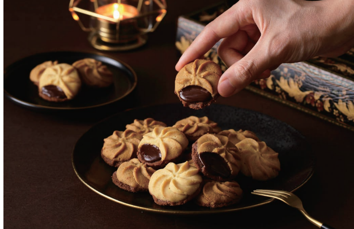
鴻鼎菓子最新推出的「專利包心嗶啵曲奇」，在雙層曲奇餅內包入黑巧克力，入口更具層次感。