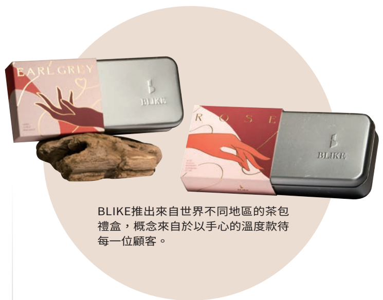
BLIKE推出來自世界不同地區的茶包禮盒，概念來自於以手心的溫度款待每一位顧客。

招牌「旨拿鐵」，紅茶來自斯里蘭卡的烏瓦產區，茶湯有濃烈的香草氣息和柑橘香味，加入台灣的義美鮮奶，口感高雅細緻、明亮輕盈，奶味鮮明。另一款「儂拿鐵」，則選自斯里蘭卡的坎蒂產區，茶湯口感溫潤，尾韻還有可可、堅果香氣，搭配絲滑牛奶，味道渾厚飽滿，更顯茶味。