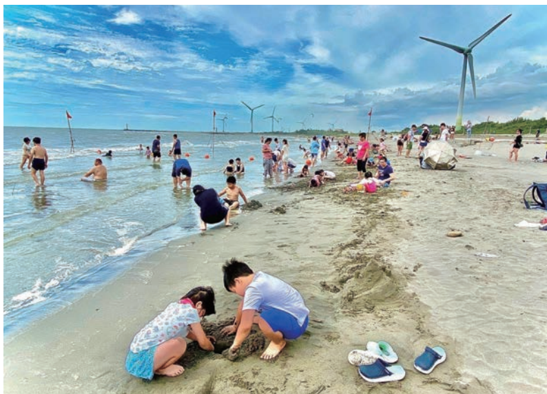
在大安濱海樂園可沙灘戲水、坐看海景、聽海濤。

「國軍老舊眷村文化保存區」之一，至今仍保留部分原建築。眷村內狹長的巷弄與緊鄰的屋舍，可以想像早期居民往來密切的熱鬧情景。低矮的房舍配上木窗框、花磁磚，以及內部懷舊的傢俱、擺設，皆散發復古風情，是旅客喜愛的打卡景點。