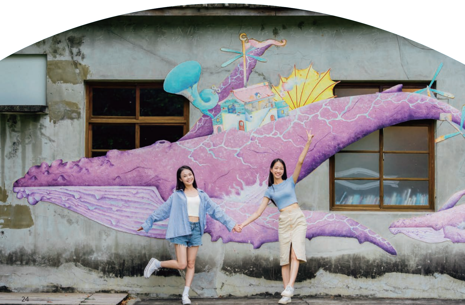
下：從清水眷村文化園區往海灣繪本館走，就能看見館外牆面的大翅鯨的繽紛彩繪。