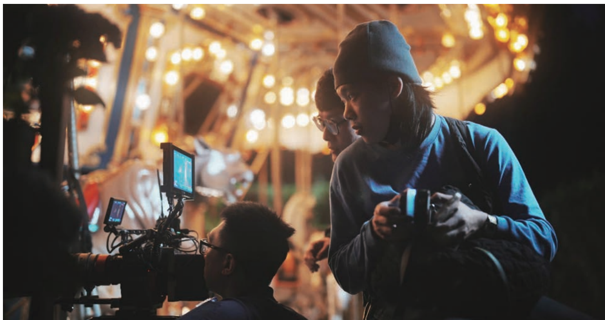
台中市影視發展基金會，負責提供專業的場景諮詢、協助場勘與場地申請等服務，讓劇組順利完成拍攝。