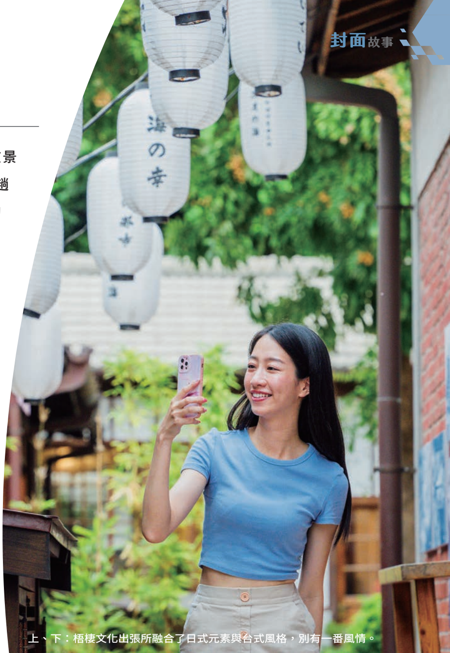
上、下：梧棲文化出張所融合了日式元素與台式風格，別有一番風情。

這裡可以租借日本浴衣拍照，旅客穿著亮麗繽紛的浴衣，拿起涼扇漫步在木造建築中，把心願寫在祈福繪馬上，或在日式庭園中悠閒餵錦鯉，拍出一張張和風美照，是非常受歡迎的人氣行程。此外，梧棲文化出張所還是全台首間古蹟民宿，旅人可以選擇入住所長的家、副所長的家、巡佐的家等，在典雅空間內細細品味懷舊氛圍。