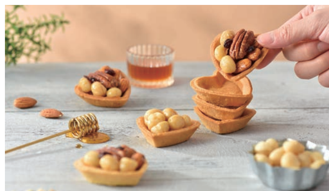
1 | 2-2：鴻鼎菓子以愛心堅果塔和各種口味的曲奇餅進攻伴手禮市場。