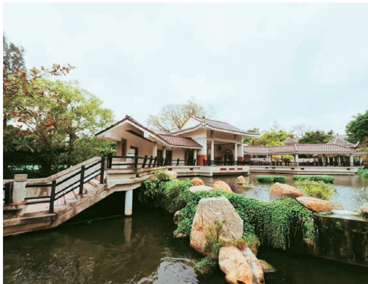
上：港區藝術中心的建築為閩南風格，小橋流水的院落景致宜人。

隔著一條馬路，與港區藝術中心相望的是清水眷村文化園區，前身是空軍眷舍信義新村，也是國防部核定全國13處