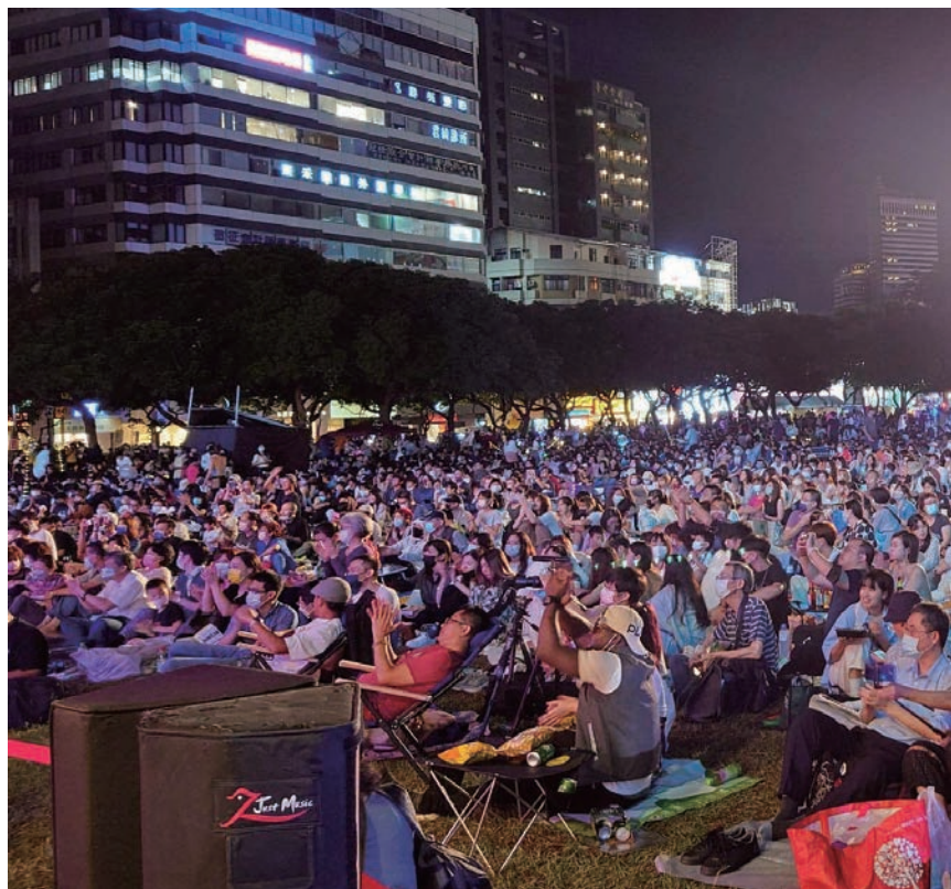
台中爵士音樂節，每年都吸引滿滿民眾共襄盛舉。

鄰近的市民廣場綠地寬廣，是市民熱愛的遊憩場域，也是遊客必訪的觀光熱點，不分平假日都人潮滿滿，每年10月會舉辦「爵士音樂節」，邀請國際大師、在地樂手，還有青少年樂團輪番演出爵士樂曲，吸引海內外觀光客共襄盛舉，在微涼的秋日裡，聆聽優美抒情的