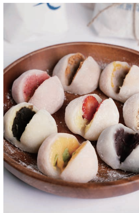
米玥麻糬的口味多，各種創意混搭令人驚喜。

不只麻糬口味多又好吃，「米玥」的品牌形象米玥兔，原型參考古籍中的月兔搗藥，店內風格充滿中藥行意象，再搭配可愛的兔袋和中藥袋包裝，更是吸引人前來打卡拍照，順道帶份伴手禮回家。