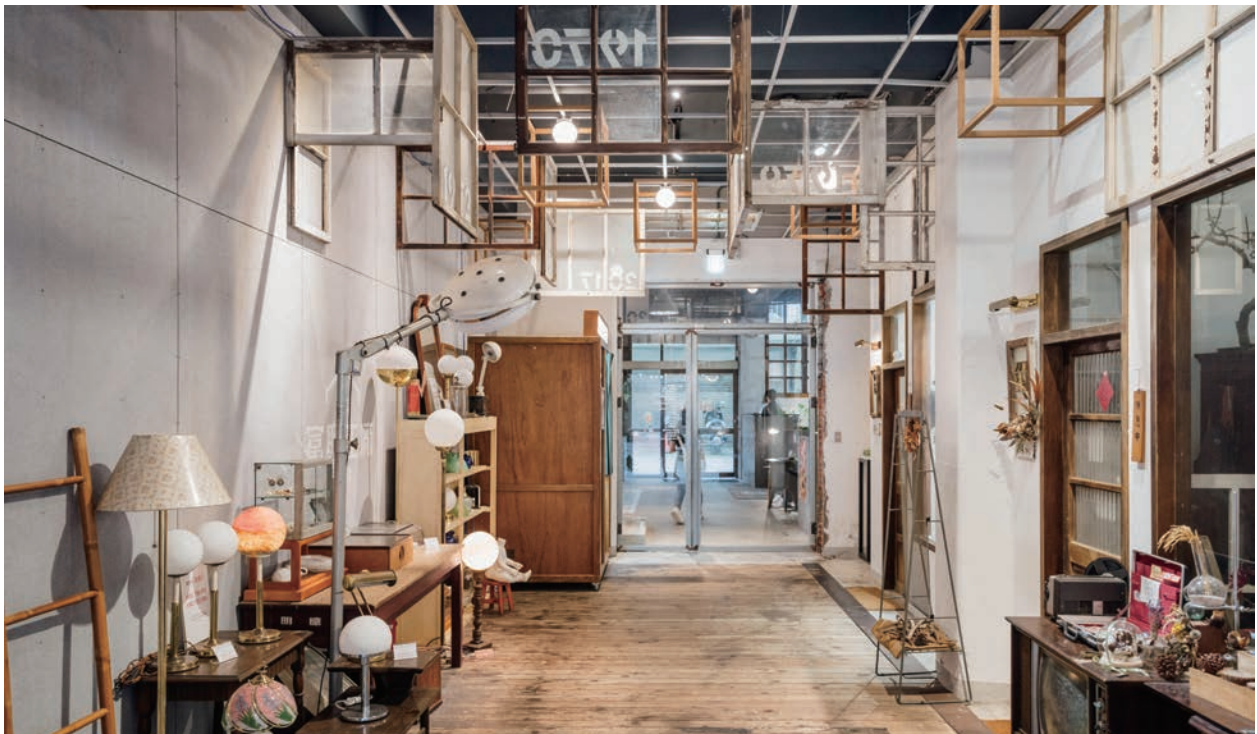
富興工廠的歷史超過一甲子，建築散發懷舊之美。

進駐富興工廠的店家類型多元，在這裡可以試穿復古風服飾、把玩趣味造型公仔，還能聆聽類比音樂的懷舊美聲，若想放鬆小憩，也有風格咖啡廳、