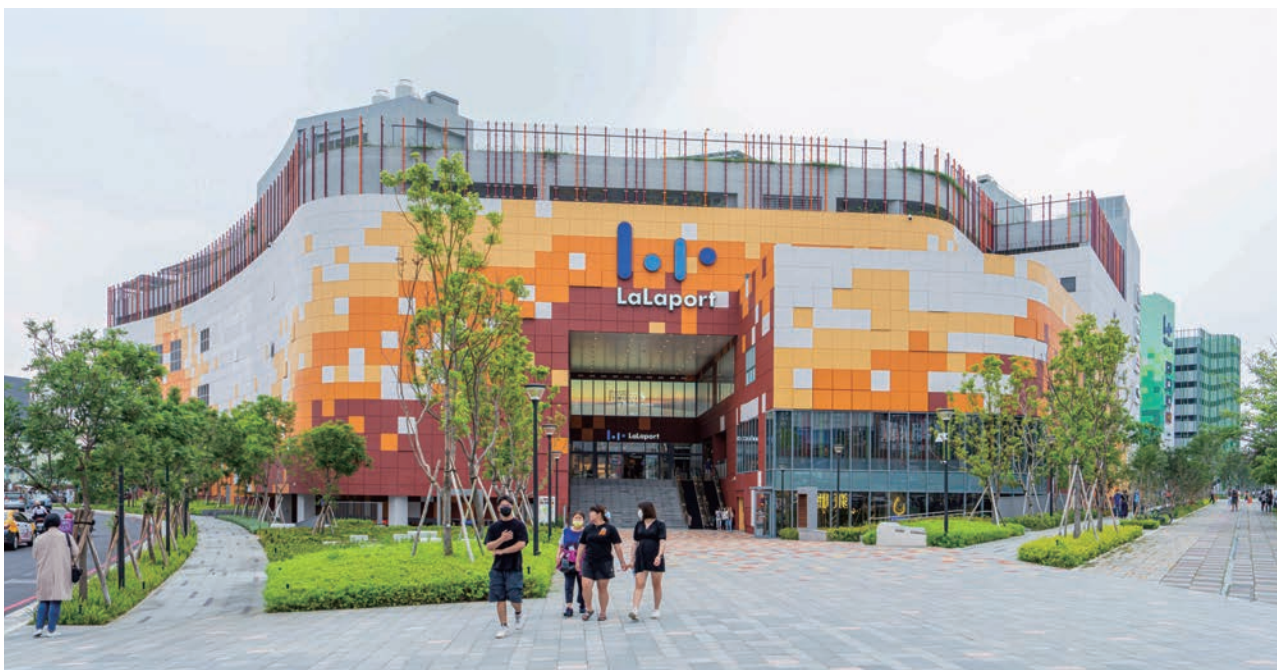
三井LaLaport主打日系風格，商場內超多日系品牌可買可逛。