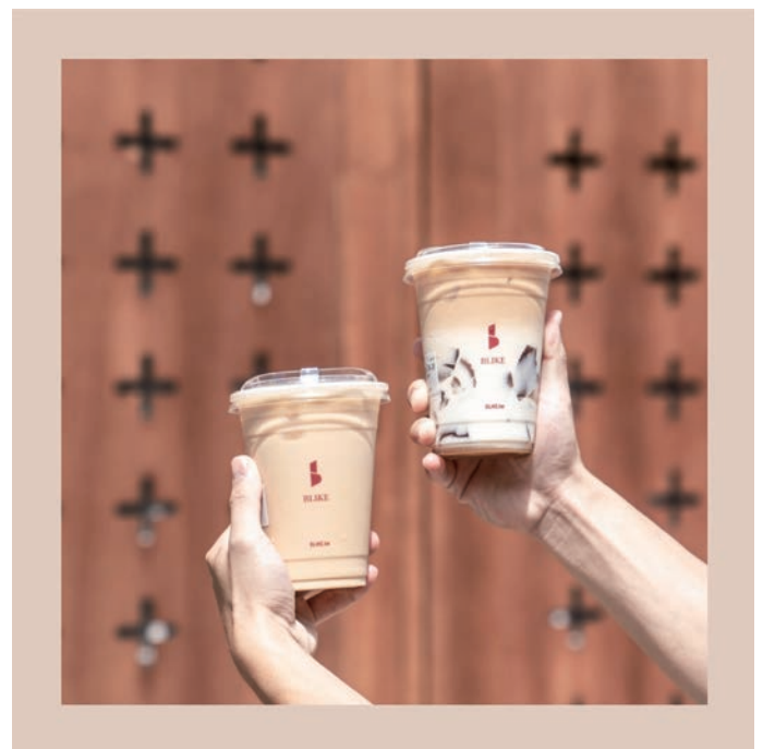
主打精品奶茶系列飲品的BLIKE，提供細膩的風味與體驗。