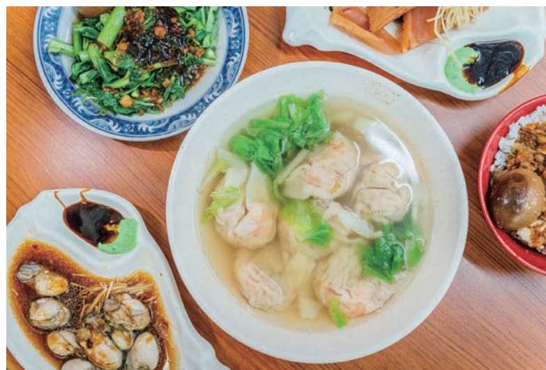
江家餛飩的招牌鮮蝦餛飩，每顆餛飩包著一整隻蝦，光看就超滿足。