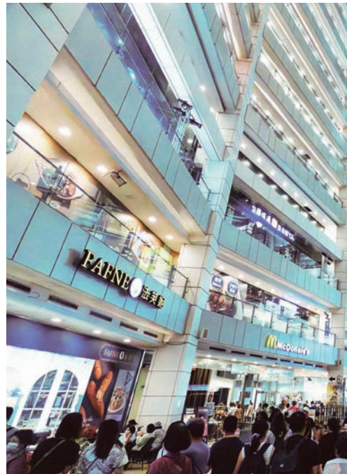
主打運動休閒風格的大魯閣新時代購物中心，廣受年輕及親子族群喜愛，尤其是美式復古的滑輪場。

畫影展」，台灣製作的動畫長片《妖怪森林》會在此舉辦世界首映，還有主題論壇與映後座談，與影迷交流互動，來自法國、日本等國的動畫強片也陸續登場，內容精彩可期。