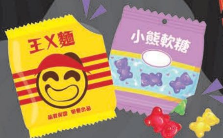
市售改裝有拆封痕跡