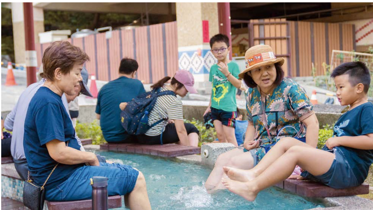
谷關溫泉公園環境清幽宜人，還有免費的足湯，是不少遊客喜愛造訪的景點。

想要感受谷關的老字號溫泉，可以選擇谷關第一家民營的溫泉旅館「谷關溫泉飯店」，恬靜優雅的氛圍，深受許多年長遊客的愛戴。喜歡熱帶南洋風格的遊客，可以選擇「惠來谷關溫泉飯店」，白牆木瓦搭配熱帶林木，呈現出浪漫放鬆的氣氛。若想體驗日式溫泉，可以考慮由日本星野集團經營的「虹夕諾雅谷關溫泉渡假村」，除了客房內皆有半露天溫泉池，還可在飄著淡淡檜木香的浴場，體驗男女分開的露天裸湯，泡湯之餘結合美食與四季美景，為每一位遠道而來的遊客，帶來一場由溫泉與美食所編織的美好回憶。🌊