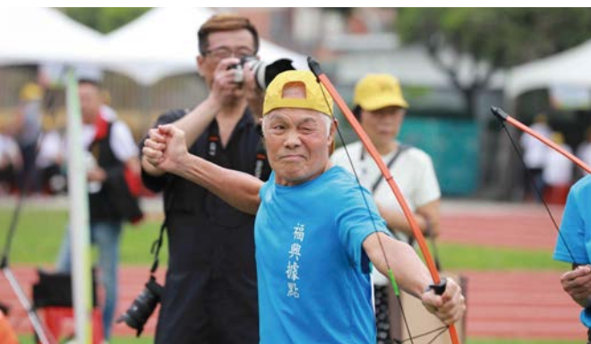
台中社區照顧關懷據點舉辦全明星運動會，展現活躍的銀髮力量。

根據統計，截至2023年10月底台中市高齡人口已超過44萬人，對此市府積極建構全齡友善的宜居環境，陪伴資深市民快樂慢老。