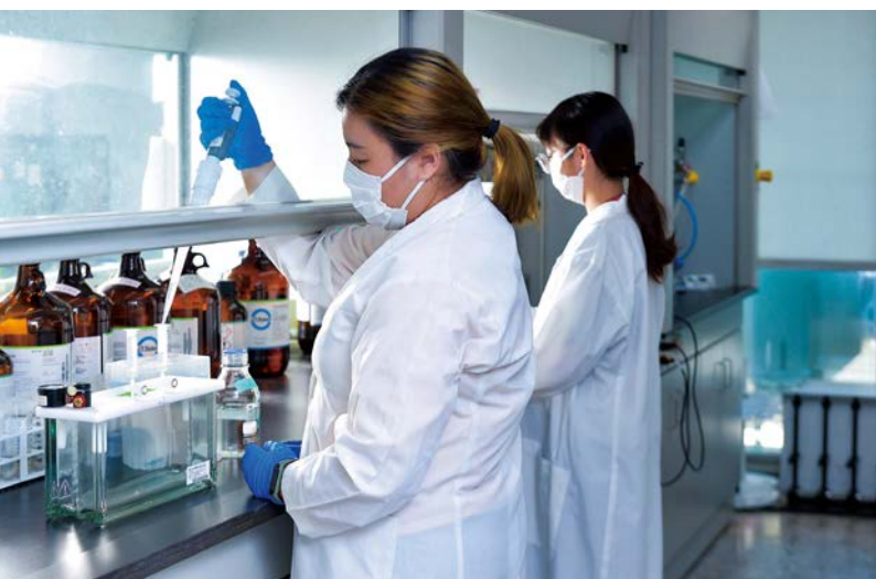
1-2：台中市食品藥物安全處實驗室不斷提升檢驗儀器設備，檢驗數量居全國之冠。