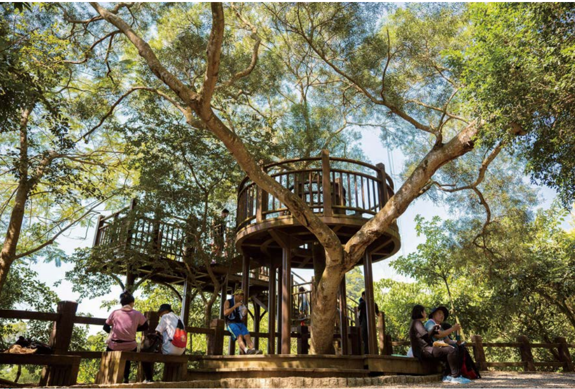
大坑風景區步道群沿途的觀景台，可供遊客休憩、遠眺美景。