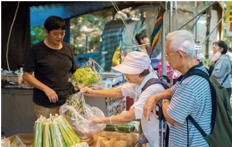
大坑農夫市集位於9、9-1、10步道終點，健行兼採買剛剛好！

其中，9號步道長約1.6公里，沿途充滿綠蔭，登上至高點可遠眺十一期重劃區繁華的都市景觀；10號步道則為「特產步道」，設有擬人化的柑橘、文旦、文心蘭與麻竹筍吉祥物，展現在地四大農特產。步道出口規劃農產市集，讓在地小農販售自家栽種的