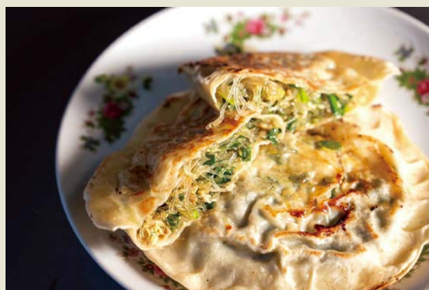
傅記上海菜每天製作販售不同菜色，其中巨無霸韭菜盒的滿滿內餡搭配酥脆餅皮，層次豐富讓人一口接一口。