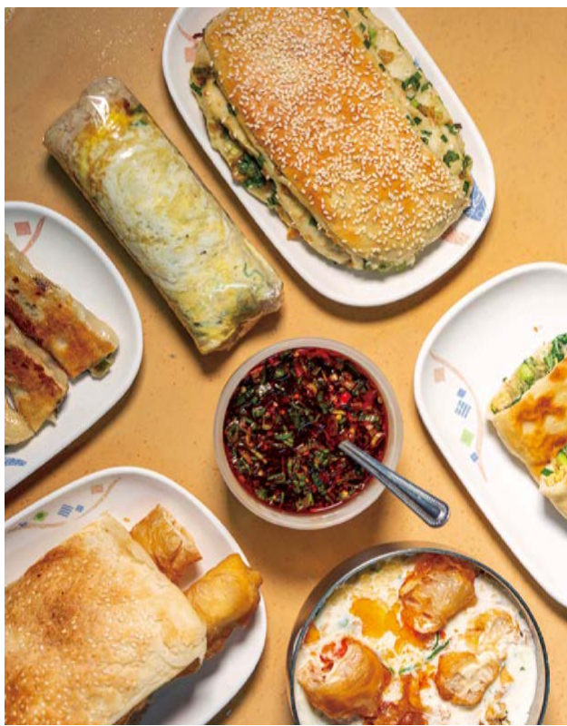
燒餅油條、蔥餅、飯糰、鹹豆漿等等，都是巨人傳統早餐的熱門餐點。