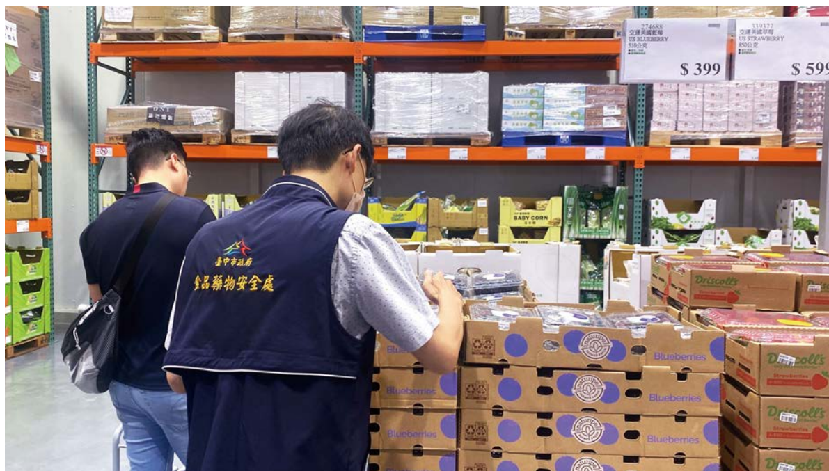
身為第一線稽查人員的台中市食品藥物安全處同仁們，日常工作繁瑣，還得有「柯南辦案」的細心。