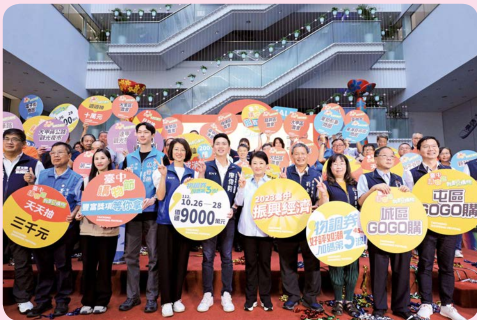
盧秀燕市長於記者會宣布2023台中購物節活動開跑。

不同於往年邀請藝人做宣傳，今年的台中購物節由盧市長親自擔任代言人，出席記者會宣告全民期盼的購物節正式開跑，10月26日至12月26日兩個月時間，邀請全民來台中吃喝玩樂，買好買滿抽大獎。