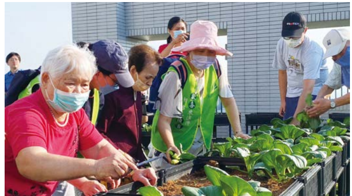
南屯精科社宅共享菜園豐收的成果，更是長者與鄰居之間的共好日常。

為了提升年輕人入住機會，台中好宅獨步全台推出加分機制，針對設籍台中的勞工或育有學齡前幼兒的家庭提高加分權重，扶植青年移居打拚，並降低生兒育女的經濟重擔。