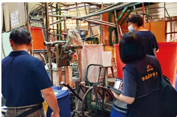
1-2: 為了提升食品製造業者衛生自主管理能力，食安處與大專院校共同合作執行產學聯盟計畫。

益的角度出發，但絕非與業者為敵，而是有賞也有罰、期待與業者共好。台中市食品藥物安全處同時也積極推動產學合作，讓專家學者帶領業者了解最新食安法令規定、手把手解決需要改善的環節。每年也舉辦盛大的授證活動，表揚守護食安、友善環境的優質餐飲業者。