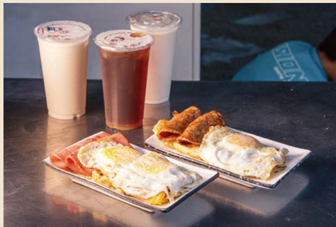
一心古早味蛋餅以粉漿蛋餅聞名，份量紮實卻平價。