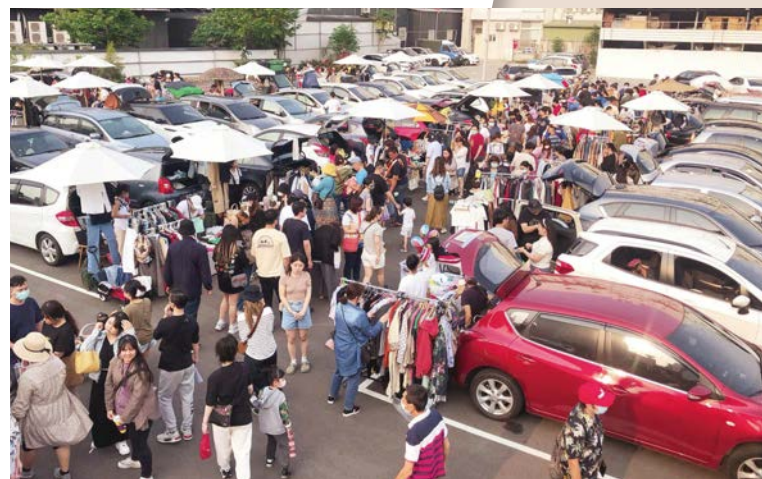
漾der「後車廂二手市集」，打開後車箱就能開賣！

秉持著「他的舊愛，你的新歡」的核心理念，除了提供二手挖寶的樂趣外，最大特色是不定時推出的不同二手主題，如：小孩專屬二手、大人專屬二手、後車廂二手等等，讓每個人都能依照需求，選購到二手好物，許多物品都是用銅板價