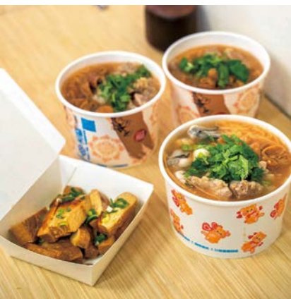
南屯老街有許多傳統店舖，其中不乏人氣美食老店，廖記老街麵線就是其一。

老街除了有歷史還有美食，鄰近萬和宮的廖記老街麵線，從早上7點開門營業，是深受在地人喜愛的人氣老店；對面則是開業超過一甲子的阿有麵店，熟門熟路的饕客總是點一碗餛飩湯和陽春麵，配上東泉辣椒醬，就是最熟悉的好滋味。