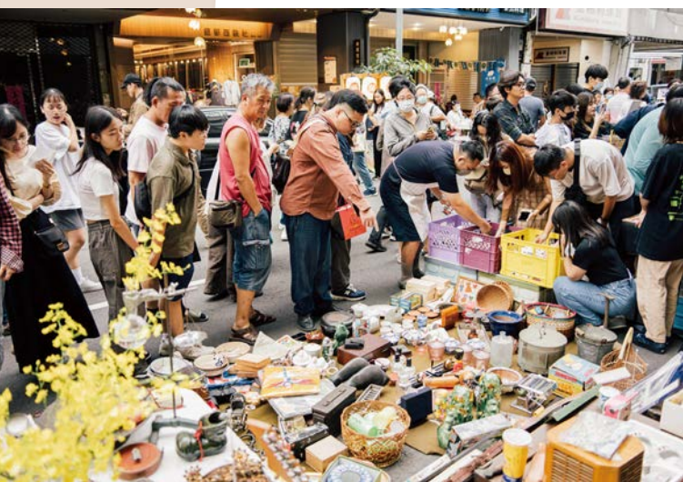
「舊物盛典」市集以古著衣物、老玩具、古董古物為主，總是吸引不少老物迷朝聖。

用品、胃袋與心靈，都一次滿足。因應每場盛典的不同調性，市集也會企劃不同活動，從常見的音樂展演，邀請復古同好在市集展出珍品或辦理分享會，甚至連結古著店家與高齡長者在市集舞台中走秀，都是只有來到市集才能遇見的驚喜。✿