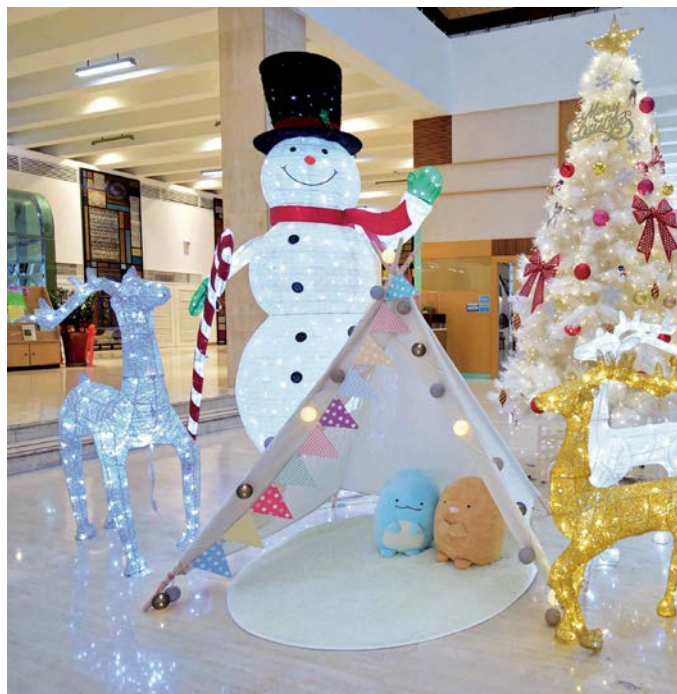
葫蘆墩文化中心延續去年於大廳佈置耶誕雪景，與民眾歡度耶誕美好時光。

大廳則有「聖誕同樂繪」活動，歡迎小朋友揮灑創意，盡情彩繪塗鴉，打卡上傳當天活動照片，還能獲得限量的「DIY彩繪板」小禮物，喜愛畫畫的小朋友千萬別錯過！下午1點開始，藝享舞台會由「奏出福爾摩沙弦樂團」帶來動聽的耶誕樂曲，緊