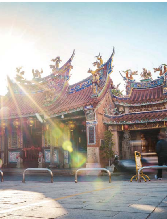
南屯老街以萬和宮為核心，周邊座落著古厝和傳統店舖，古意盎然。