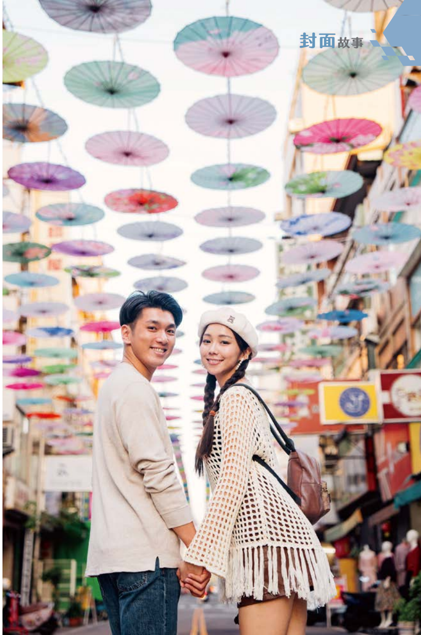
台中廟東商圈以夜市美食聞名，好吃又好買！

10月最後一個週日，皮卡丘、哈利波特、安妮亞、變形金剛等電影、動漫中的人氣角色，齊聚在豐原太平洋百貨，與殭屍、幽靈、巫婆扮相的大人小孩，共同參與「2023台中萬聖