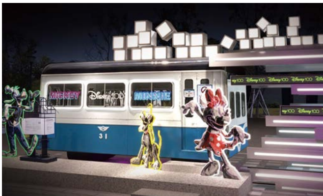
LaLaport也同樣以迪士尼主題打造科技未來感十足的耶誕造景。

海線的耶誕活動也令人萬分期待，MITSUI OUTLET PARK台中港為慶祝迪士尼100週年，推出「璀璨慶典 夢想典藏」迪士尼100主題燈飾活動，包括迪士尼、皮克斯、漫威電影宇宙、星際大戰等經典動畫、電影中的高人氣角色，通通都會在園區驚喜現身，配合Outlet濱海的特色，迪士尼特地打造大型蒸汽船造景，結合氣勢磅礴的燈光投影，帶給遊客滿滿的驚艷與感動。