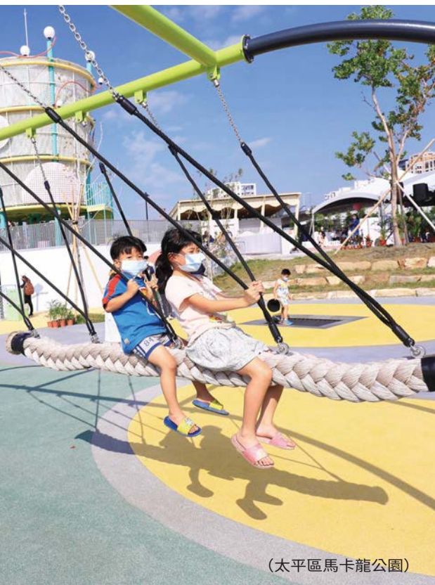
(太平區馬卡龍公園)