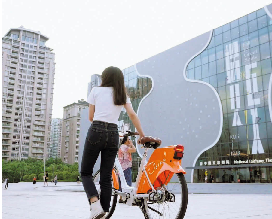
台中綿密的交通運輸網搭配優惠，照顧民眾通學通勤需求。