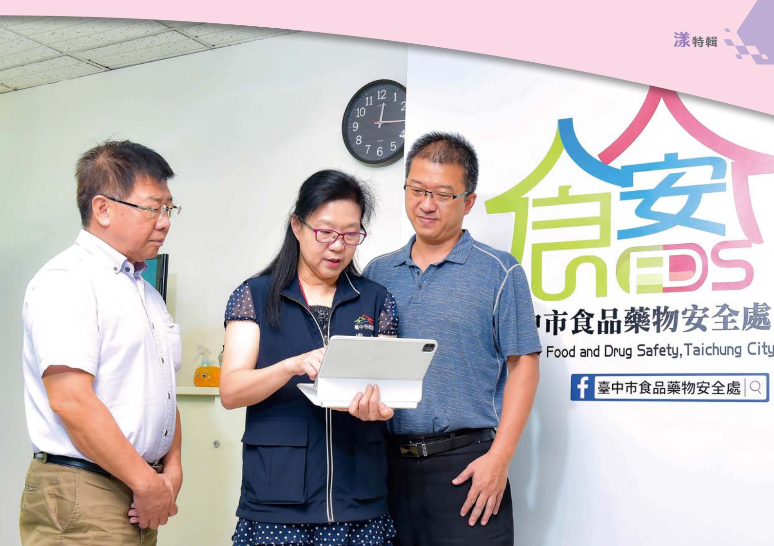
台中市食品藥物安全處為市民食品及藥物安全把關！

冰桶、溫度計，各種工具都須具備，到了現場也多半得不到業者的好臉色，輕則詫異抱怨，重則遭到叫囂威脅。「曾經有業者，直接把同仁用來記錄的稽查板拍落至地上。」台中市食品藥物安全處長傅瓊慧不捨的說，稽查現場環境條件不一，在沒有空調的工廠汗如雨下、或是在大型冷凍庫裏凍得快失溫，都是第一線同仁必須克服的困難。