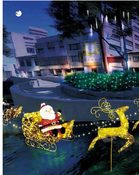
1 | 2 | 3 耶誕嘉年華在綠川、柳川設有水岸燈區，光彩奪目。