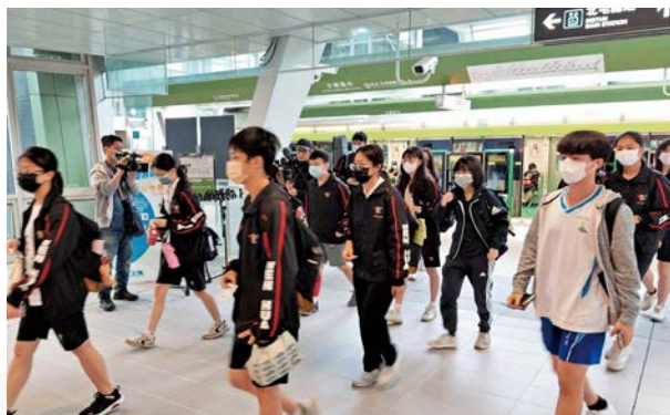
台中市境內公共運輸定期票為通學的學生減輕交通費用負擔。

台中市境內的大眾運輸工具，包含捷運、台鐵及市區公車。此外，搭配超過1,300站點的YouBike，透過綿密的公共自行車站點搭配公車路網，照顧通學通勤需求。