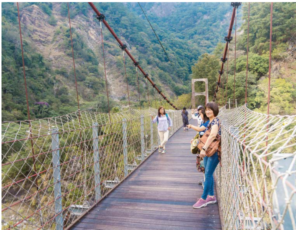
捎來吊橋是前往捎來步道的必經橋梁。

老街除了有歷史還有美食，鄰近萬和宮的廖記老街麵線，從早上7點開門營業，是深受在地人喜愛的人氣老店；對面則是開業超過一甲子的阿有麵店，熟門熟路的饕客總是點一碗餛飩湯和陽春麵，配上東泉辣椒醬，就是最熟悉的好滋味。