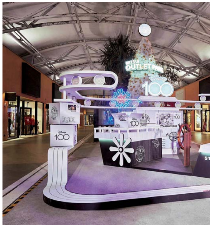
三井Outlet今年推出「璀璨慶典 夢想典藏」迪士尼100主題燈飾活動，打造大型蒸汽船造景，璀璨絢麗。

主題燈飾從11月20日開始，橫跨耶誕、跨年與春節連假，一路點亮到明年2月29日。展場位於南一口至南四口之間的室外廣場，因應迪士尼的各種角色，打造科幻、街頭、古典、俏皮等多元風格佈景，好玩又好拍，粉絲別錯過這千載難逢的合影機會，活動期間MITSUI OUTLET PARK台中港也會陸續推出精彩表演與購物優惠，是週末闔家大小出遊的好選擇。