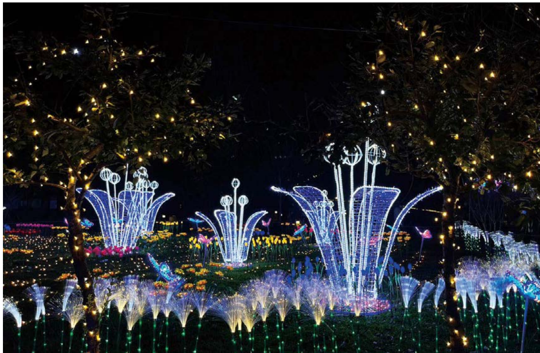
山谷燈光節將延續2022年，點亮梨山與谷關兩處燈區，於山林之中更顯夢幻浪漫。

此飛躍穿梭，動感又活潑，三樓的炫光空橋，以絢爛光影營造視覺饗宴，讓人猶如置身宇宙蟲洞，未來感十足。