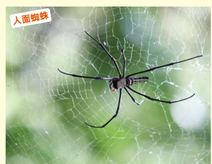
人面蜘蛛，其背上之花紋酷似老人之臉孔而得名，腹部上有黃褐及黑褐色之條斑，廣泛分佈於台灣各地，低海拔山區較常見。