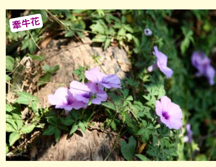
一年生草本，全株呈毛絨狀，喜歡日照、排水良好的環境，花朵喇叭形狀，生性強健，為極普遍的雜草，幾乎四季開花。