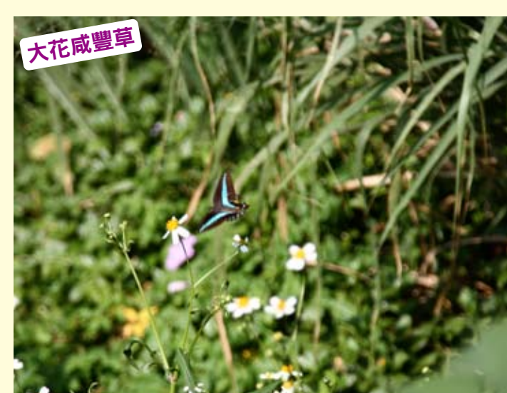
大花咸豐草為一或二年生，莖是四方形，高約 70 公分。果實為黑褐色，細細長長，上端有具逆刺的萼片，以附著人畜，散佈果實。