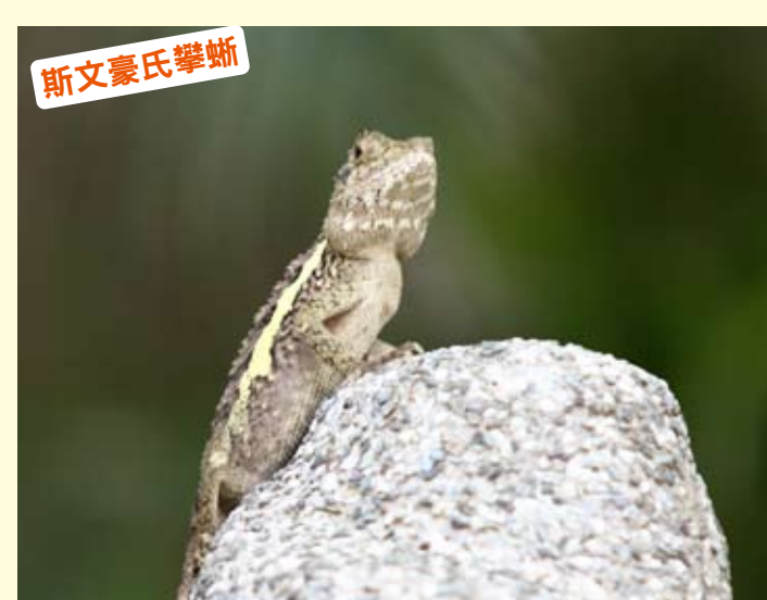
台灣特有種，廣布於海拔1500公尺以下地區。大致呈黃褐色，頸部底色為灰色帶有白斑，全長可達31公分，為目前台灣攀樹蜥體型最大者。