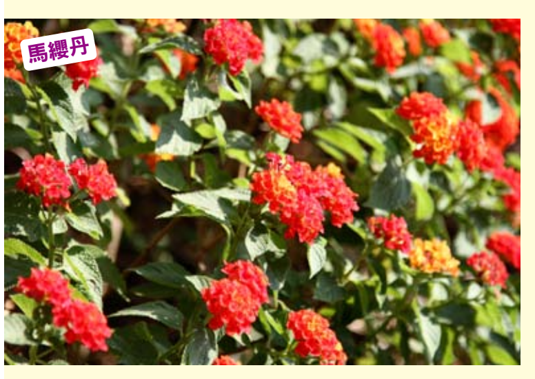
四季開花的觀賞植物，有黃、白、紅等色，原產於熱帶美洲，由荷蘭人帶來台灣。葉子對生、邊緣鋸齒狀，並有短硬毛，花成散狀排列。