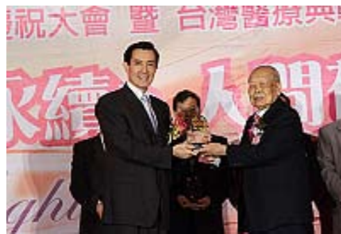
（左：馬總統英九 右：廖泉生醫師）

民國九十三年（2004）廖泉生醫師獲頒中華民國第十四屆醫療奉獻獎，民國九十五年（2006）獲頒年度全國資深優良人員獎，民國九十八年（2009）更獲頒臺灣醫療典範獎，實為醫者行醫之典範。長子廖仁博士秉志承業，使仁愛醫院為臺中地區（大里、太平、烏日及霧峰）最大的區域教學醫院，為提供完善的醫療保健而努力。