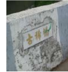
經過龍船埤為花甲橋 通過樹王埤為古稀橋