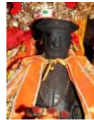
（嘉義城隍廟周鍾瑄神像）

周鍾瑄（1671—1763）字宣子，貴州貴筑青岩人（貴陽市花溪區青岩鎮）。康熙三十五年（1696）舉於鄉，康熙五十一年（1712）補福建省邵武縣令，康熙五十三年（1714）轉調知諸羅縣事。當時諸羅雖與臺灣、鳳山並列三縣，實際上土曠人稀，周鍾瑄到任後，興修水利，使收成田穀倍收；興建公共設施，如木橋、驛亭、重修諸羅縣署和城樓、廣建縣倉社倉等。此外，還興辦教育，修義學，土番社學，修緝縣學推展地方教育；以及除弊減稅等措施，減輕民人的負擔。