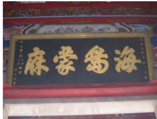
福興宮「海島蒙麻」匾額