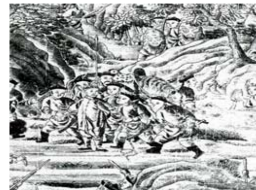
林爽文於老衢崎（今苗栗竹南）被俘（乾隆平定臺灣戰圖）

其後清廷下詔改以協辦大學士陝甘總督福康安、領侍衛內大臣參贊海蘭察率侍衛巴圖魯一百二十餘人並滿漢士兵九千人增援臺灣，並由鹿港登陸。爽文聞報後遣所部拒之。乾隆五十二年（1787），爽文軍與官軍先戰於八卦山敗走，復敗於牛稠山，時官軍亦收復諸羅縣城，爽文聚眾守斗六門以抗。福康安與海蘭察再進以攻之，爽文再敗，遁走大里杙，構土壘、列巨礮，重設木柵以拒官軍。