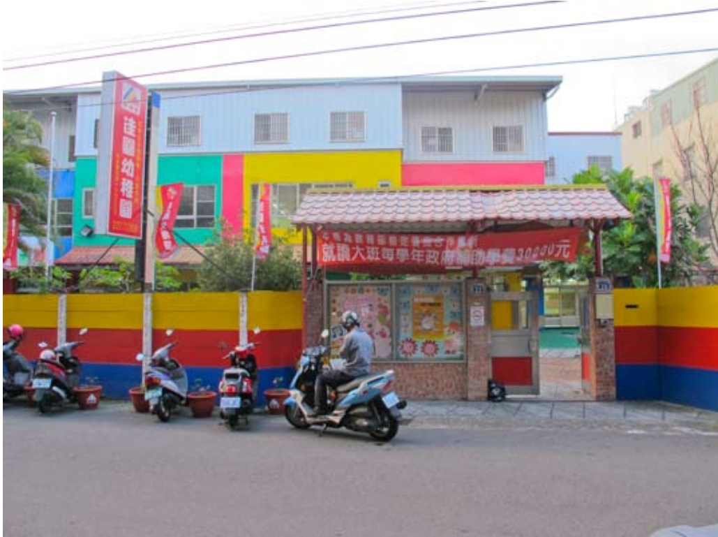
照片7-1-2 私立佳園幼稚園