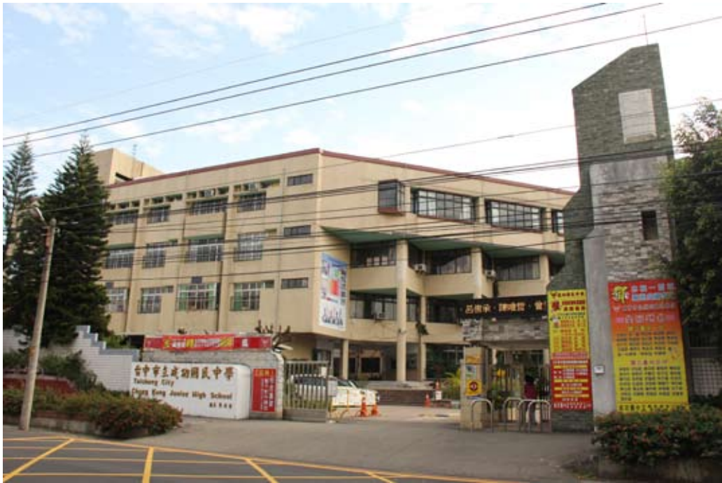
照片7-3-1 成功國民中學