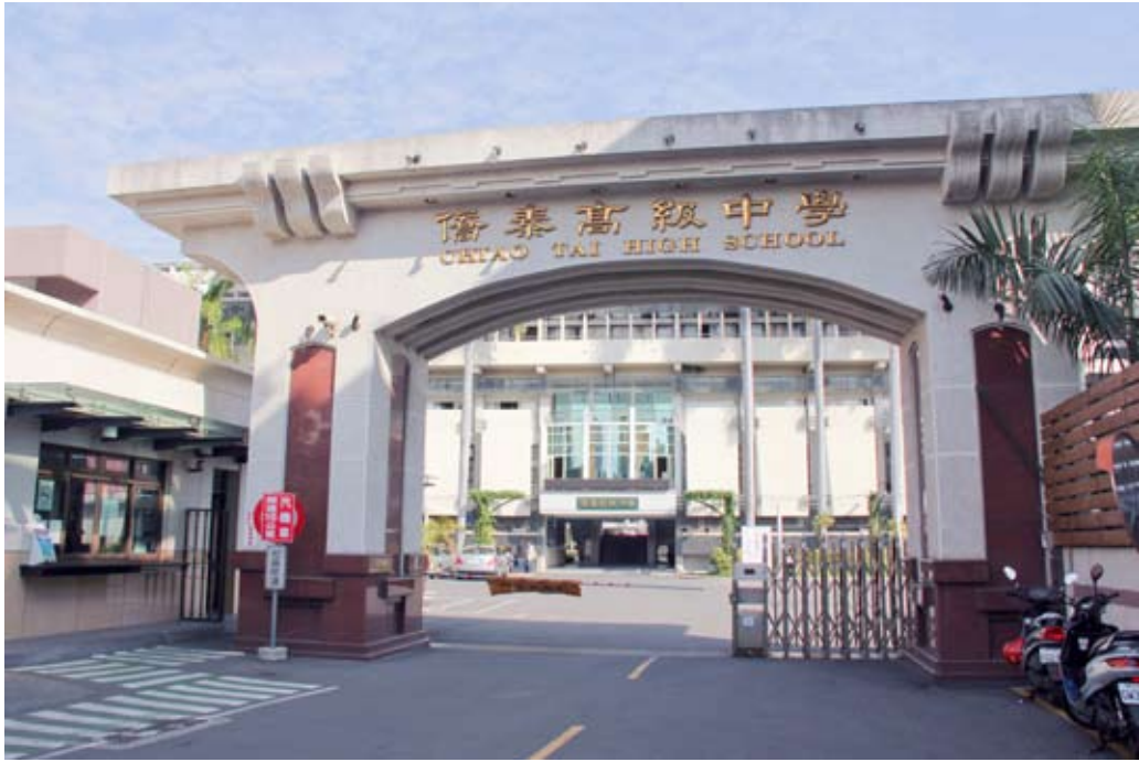
照片7-3-7 私立僑泰高級中學