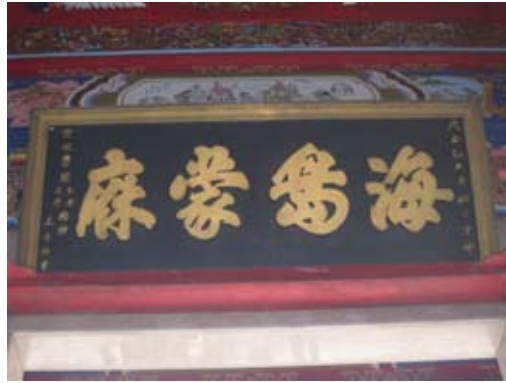
福興宮「海島蒙麻」匾額