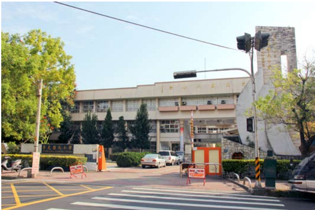
照片7-2-6 崇光國民小學