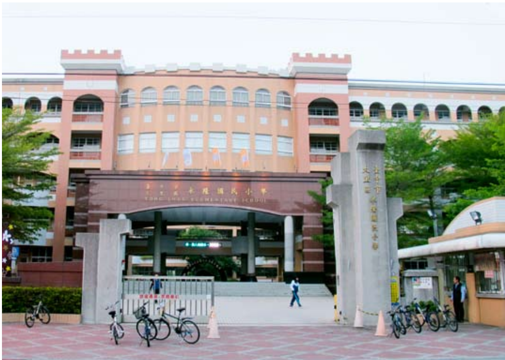
照片7-2-10 永隆國民小學