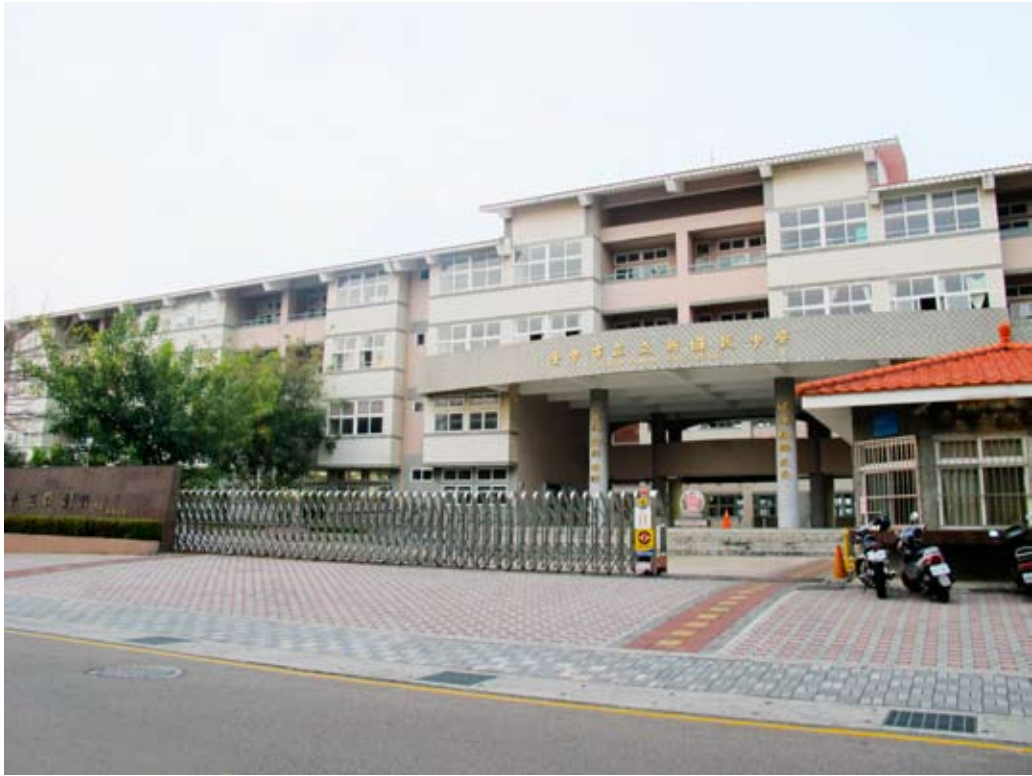
照片7-3-5 立新國民中學