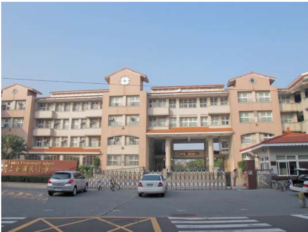
照片7-2-12 立新國民小學