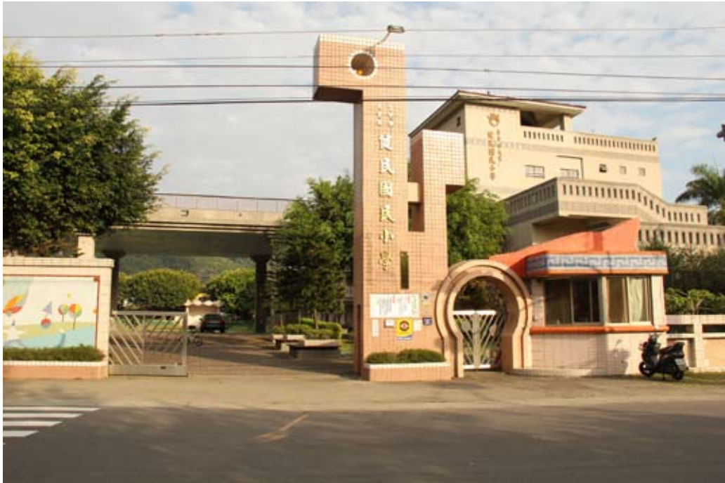
照片7-2-5 健民國民小學