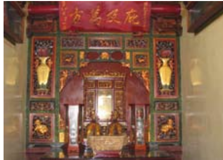
七將軍廟「庇及萬方」匾額