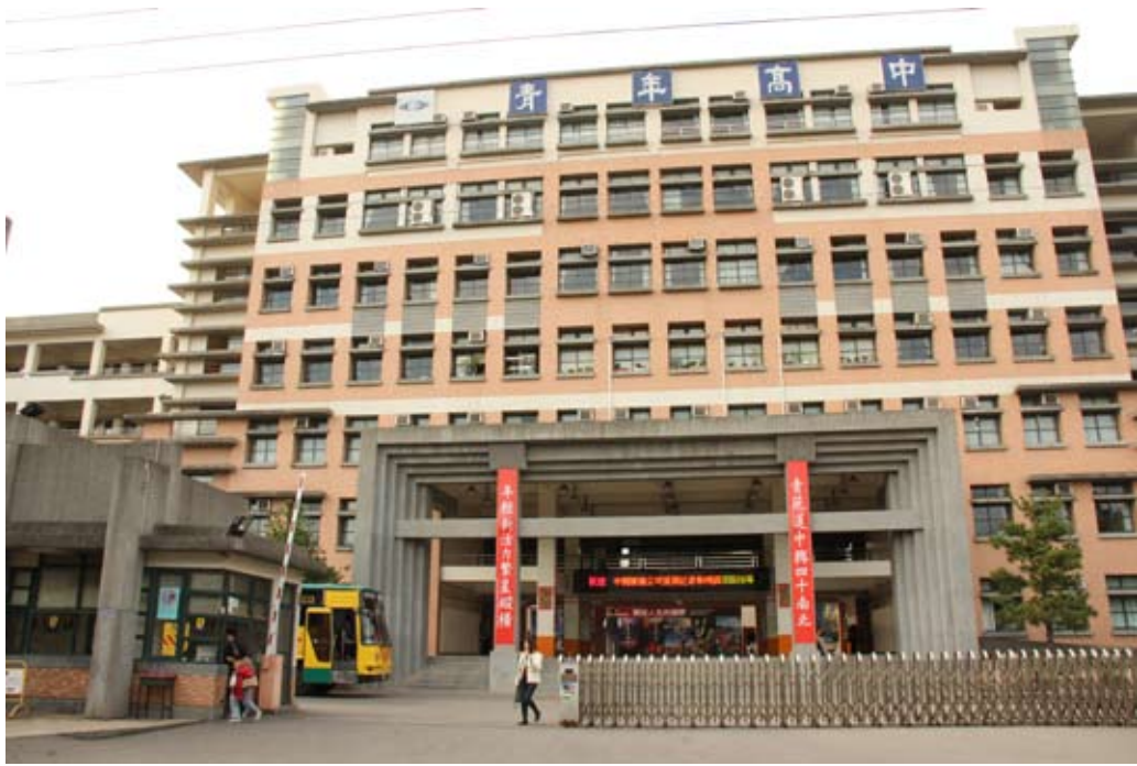
照片7-3-9 私立青年高級中學