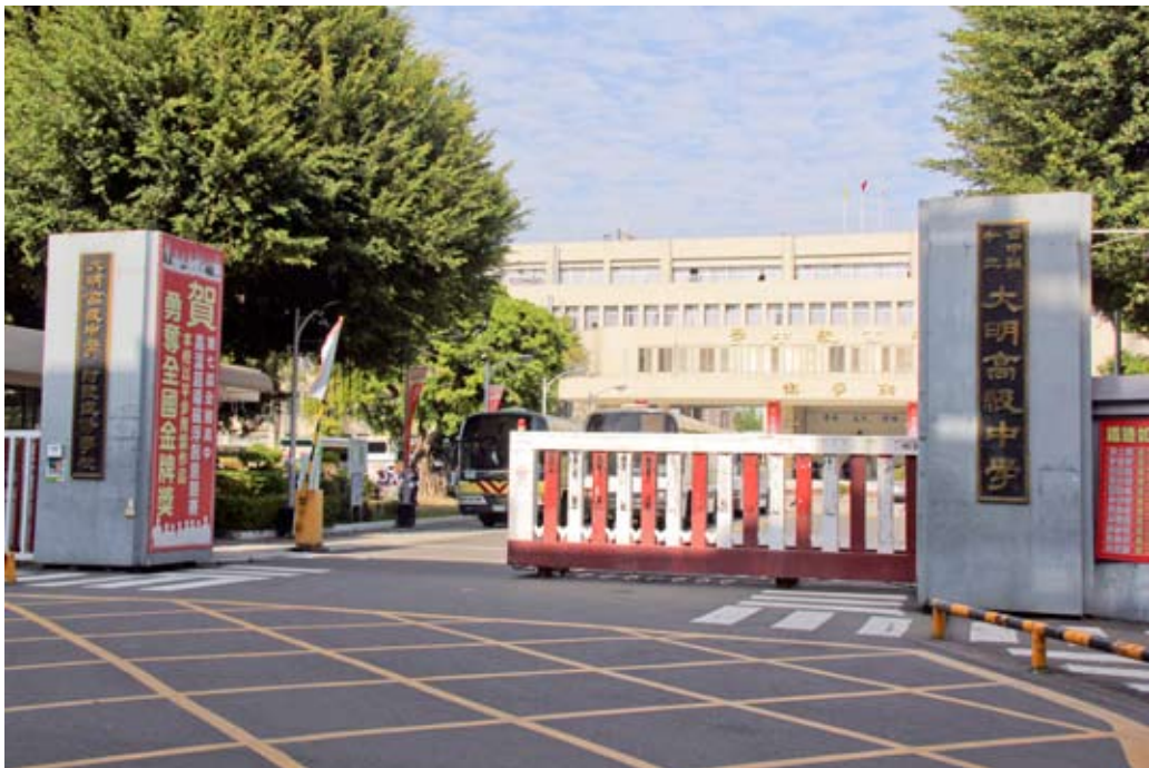
照片7-3-6 私立大明高級中學