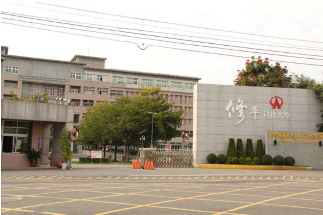
照片7-4-1 修平科技大學