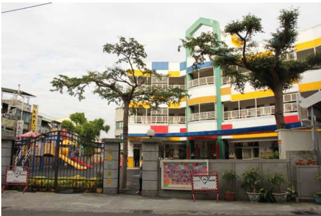
照片7-1-8 私立東昇幼稚園