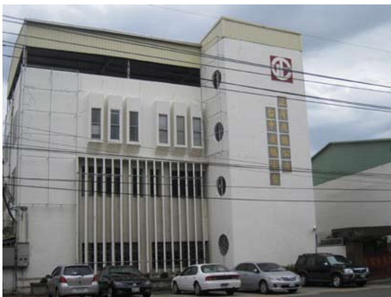
正聲廣播公司臺中廣播電台

依據：正聲廣播電臺官方網站，網址： http://www.csbc.com.tw/ ，2012年3月29日讀取。