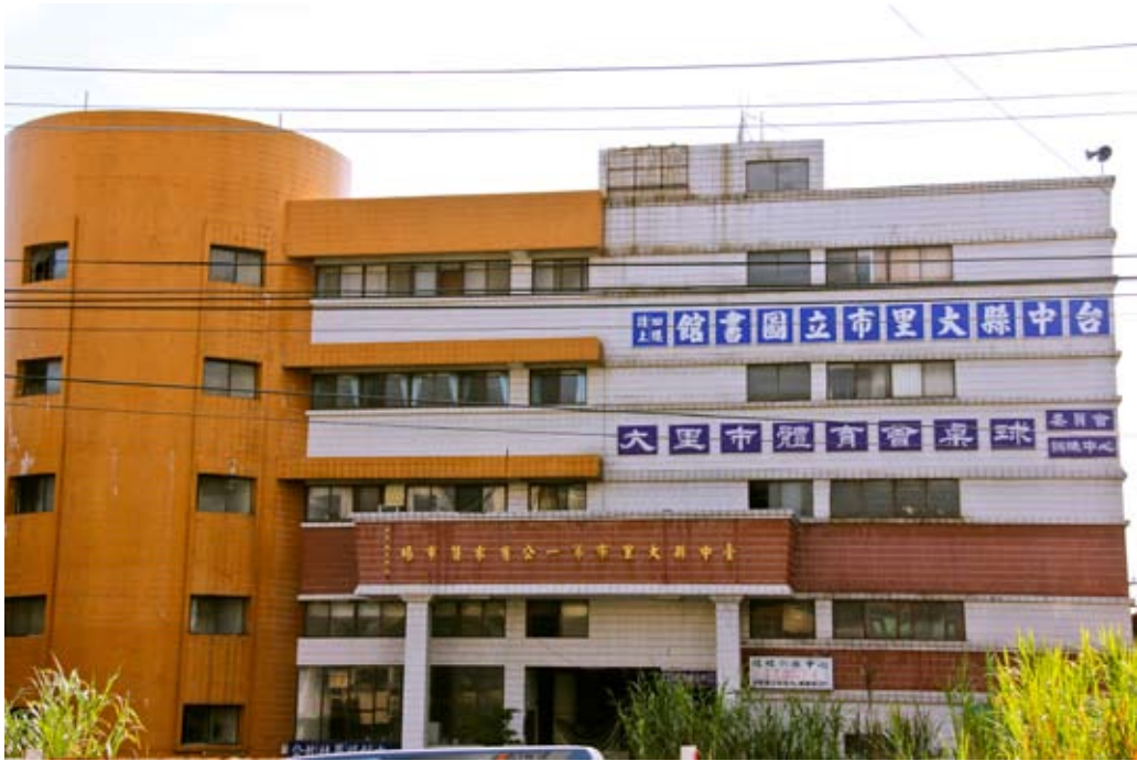
照片7-5-3大里圖書館德芳分館