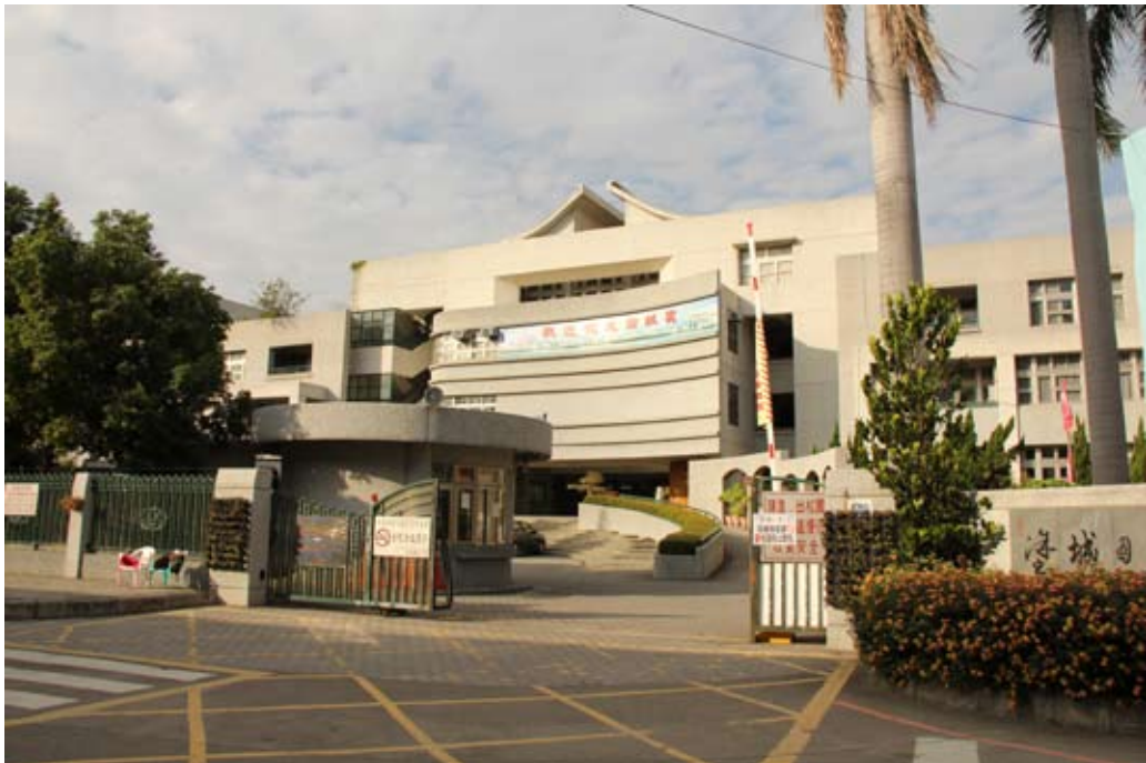
照片7-2-2 塗城國民小學