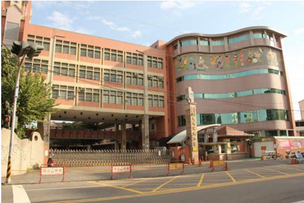
照片7-2-9 大元國民小學