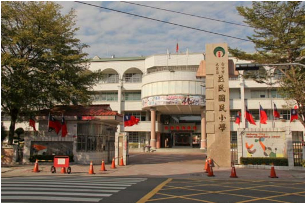
照片7-2-8 益民國民小學