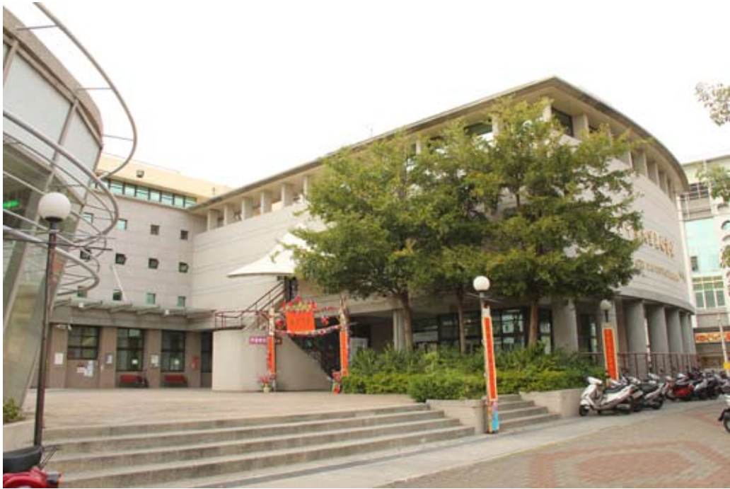
照片7-5-1 大里圖書館總館