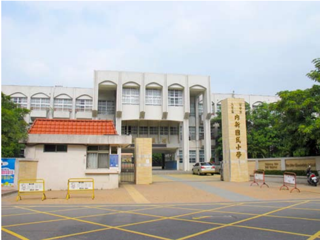
照片7-2-4 內新國民小學