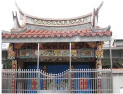
祭祀公業林大伯紹復堂