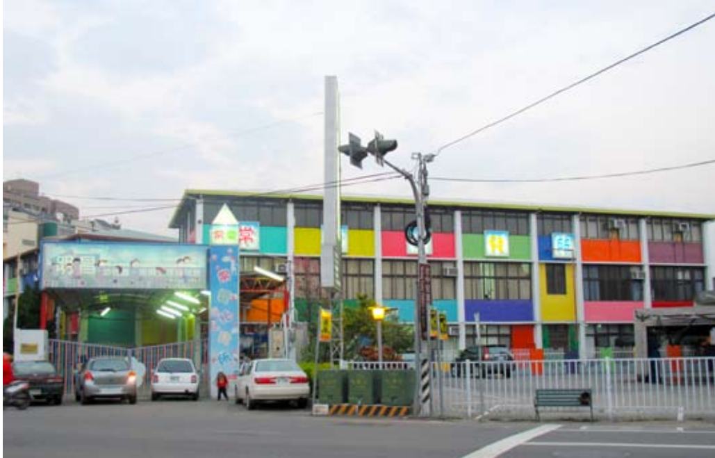
照片7-1-1 私立明昌幼稚園