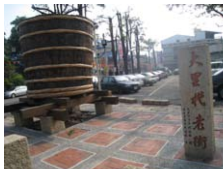
大里代老街以鹹菜桶為入口意象