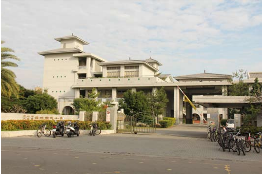
照片7-2-7 瑞城國民小學