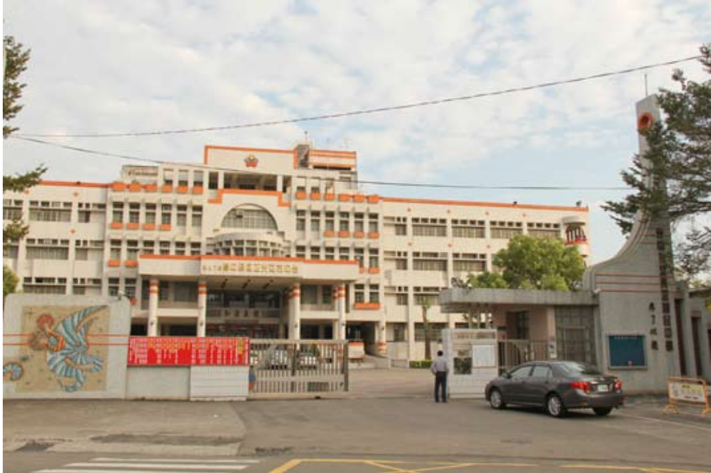
照片7-3-3 光正國民中學