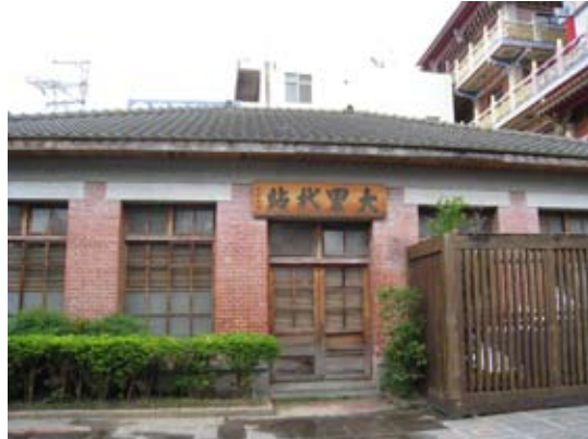
大里杙站（大里杙產業文化館）

館內每周一到五開放，固定展出大里杙老街今昔等史料，有了解傳統建築工法、大里杙古文物和老照片。附帶定期換檔展出林爽文事跡、老街藝術家、臺灣常見民俗植物及紹復堂剪粘藝術等。動態活動方面，曾辦理過「古禮迎親」等活動，依循古代婚禮習俗，從坐花轎、跨火爐，喜氣洋洋迎娶新嫁娘入門，讓市民和學生親身體驗老祖宗們是如何完成終身大事。