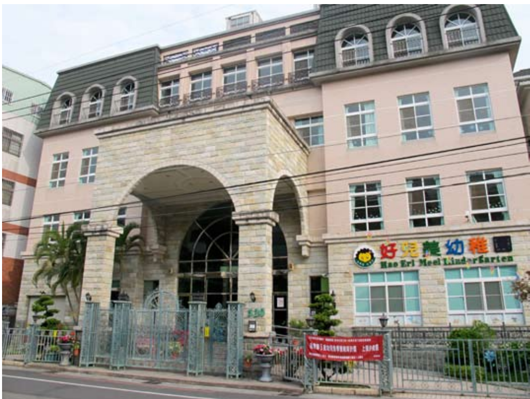
照片7-1-6 私立好兒美幼稚園