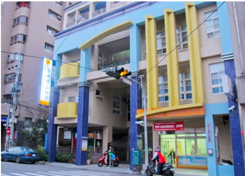
照片7-1-4 私立麥米倫幼稚園