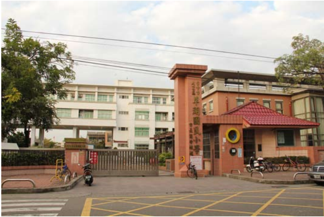
照片7-2-3 草湖國民小學