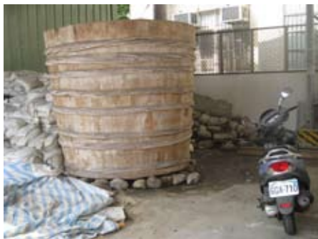
鹹菜巷僅存的傳統鹹菜桶