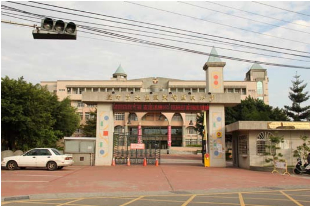
照片7-2-11 美群國民小學