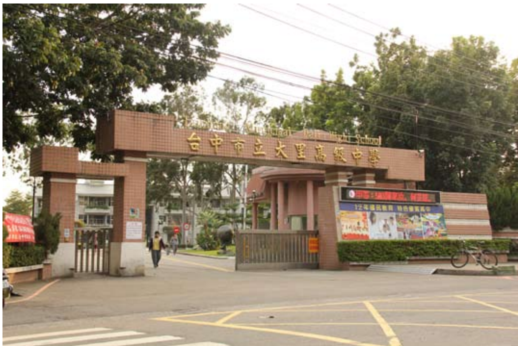
照片7-3-10 臺中市立大里高級中學