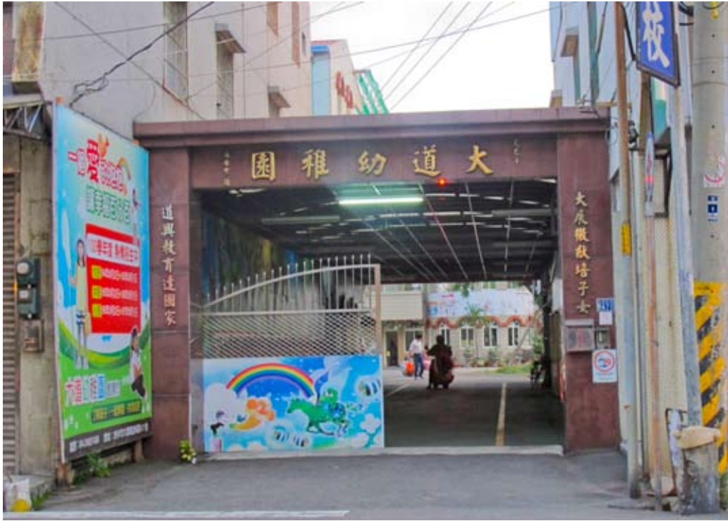
照片7-1-3 私立大道幼稚園