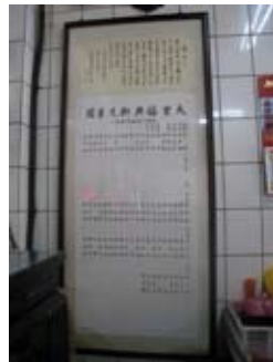
福興軒高懸 〈大里福興軒先輩圖〉