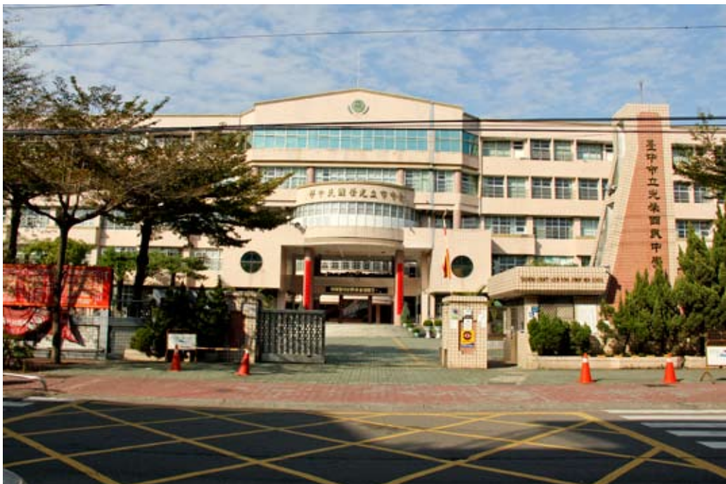
照片7-3-2 光榮國民中學