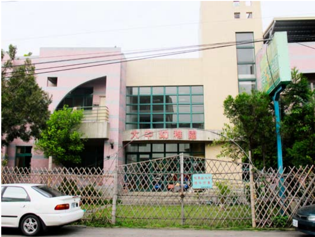
照片7-1-7 私立大中幼稚園