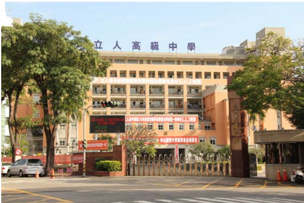
照片7-3-8 私立立人高級中學