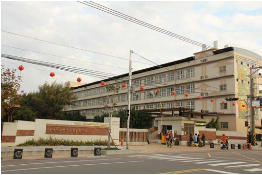
照片7-2-1 大里國民小學