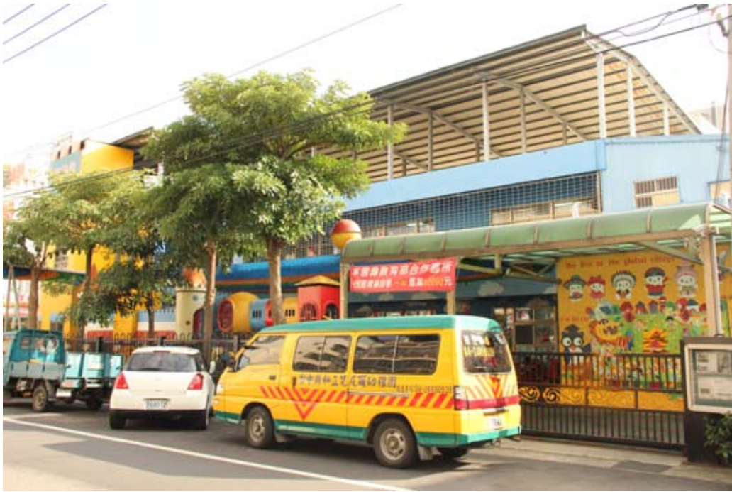
照片7-1-5 私立梵尼爾幼稚園