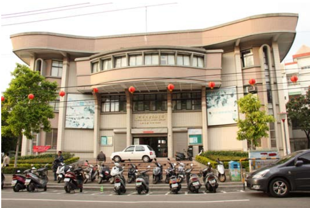
照片7-5-2大里圖書館大新分館