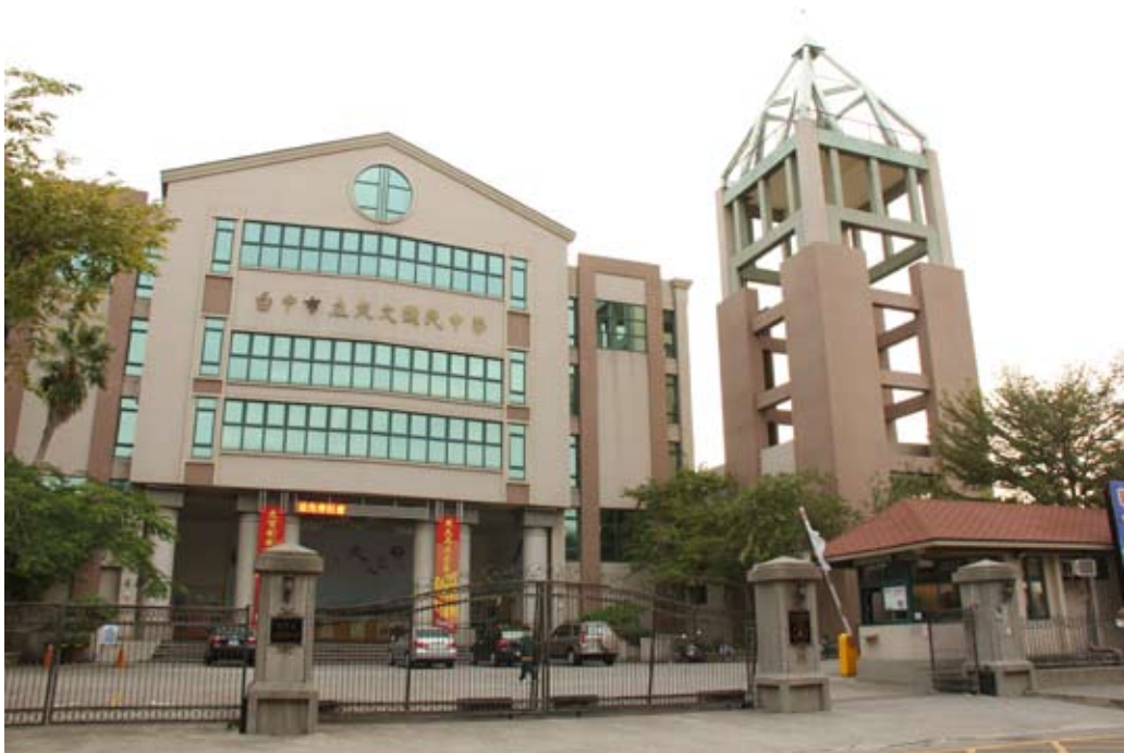
照片7-3-4 爽文國民中學