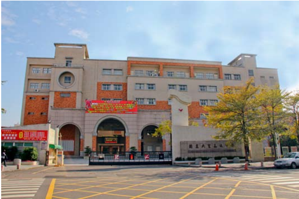
照片7-3-11 國立大里高級中學