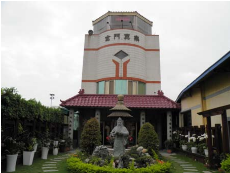
照6-3-18 玄門真宗大里玄興禪院外觀

義禮智信』為教派的核心價值觀，導入社工、志工等訓練課程，信徒大眾透過每一階段的學習過程，領略人生的圓融大道。玄門真宗教成立生命教育中心，規劃一系列宗教師專業培訓課程，如靈療推拿技術、寺廟管理學、生命教育諮詢、採訪、理財及居家關懷照護等符合社會需求課程，以宗教的力量引領信徒親近神靈聖殿國度，進而淨化自身的煩心塵緣，了悟圓融無礙的聖凡雙修人生。年中主要祭典，農曆6月24日關聖帝君聖誕慶典及院慶。 147 論者認為組織龐大、科層化、強調高學歷和年輕化是該教派的特徵和策略之一，其宗教組織遠勝於其他鸞堂，又與政界關係深厚，使得其活動力旺盛，得以吸引年輕優秀的人才加入，與佛光山、靈鷲山、中台山等新興佛教團體類似。 148