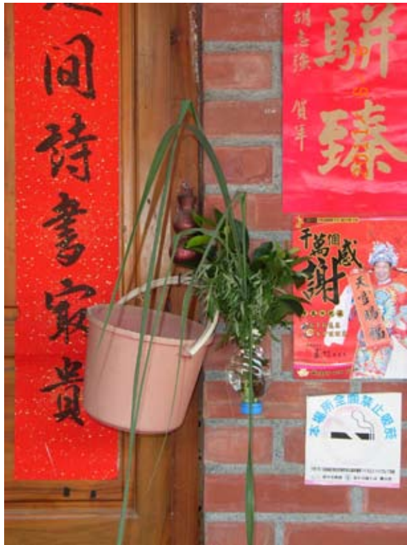
照6-4-1 本市端午節時，住戶門上插艾草、榕葉、香茅等物。