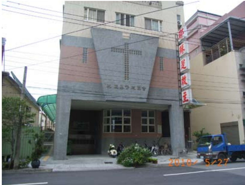
照6-3-22 大里基督徒聚會會所一景