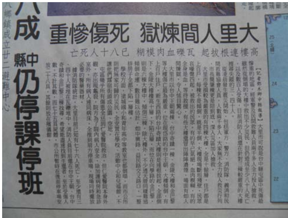
照6-2-3 報紙以〈大里人間煉獄 死傷慘重〉為標題，凸顯本市傷亡的情況。

翻拍自大里市農會編印，《生根 深耕—台中縣大里市史料暨產業文化專輯》，頁235。