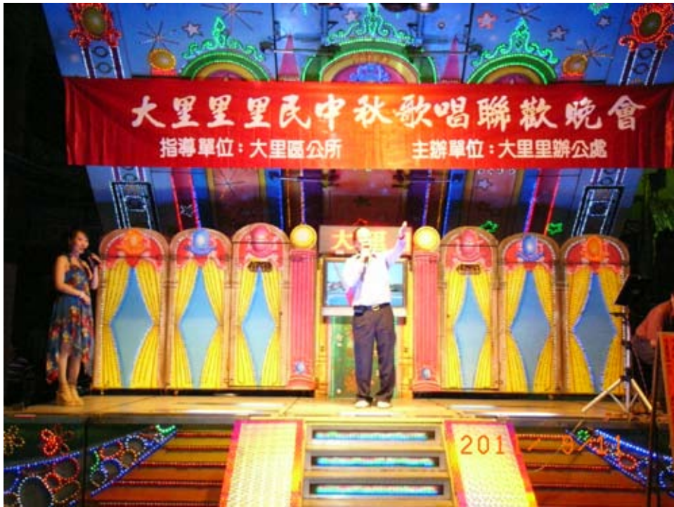
照6-4-9 中秋節的聯歡晚會