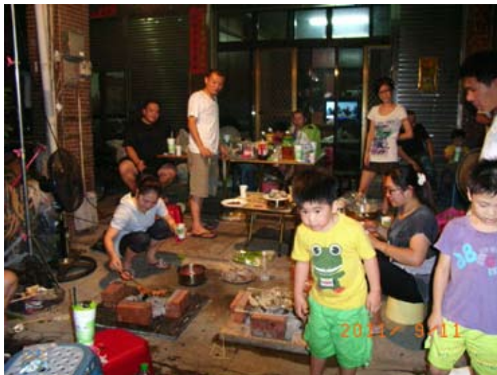
照6-4-10 大里中秋節烤肉

(六) 中秋節 本市市民會在中秋節用月餅祭拜地基主及公媽，另外戰後臺灣各地流行在中秋節烤肉，本市亦不例外，中秋節晚上，各住家門口常見家人齊聚一同烤肉的景象。