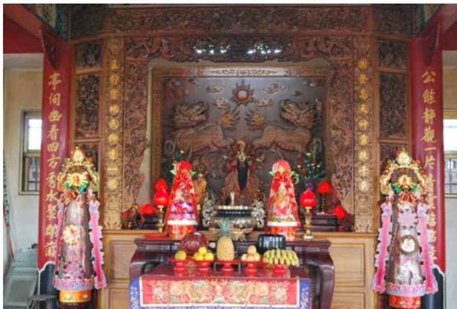
照6-3-8 本市樹王公廟之樹王公神尊