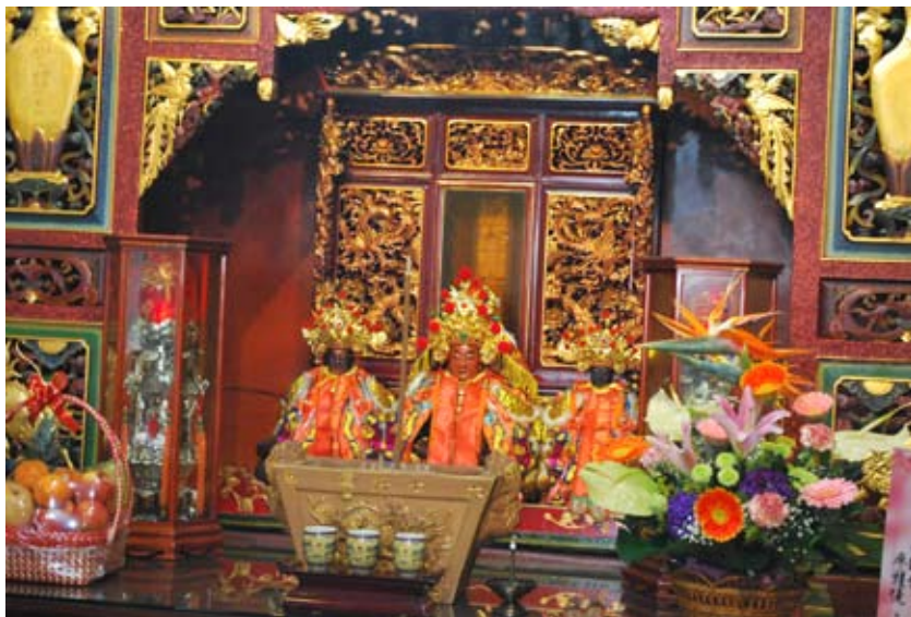
照6-3-10 大里市七將軍廟中的七將軍神像