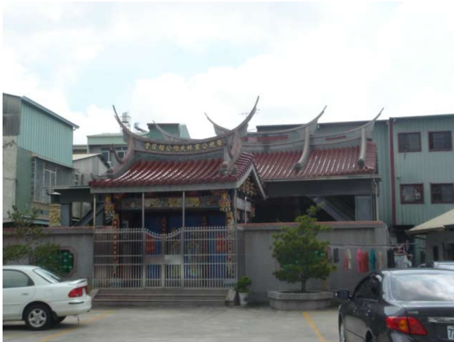
照6-3-23 紹復堂宗祠一景

本地地區宗祠的出現，最初在乾隆40年（1775）大里杙內新庄建有林祿公祠，日治時期中部林氏決議重建旱溪的林尙親堂，後改名「中部林氏大宗祠」，之後在更名爲「臺灣林氏宗廟」，但終日治時期皆未獲准更名，而沿用建築委員會制。 187 此宗祠成爲中部地區一大宗祠，亦是本地許多林氏祭祖之處所。除了此林氏宗廟外，另有祭祀公業林大伯公紹復堂，民國74年登記。