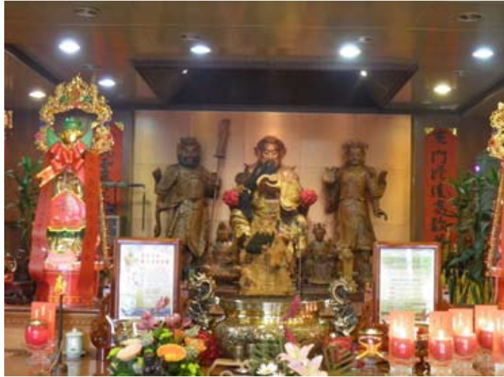
照6-3-19 玄興禪院內的關公神像