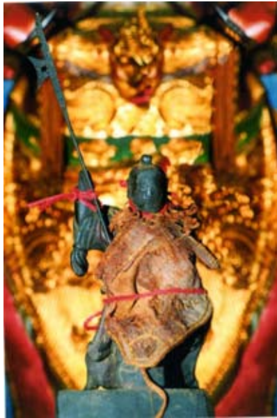
照6-3-5 草湖太子宮最早期的太子神尊