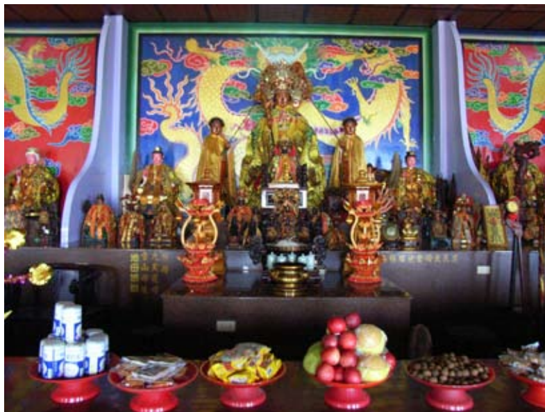
照6-3-3 本市金城慈惠堂的王母娘娘

漢末年民間竟盛行西王母之祀。東漢以來，鑒於西王母在民間的影響，道教將其視為教中神祇，日後在倒是文人的推波助瀾下，西王母成為元始天尊之女，群仙之領袖，又以東王公與之匹配。在此情況下，《山海經》中記載的古代神化頗有礙其形象，於是好事者百般開解，謂蓬髮戴勝，虎齒善嘯者，乃王母之使，金方白虎之神，非王母之真形。唐以來，又有編造姓名者，玉皇大帝信仰興起後，民間又將西王母與之相匹，稱為王母娘娘。在道教經典、神怪小說、民間故事中，都將王母娘娘視為一重要之女神。 28 本市塗城里金城慈惠堂、仁化里仁愛慈惠堂主祀之。