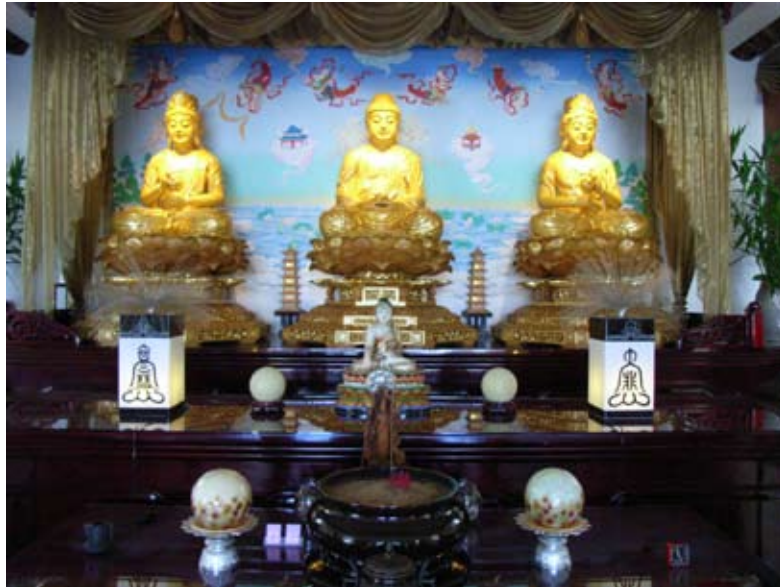
照6-3-16 妙光學舍的供佛