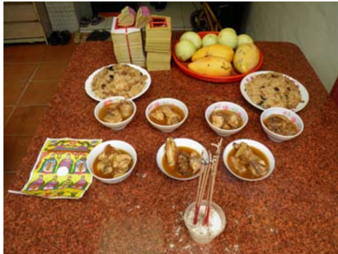
照6-4-3 本市中興路二段一帶，七月初七拜七娘媽的供品。

中元節的節氣氣氛仍重，本市的市民會在今天拜地基主、公媽及拜好兄弟（又稱拜門口）。一樣具有公普及私普二種普渡方式。