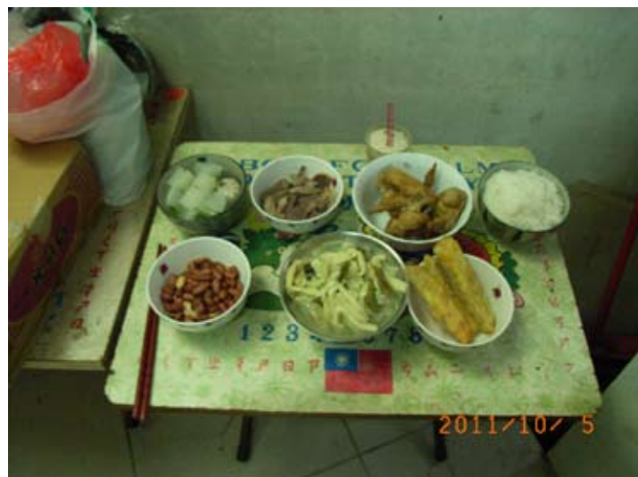
照6-4-12 大里市重陽節祭祖時，