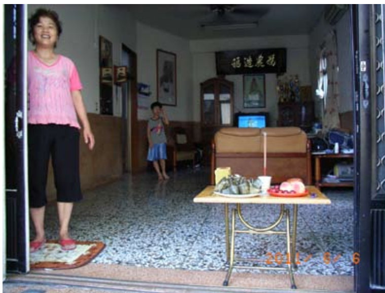
照6-4-2 端午節拜地基主，由門口往內拜。