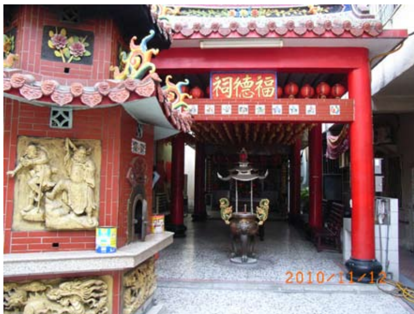
照6-3-14 六桂花福德祠一隅