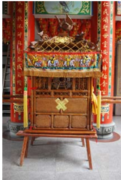
照6-2-1 大里福興宮的媽祖神轎

雖然在23天中，僅有第4天至第9天，以及第11天到12天，遶境神轎到大里地區巡行，但是大里幾座重要廟宇如內新庄新興宮、大里福興宮、仁化振坤宮及大突寮聖明堂等都有大轎，與旱溪樂成宮、喀哩新南宮兩廟具有大轎的宮廟，一同遶境。 74 這六頂神醮便成爲十八庄遶境中，具有象徵意義的符號。原本十八庄遶境僅有五頂神醮，大突寮聖明堂是近幾年才加入。本市的神轎卻是從第一天就參與到遶境隊伍中，一同巡繞十八庄境。在媽祖遶境隊伍進入村莊，除了接受信徒的祭祀之外，參與的陣頭表演、各處熱烈燃放的鞭炮，都強化了遶境的喜慶場景。而許多停駐的宮廟或紅壇，大都邀請了劇樂團表演，凸顯了廟會的特色文化。 75