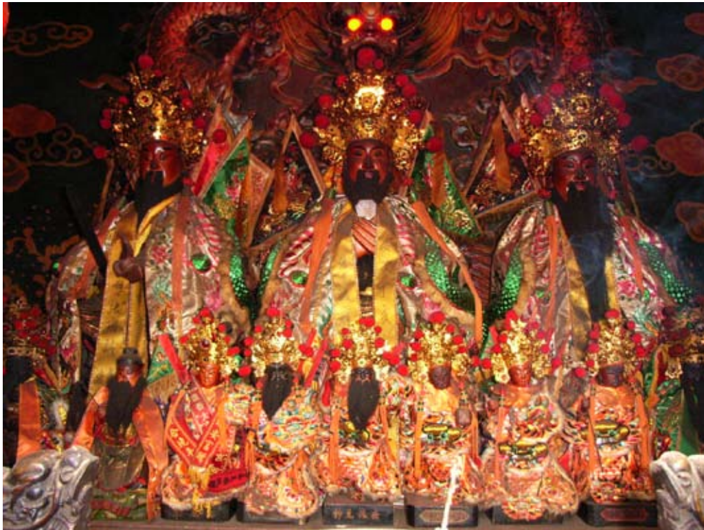
照6-3-2 本市武聖岳王廟的岳飛神像