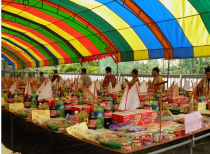
照6-4-5 仁化振坤宮的中元普渡。