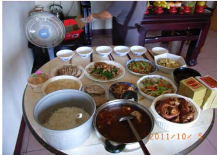
照6-4-11 大里重陽節祭祖的祭品

重陽節以不若日治以前，縉紳之家會宴會或登山遊玩，反倒是以祭拜地基主與公媽的方式，過此一節日。