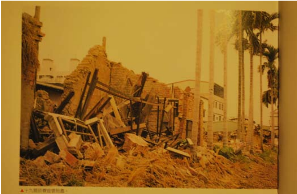
照6-2-2 本市的十九間菸寮倒塌毀壞。