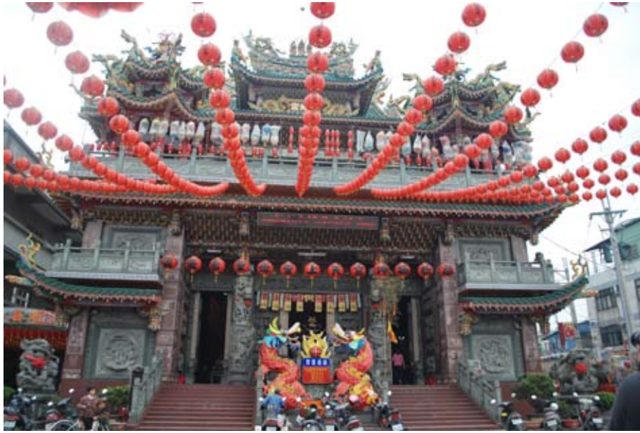
照6-3-13 大里市番仔寮振坤宮