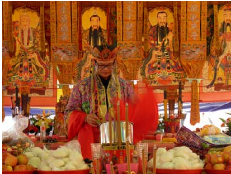
照6-4-6 仁化振坤宮中元普渡法師主壇的情況。