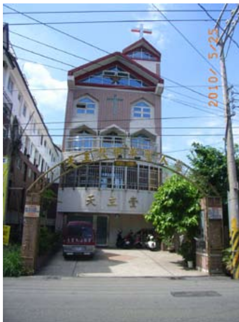
照6-3-20 大里中華聖人堂一景

本市的天主教堂主要為位於本市東明路620號的中華聖人堂，緣起於戰後教區委託已退休的馬道南神父開始尋訪教友，後由瑪利諾會洪惠慈修女繼續服務。等阿根廷生會的馬爾定神父接手牧靈時，鼓勵先租屋成堂，1996年聖誕節即正式開堂。民國88年（1999），歷經921地震搬遷後，信眾有感於購地建堂的迫切，積極覓地。從國有財產局標的現址，再四處奔走募款，駐堂的韓國耶蘇聖心侍女會修女也義賣泡菜共襄盛舉，2002年7月主保日破土，12月動工興建，至2004年7月完成，歷時年餘。同年10月恭請天主教教區主教愈榮主持落成，祝聖，並命名為「中華聖人堂」。創堂後歷任神父為歐維禮神父（1996/12-1998）、傅勞萊（1998-2004）、羅國彥（2004-今）。目前有教友170餘戶。例行聚會為每星期二、三、四晚上8點定期聚會；星期三、四、五晚上七點半彌撒時間；星期六晚上8點仁愛醫院彌撒；主日早上9點。 153