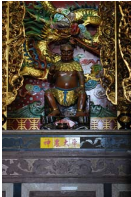
照8-3-1 振坤宮神農大帝神像

疾，又演八卦爲六十四掛。過去天子於每年十二月必大祭萬物，所祭皆與農事有關，相傳爲神農所傳下，又稱蜡祭，也稱八蜡之祭或大蜡。不過也有人存疑，指蜡祭始於夏代。 12 清雍正年間，詔准各地府州縣擇地設立先農壇，壇後立廟，並規定以紅底金字神牌做成先帝神位，命令地方官每年率老農致祭，而且每年天下的第一大祭便是祈農之祭，在北平的先農壇舉行祭典。惟民間雕塑神像奉祀，未知起自何時。現今各地神農像都是頭角崢嶸，袒胸露臂，腰圍樹葉，一望即知屬原始時代之人也。神農大帝神像手上拿著成熟的稻穗，且神像分成白、黑、紅三種不同的臉色，具傳與其嚐百草有關。臺灣居民目前於每年農曆四月廿六日神農大帝誕辰，舉行隆重祭典，香火鼎盛，爲農民、藥商、醫師等之保護神。 13 本市塗城里神農殿主祀之。