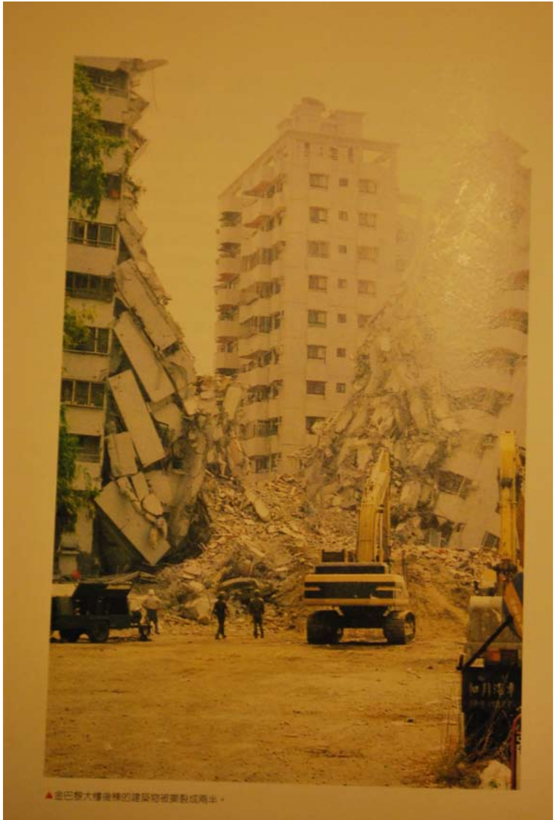
照6-2-4 本市金巴黎大樓在九二一地震中倒塌。