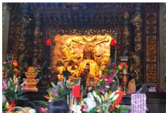
照6-3-4 本市福興宮媽祖

大致而言，經過宋代以後種種文獻的流傳，大眾普遍接受的媽祖生平及家世為媽祖生於宋太祖建國之年建隆元年，卒於雍熙四年之說，即《天妃顯聖錄》所載之說法為流通最廣之說。名曰林默娘，為林愿之女。諸書皆載媽祖降生月日在3月23日，並為朝廷採用以此日為祭日，為明代以後公定日期。媽祖飛昇的說法亦要到明代才出現，大約在明代十多種公私文獻中，大月有4種說法，其中僅2月19日在春天，其他皆在秋天，可能與秋冬出航，祈求平安有關。其中流通最廣者為9月9日，則與登高飛昇有關，其他各日或許與其他神佛誕辰重疊，為避免祭祀上的困擾而未採用。 43 上述有關媽祖信仰的種種演變，形成今日媽祖信仰基本面貌。本市新里里福興宮、金城里金城宮、東昇里新興宮、新仁里奉聖宮、瑞城里瑞和宮、仁化里振坤宮、西湖里慈天宮、健民里佑福宮等主祀之。