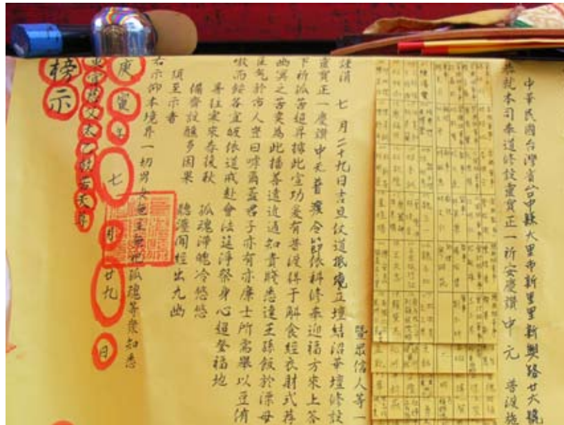
照6-4-7 七將軍廟中元普渡的榜示。