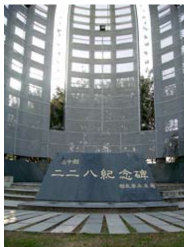
（左圖）二二八紀念碑

該里休閒活動空間有「永隆六街壘球場」。永隆里擁有兩座壘球場，面積將近6,000坪，壘球場除了舉辦比賽之外，也提供給學生及民眾運動使用。除此之外，壘球場周圍的環境綠化和空間規劃，都提供給里民一個休閒、活動的好去處。「國光公園」環境舒適、優美的國光公園，由里長和里民志工一起認養清掃和維護。街道整潔、標示牌以及遊樂設施都讓國光公園看起來更有質感和美感。「二二八紀念碑」設立，是臺中縣政府為了紀念受難者，特在大里市國光公園設立「二二八紀念碑」，並以和平鴿為主題，既是地標也是藝術品。該里的環保志工隊成立不久，除了資源回收的工作之外，位於永隆七街停車場以及國光公園也是志工服務隊認養的環境清潔區域。