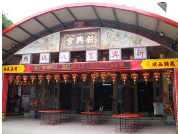
(上圖) 新興宮八媽廟是大里市歷史第二悠久之廟宇

望相助隊，主要工作為協助警方維護治安，於東昇橋、南門橋、十九甲處設置點，防止飆車橫行，帶給地方安居環境，使犯罪率下降；也配合地方上節慶，維持交通順暢，巡邏時加強獨居老人之探視。該里的休閒活動設有「金吉利高爾夫練習場」供民眾之用，因東昇里以農業與工業為主，休閒設施較少，此高爾夫球場提供了當地里民一處運動休閒好去處。在宗教信仰與民風上，建於清光緒十六年(1890)三月的新興宮八媽廟，主神為天上聖母，為大里市歷史第二悠久之廟宇。管轄範圍涵蓋內新里、西榮里、長榮里、中興里、日新里及東昇里。每年逢安太歲的日子，來自各方信徒約有10,000人，絡繹不絕，香火鼎盛。