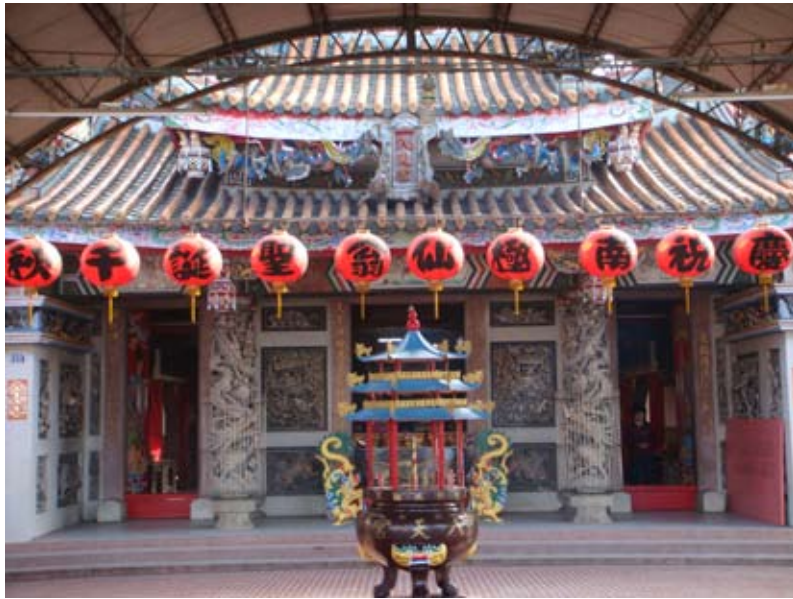
莊嚴寧靜的八天宮