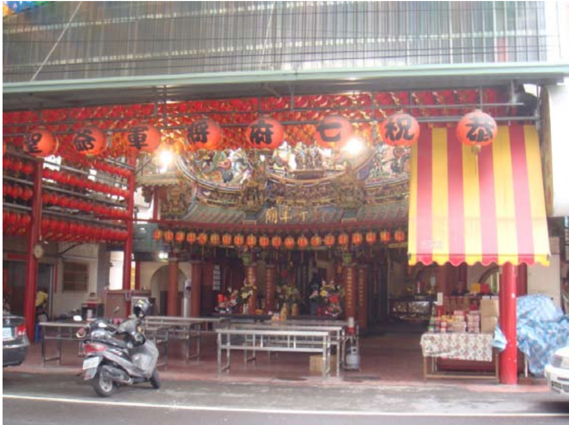
(上圖) 七將軍廟，早期是鄉民老人小孩坐在廟前聆聽說書休閒的好地方

們。該里有環保公園、爽文公園、進士公園等休閒社區，供民眾休閒娛樂之最佳去處。該里的大里涼傘樹肉圓位於大里市公所對面，下午開始就有許美食饕客前來排隊品嚐，絞肉加上筍塊，皮Q餡香，是該里的特產。