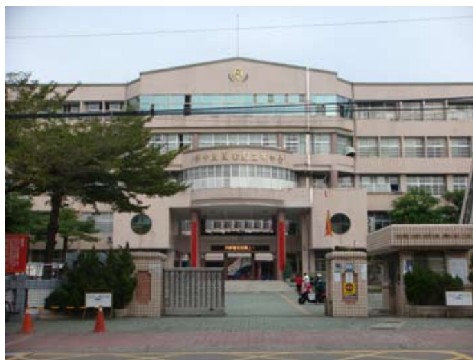
（上圖）座落在西榮路上的光榮國中

在民風與信仰上，該里與東昇、日新、內新、中興及長榮等6里共同祭祀新興宮（八媽廟）的媽祖，爐主亦由六里輪流擔任，十八庄迎媽祖是在農曆三月初九，與上述各里均同一天。