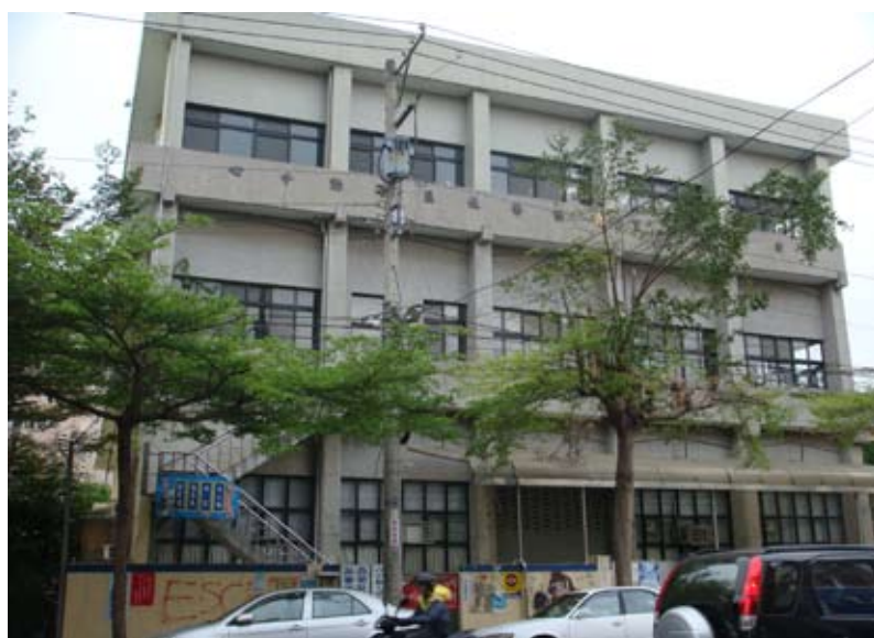
（下圖）與光榮國中為鄰的西榮社區活動中心（樓上） 市立西榮托兒所（樓下）