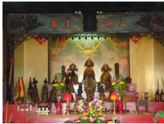
祭祀三府王爺的福田宮