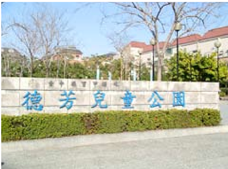
(上圖) 德芳兒童公園