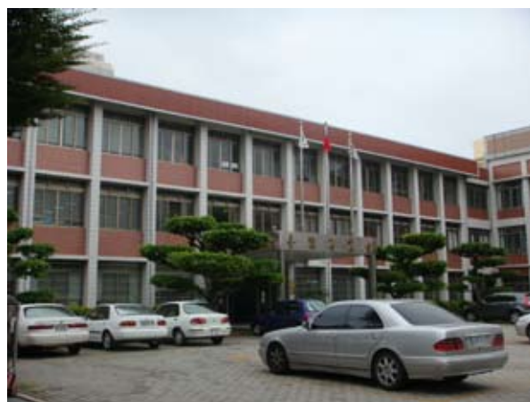
(上二圖) 臺灣省農會一瞥