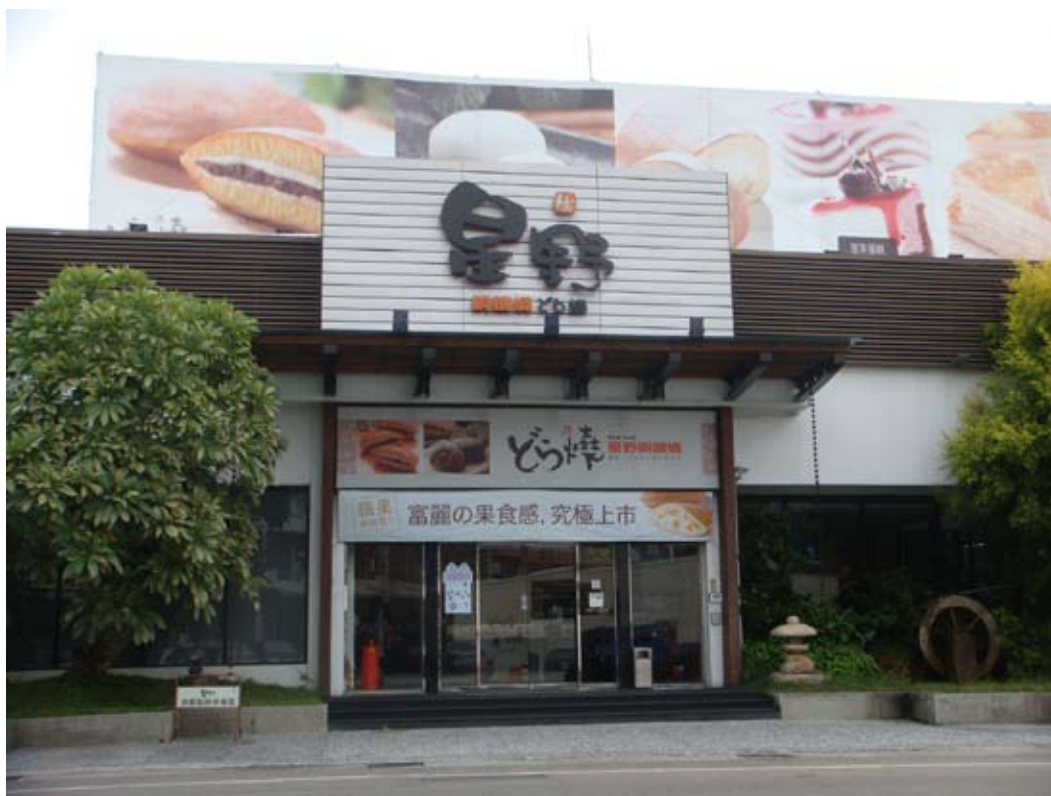
(上圖) 大里星野銅鑼燒店

「星野」銅鑼燒旗艦店，位在國光里德芳南路上，「星野」使用日本及臺灣嚴選食材，搭配不同口味的鮮奶油內餡，美味可口，是該地吸引觀光遊客到此品味的特產。