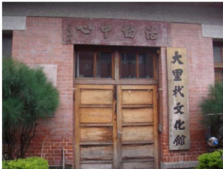
(上圖) 大里杙文化館、活動中心

老街風情在該里展現無遺。「慶源堂」因位居水運要衝，清朝極盛時期，繁華的大里杙老街，街上發展了各式各樣的客棧、染坊、油行、商店等商業行爲，商家透過細長的街屋在此經商發展，「慶源堂」便是當地產業文化的代表。「慶源堂」位於大里街，乃清季首富林秋金之店舖與住宅，磚牆雕刻，極富古樸之美，它也是現今大里杙老街中保存最爲完整的建築。大里杙老街清朝中末葉，拜貓羅溪的舟楫之便，使大里躍居彰化縣城以北的重要商埠，大里老街的紅磚外牆，古樸顏色中泛出歷史的痕跡；亭仔腳式騎樓又爲清代中末期傳統街屋的見證，極具保存價值，也因此大里市公所極爲重視老街的保存與重建。「大里杙碼頭」於清雍正二年(1724)漢人入墾大里杙，沿著大肚溪溯溪而上，到了現今烏日鄉五光村一帶時，因河水淤淺，要改搭竹筏進入大里杙，到大里杙街尾時連竹筏也無法再往前進，於是駐足停泊，並將竹筏的繩索繫在小木樁上，昔日舊碼頭的所在地，就在福興宮媽祖廟前的大里街盡頭。