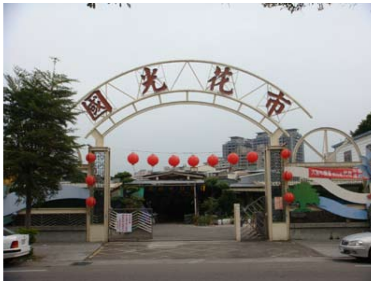
(上圖) 大里國光花市

在休閒活動設施方面，該里因地理位置之便，集人文、教育、醫療、觀光於一身，交通便利，公共設施完善，是全方位的里。「大里市運動公園」自完工以來，由於空間規劃及設施完善，成為鄰近地區民眾晨昏假日前往運動休憩的主要場所，公園內有運動場、兒童遊戲場、溜冰場、戲水區、籃球場、網球場等多項設施，為大里的民眾帶來運動休憩的好去處。大里國光花市成立於民國七十三年(1984)，佔地約2,400坪的面積規劃，提供參觀者一個舒適的購物空間。在假日休閒的日子，到大里國光花市享受一下綠意盎然、百花齊放的園藝世界。「兒童藝術館」亦是一個別具藝術及特色的地點。