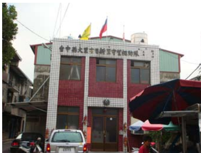
(上圖) 日新活動中心

在社區活動方面，設有日新社區活動中心，配合社區發展工作於民國八十三年(1994)成立日新社區發展協會，發展協會下設有各團體組織，如環 保義工隊、守望相助隊、長壽俱樂部、土風舞班、太極氣功隊、媽媽教室、 愛心慈善會。居民的社區活動區有日新社區公園，位於日新路旁，公園設有 小朋友遊戲區、溜冰場、涼亭及健康步道，供民眾使用。