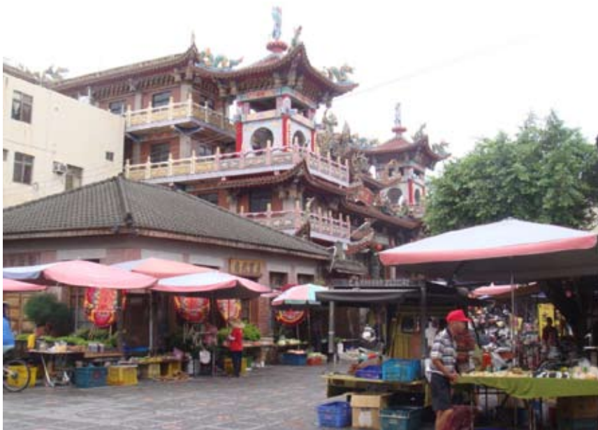
(上圖) 大里杙站、福興宮市集