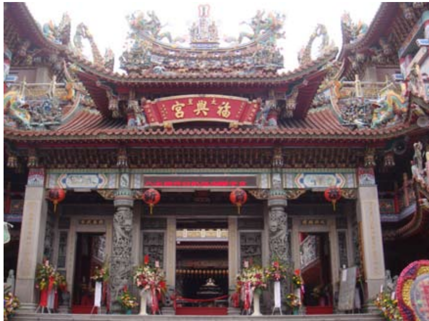
(上圖) 福興宮是人民心中的守護神