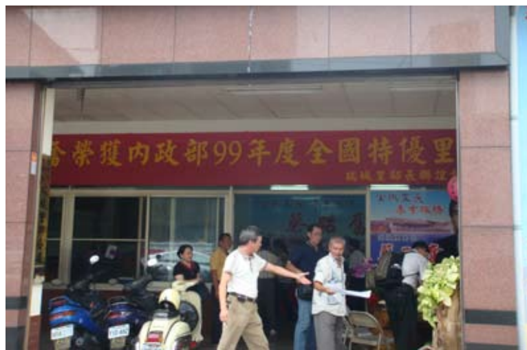
(上圖) 瑞城里榮獲99年度特優里

該里的繁榮開始是在三泰五金行正對面住宅區蓋起來後，才帶動瑞城里的逐漸繁榮發展。婦女們在晚上可以到樹下跳土風舞或休閒。該里無教會、無名人、無市場，村民以農業為生，種花生，擠花生油，自己來食用，若向外販賣，花生油一斤200元。後代也都往臺中市區去發展較多，而外地進來賺錢者占90%的大比例，相當純樸的社區。本里於民國九十九年度獲頒內政部全國特優里的殊榮。