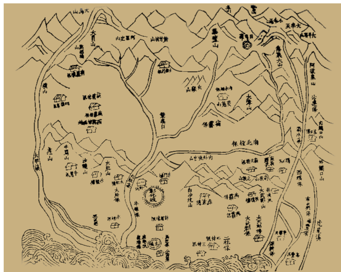
道光年間彰化縣圖