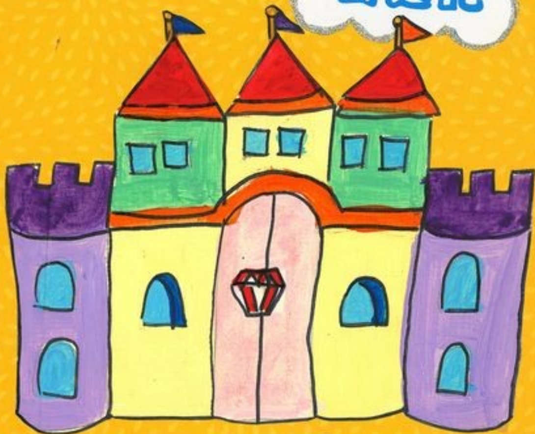
圖 / 文 陳子榕