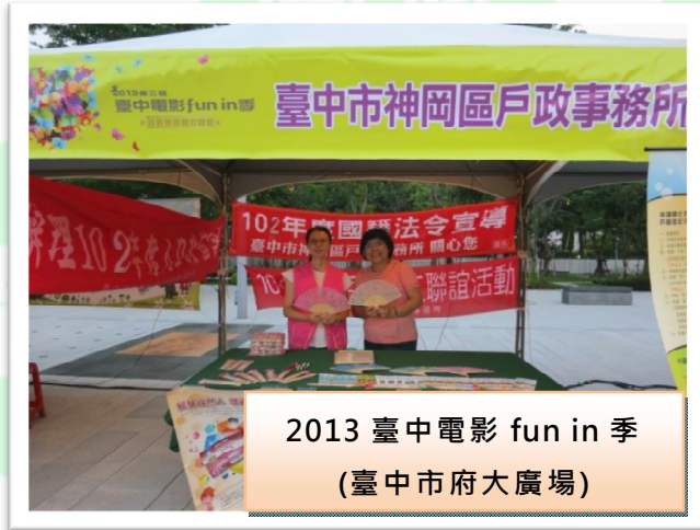
2013 臺中電影 fun in 季 (臺中市政府大廣場)