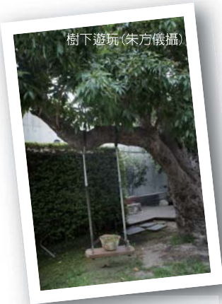
樹下游玩