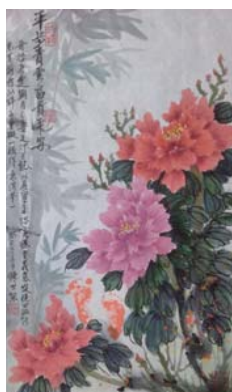
平步青雲水墨畫：作者在外孫彌月時，以外孫足印來作畫，以竹子代表【平步青雲】和牡丹花代表【富貴平安】，來祝福外孫平安長大、展望未來、踏實穩重、才氣縱橫、鵬程萬里、前程似錦、了無遺憾、頭角崢嶸。