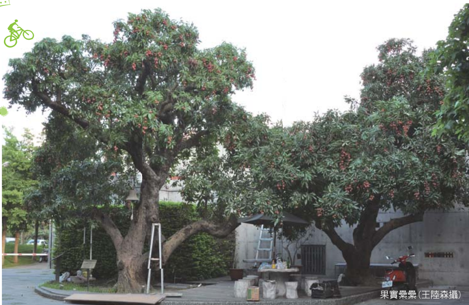
果實纍纍