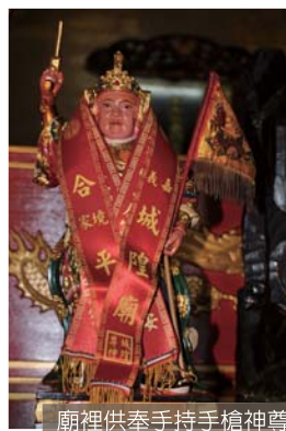
廟裡供奉手持手槍神尊

之襲擊，日軍被擊斃5名，後回葫蘆墩本隊請求援軍，於是日本大軍與義民決戰於「頭家厝」及「舊社溝背」地區，雖經奮力抗敵，最後因火力懸殊，義軍陣亡者約百名，而日軍戰死也有20餘名。此戰役日本稱為「頭家厝戰役」，而臺灣文獻則稱「溝背之役」。這是一段先民保鄉衛國的歷史，也是見證在地歷史的最佳廟宇。廟中有尊高約1尺左右的遊香神尊，身穿明朝官服及戰盔，右手拿龍形三角黃旗，左手持左輪手槍，造型非常特別，值得前來一看究竟。