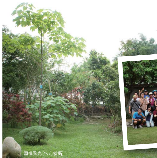
園裡風光