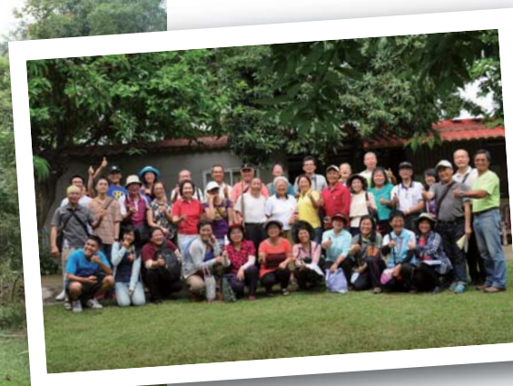
於怡藝園裡團照