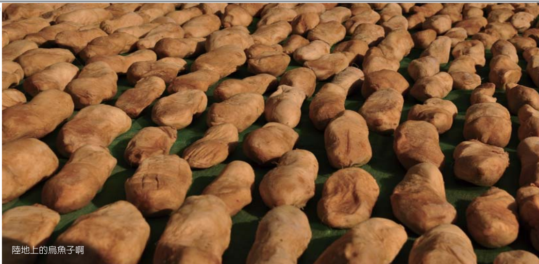
陸地上的烏魚子啊