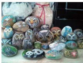
頑石成金：一顆顆不起眼的石頭，經由作者的妙手巧思，幻化成貓頭鷹及貓熊造型的石頭彩繪，纖毫畢露、栩栩如生，筆觸細膩清晰，功力之精湛令人讚嘆！