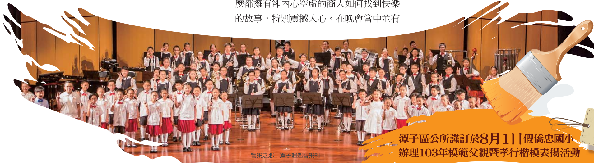
管樂之鄉 潭子逍遙音樂町

機會抽中市價高達2萬5,000元之長笛高級精美禮品，臺中市長胡志強、潭子區長簡文祥邀請您闔家蒞臨觀賞。