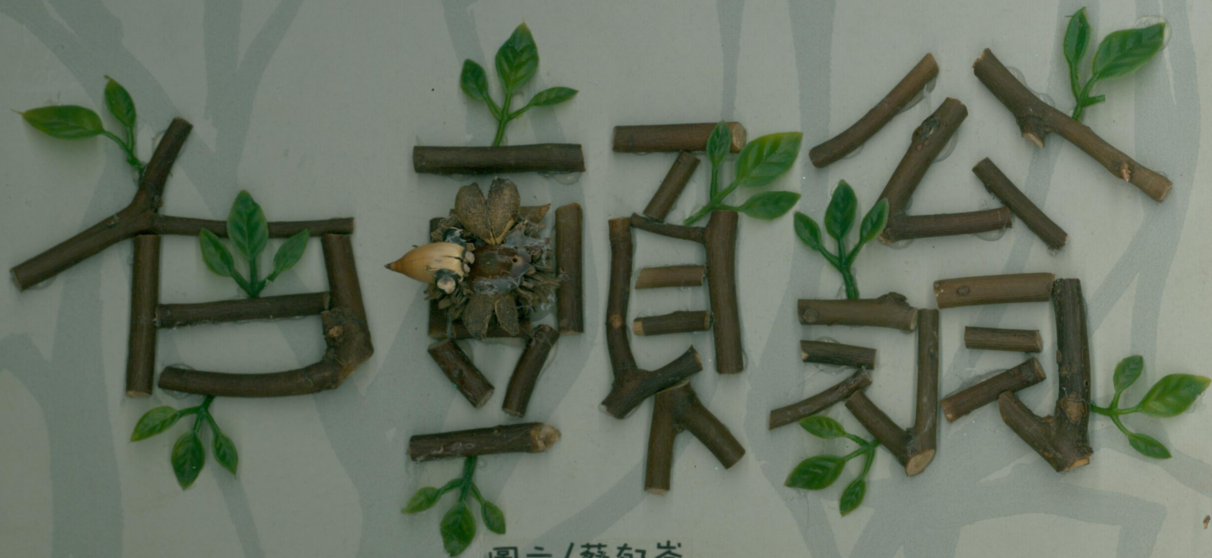
圖文 / 蔡郁岑