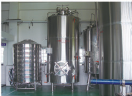
合法業者產製場所 (產製環境符合衛生標準)