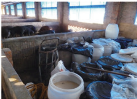
非法製酒業者產製場所 (產製環境簡陋衛生不佳)