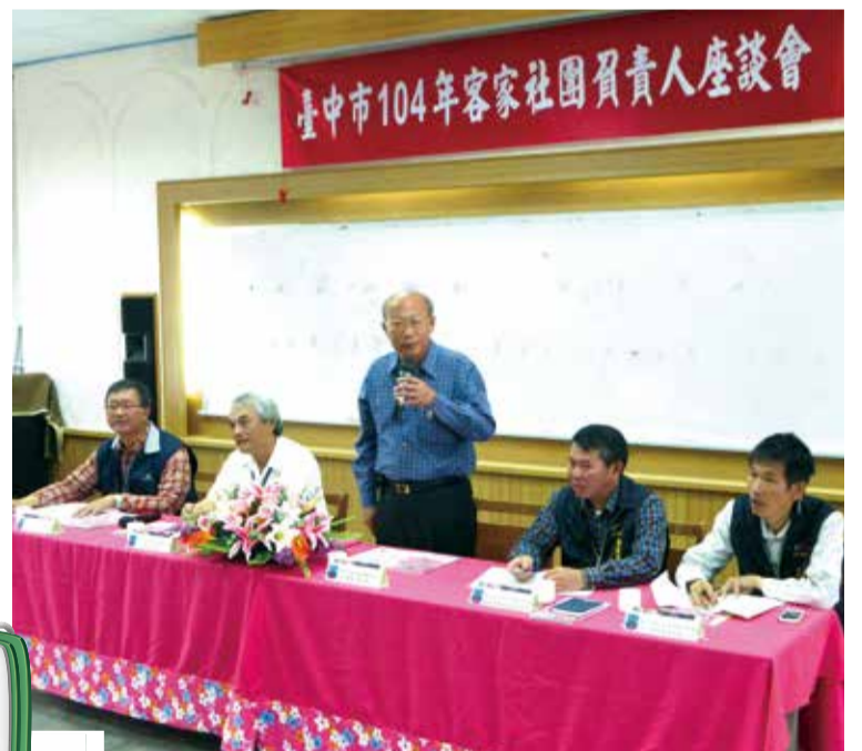
▲主委劉宏基於座談會中致詞鼓勵

此次座談會有關社團在補助經費方面之提案，劉主委表示，將努力爭取預算，並放寬對社團辦理推展客家學術文化活動之補助，希望各社團能多加支持並參與客家文化活動的推廣，共同發揚客家文化。