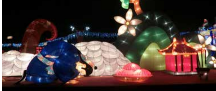
▲主題花燈—做板謝神·鯉魚伯公