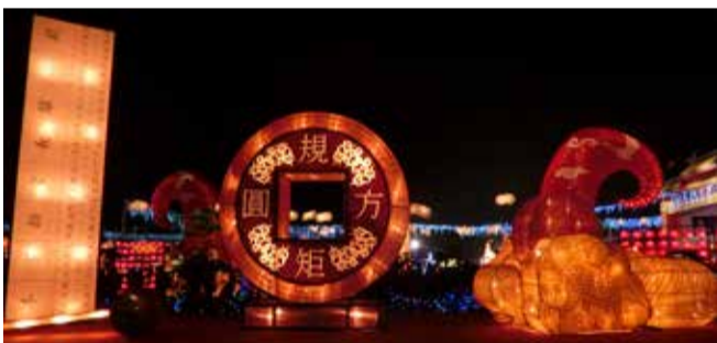
▲主題花燈—匠寮文化·巧聖仙師