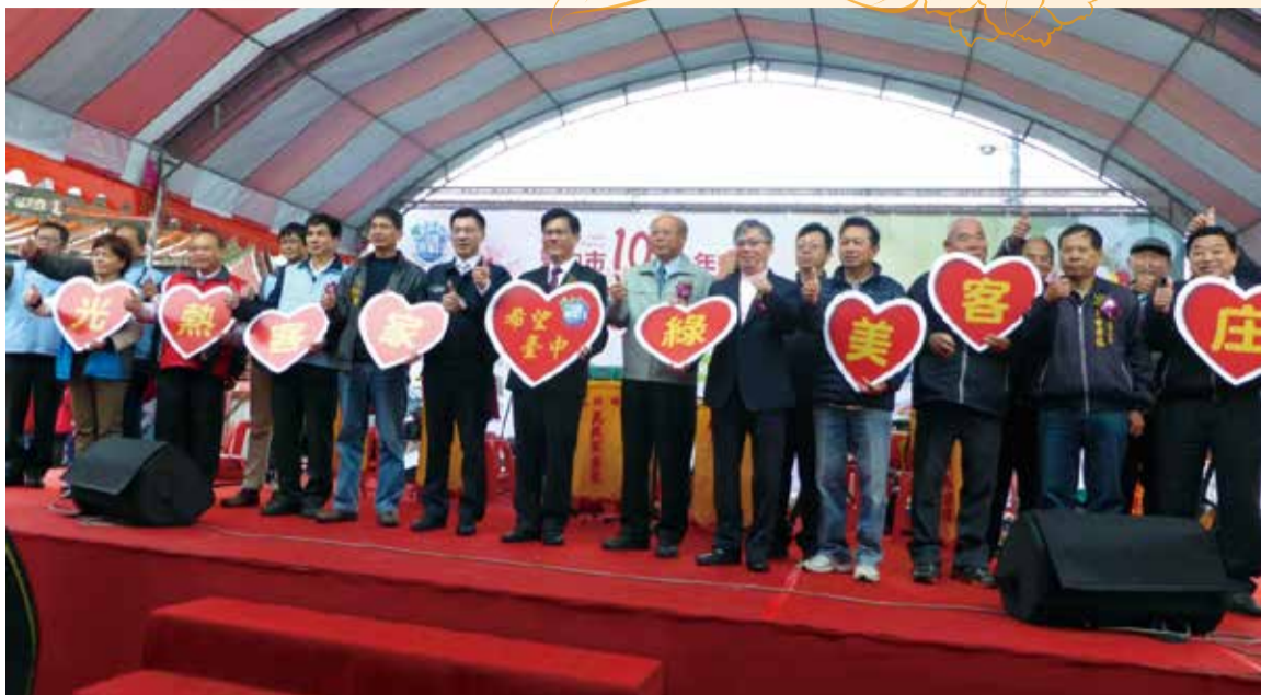
▲市長林佳龍、行政院中部辦公室副執行長施威全及臺中市政府客家事務委員會主委劉宏基等貴賓共同為「臺中市104年全國客家日」活動開幕。

此次活動邀請客庄在地具有客家特色的藝文表演團隊及客庄學校學童，以音樂及舞蹈表演呈現一場客家天穿音樂饗宴，萬興國樂團帶來天公落水、桃花開及客家本色等膾炙人口的客家國樂演奏；土牛國小同學們帶來