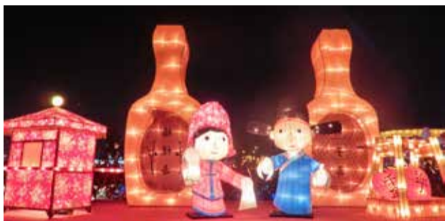
▲主題花燈—客家婚俗·喜慶嫁娶

文化，並結合油桐樹、紙傘、花布、斗笠等客家特色，呈現客家生活的多樣化，獨特且精緻的客家風情。