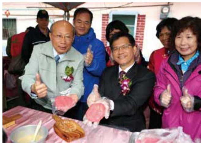
▲市長林佳龍及臺中市政府客家事務委員會主委劉宏基共同DIY體驗客家板

精彩的「看花」客家相聲表演；活潑可愛的石岡國小及豐原幼兒園小朋友們神采奕奕、充滿熱情活力的在舞臺上又蹦又跳地賣力演出；木棉花合唱團抒情合唱「頭擺个你」，現場觀眾聽得如癡如醉。