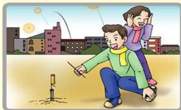
飛行類玩具煙火須先固定妥當，並應對空垂直發射