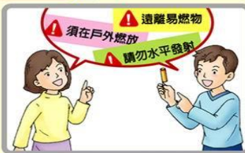
須遵照標示中的使用方法