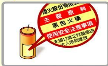
須購買標示清楚的產品