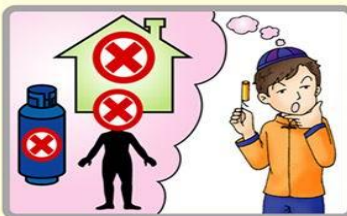
不可對人、建物、易燃物發射