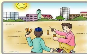
須在空曠地方發射