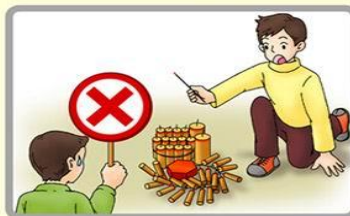
不可同時大量燃放

檢舉違章爆竹煙火業經查獲屬實者，發給一萬元以上，五十萬元以下獎金。 檢舉專線：內政部消防署(02)2388-2119轉9或撥119向當地消防機關檢舉。