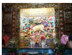
緊臨仁愛路的嘉仁里福德祠，頗能吸引路人目光。主殿雕工細緻，金碧輝煌，神威顯赫。