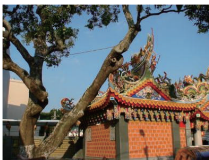
在廟正後方有一棵百年老芒果樹