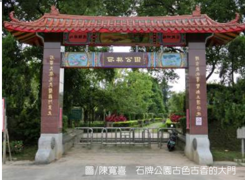
石牌公園古色古香的大門