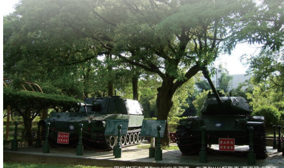
黑板樹下左邊為M108自走砲車，右邊為M41輕戰車(華克猛犬戰車)

退役的「M41(華克猛犬)戰車」，在石牌公園中，化身為公園藝術品，在一進公園大門即可見到其英姿！雖因長年放置戶外風吹、日曬及雨淋，使得這些威武軍備顯得疲憊滄桑；但同時也可讓民眾能夠看到這部光榮退役的戰車，完整的保存並具有歷史性的回憶，許多的遊客到石牌公園，都會被它們所吸引，因而駐足拍照留念。