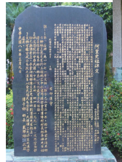
民國80年3月9日重整後的阿里史碑文