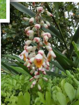
月桃開花顛倒吊 圖/陳寬喜