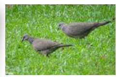
晨昏常見斑鳩及黑冠麻鷺地面覓食