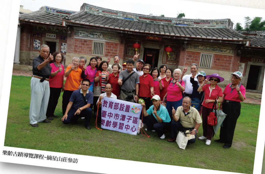
樂齡古蹟導覽課程-摘星山莊參訪