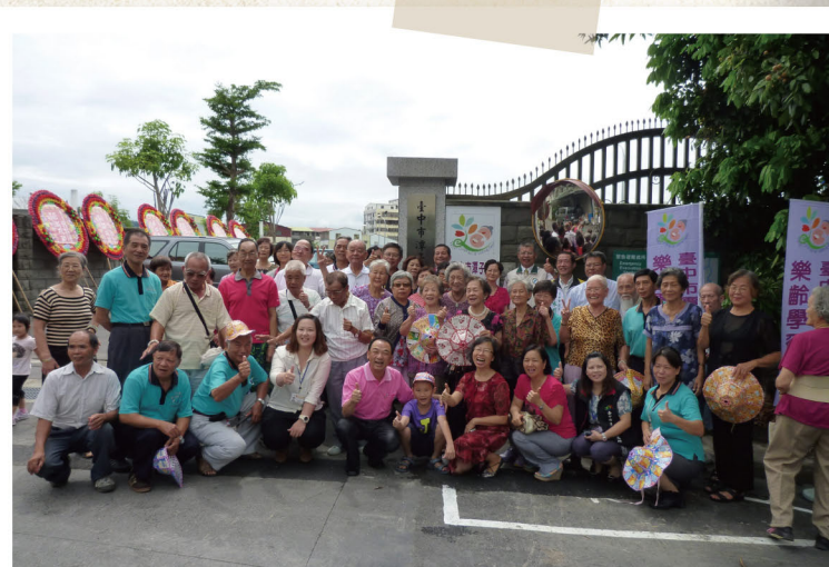
簡區長主持樂齡中心揭幕合照

中心設立的願景是「健康~快樂~大家藝起來-潭仔墘風華再現」，期使中高齡長者能多元學習，並結合社會資源，增進他們社會參與，共創樂齡文化，樂齡學習中心歡迎大家一起來參與。