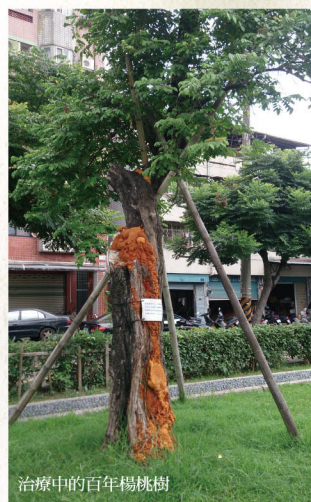
治療中的百年楊桃樹