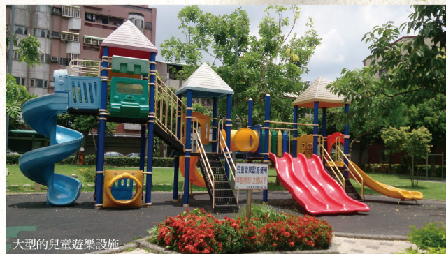
大型的兒童遊樂設施

此外，公園位於頭家菜市場及超商的附近，常為小孩休閒娛樂或大人聚會聊天休閒的好地方。公園內有一棵原位於雙張和泰堂，因改建才移植到頭家公園的百年楊桃樹，目前它正接受藥物的治療，需要大家小心呵護，請不要隨便去觸摸喔。