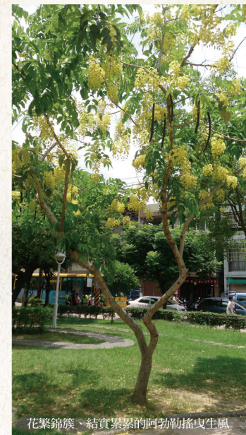
花繁錦簇、結實累累的阿勃勒搖曳生風