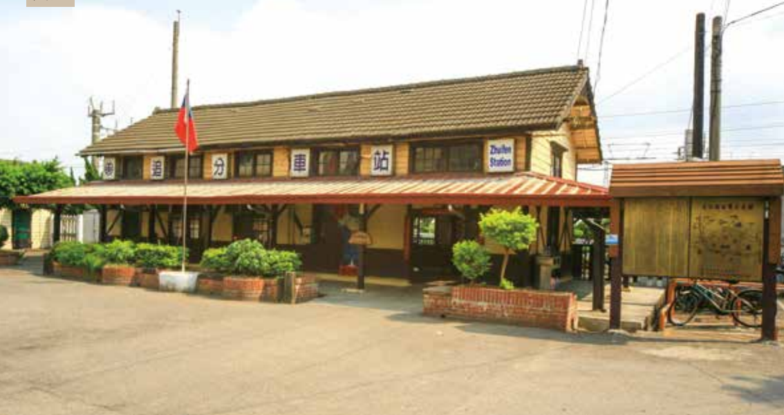
市古蹟縱貫鐵路（海線）—追分車站