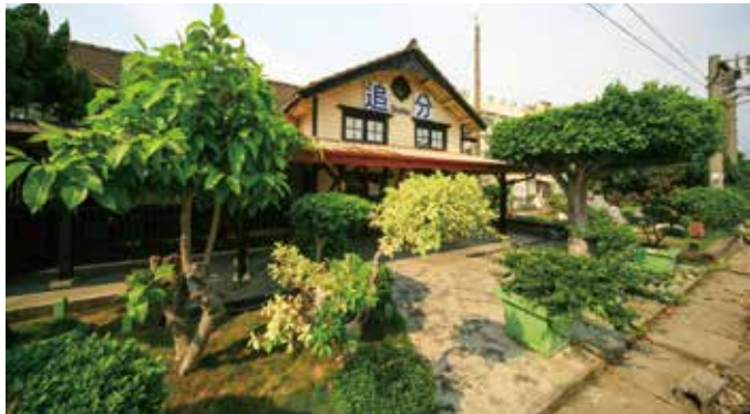
面向鐵道的山牆以牛眼窗為開口型式

今鐵路電氣化時代，車票改為電腦印製，但車站內仍發售著民國五、六十年間印製的舊式硬質紀念車票，同時也保留著許多從建站至今持續使用的路文物（票櫃、儲票櫃、資料櫃、鑰匙保管箱、閉塞器、新聞剪報、無線電、閉塞路牌及舊卡式車票等），這些文物也與古蹟建築一同訴說著車站的營運歷史，歡迎大家一起來追分。