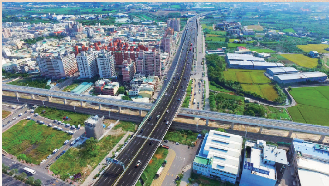
四通八達-台74線快速道路