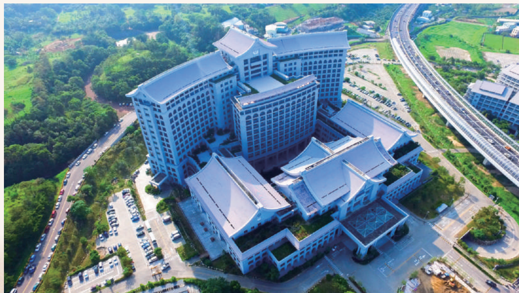
守護潭子健康-慈濟醫院