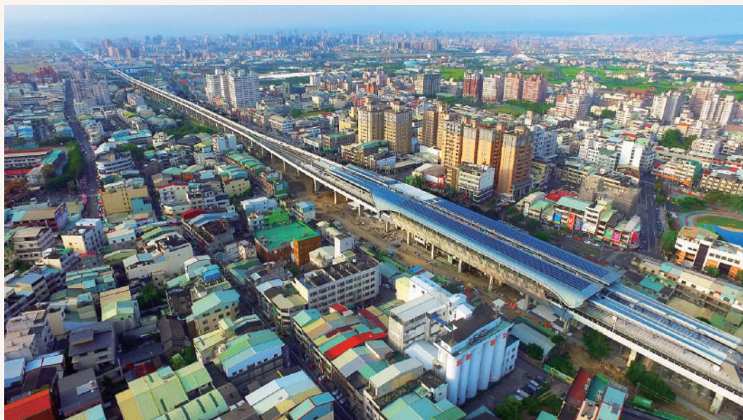
鐵路高架化-潭子火車站