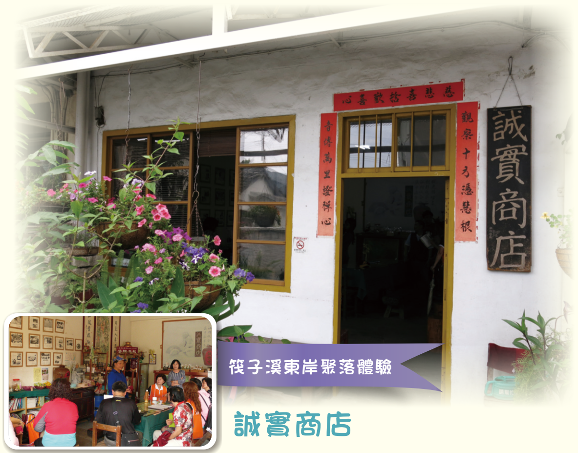
筏子溪東岸聚落體驗