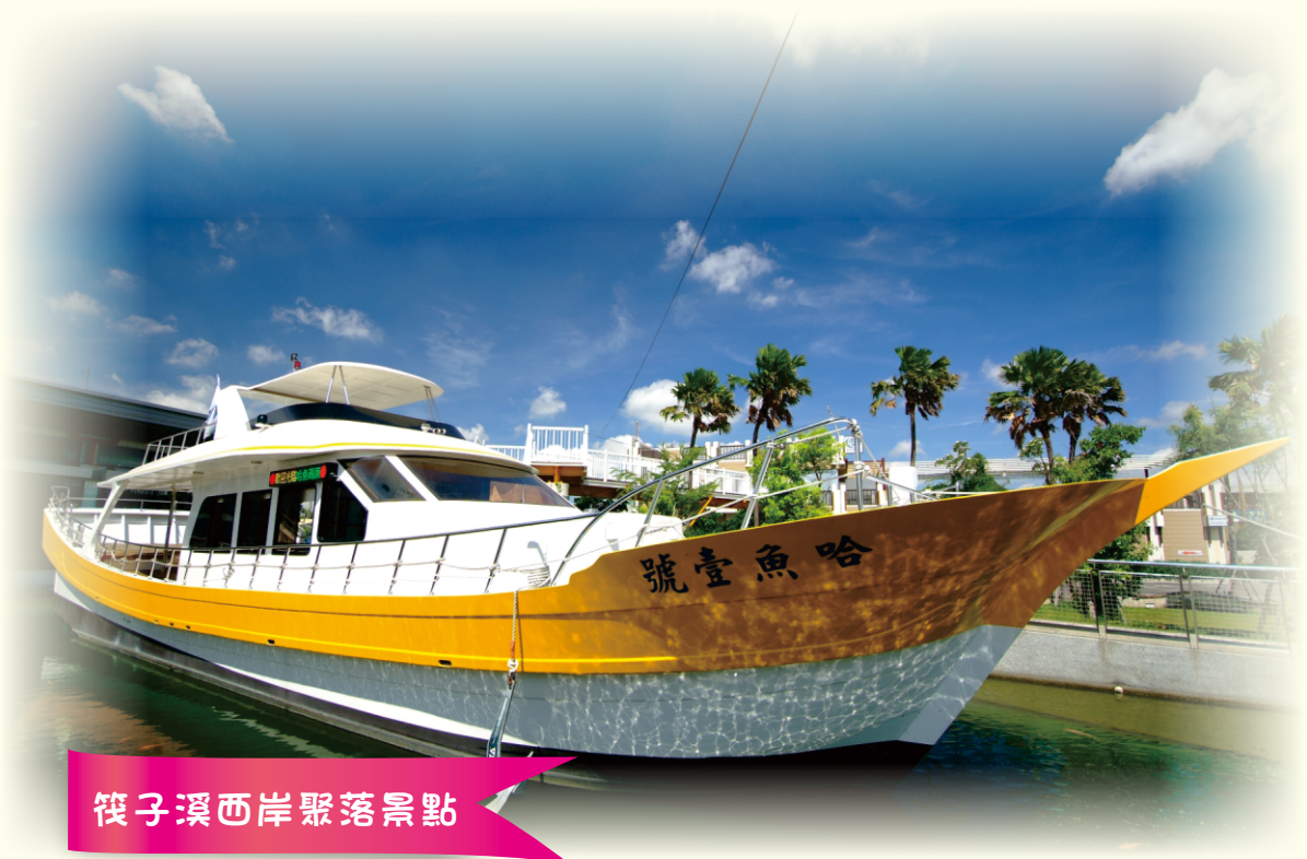
筏子溪西岸聚落景點