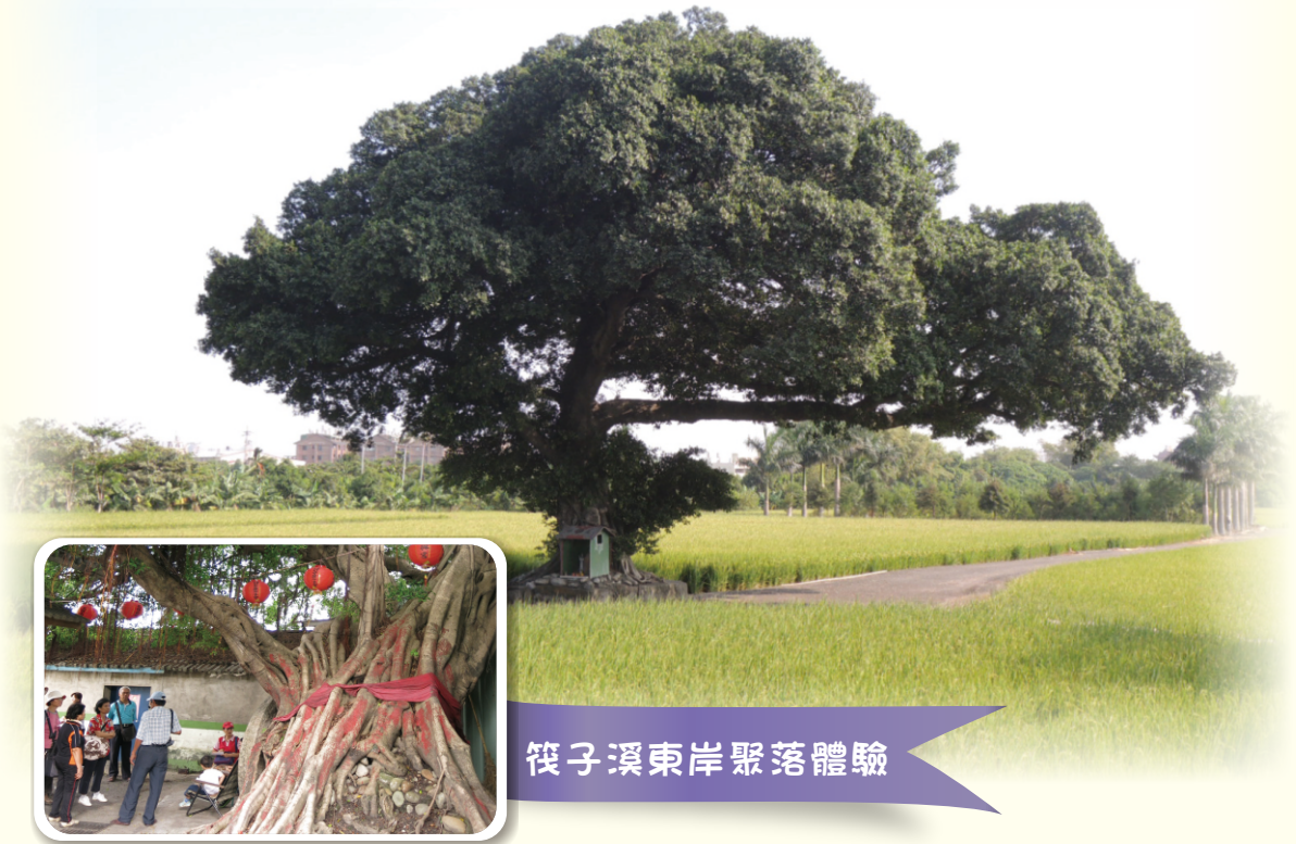
筏子溪東岸聚落體驗