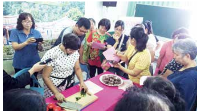
▲學員們專心地記錄老師的講解，怕稍微閃神就錯過重要的細節。

本會主委表示，「君子遠庖廚」的傳統觀念已不適用現今社會，本次研習班有5位先生陪同太太一同報名參與，他們一致認為參加此次研習活動不僅可以學得客家美食、培養共同興趣及增進夫妻之間的感情，收穫滿滿。