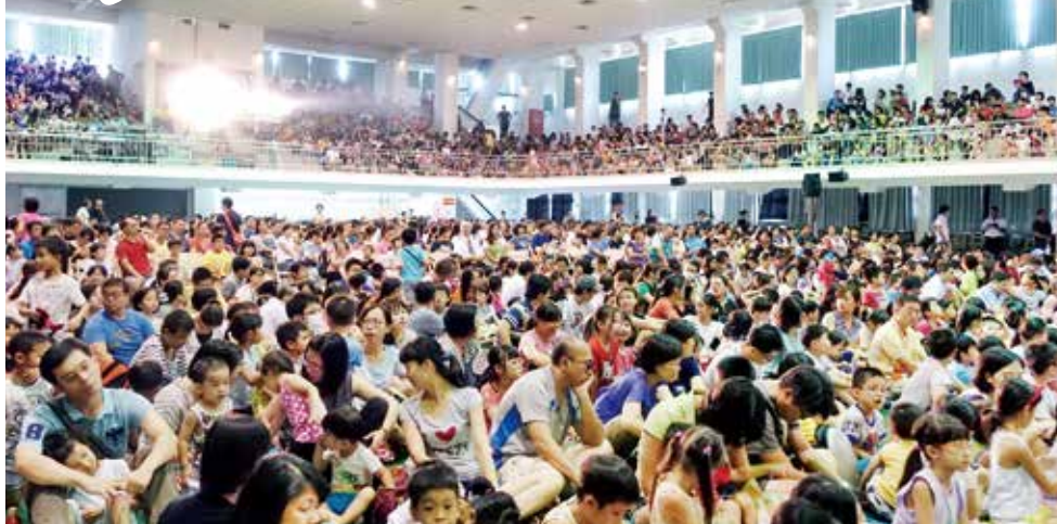
▲市民參與客家童話音樂劇非常踴躍，現場座無虛席。

元素，以客家歌謠、歌舞、真人與布偶互動方式呈現客家重要傳統節日—天穿日，藉由國、客語穿插演出音樂劇的形式，展現客家文化風貌，並藉此傳達愛惜地球環境的理念，是齣寓教於樂、具啟發性的兒童音樂劇；盼讓孩童及青年於音樂劇中認識與接觸客家語言、文化，看見不一樣的客家樣貌。