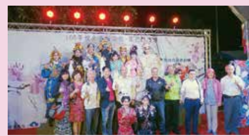
▲本會主委與會來賓及表演團員大合照

此次「文和傳奇戲劇團」演出的內容包含：三仙賀壽、糶酒+奉茶及灌口二郎神等。隨著演出劇情的起伏跌宕，臺前觀眾看戲時，表情時而專注，時而笑聲連連，展現了客家戲曲擄獲人心的獨特魅力，也讓市民度過多采多姿的客家戲曲文化之夜。