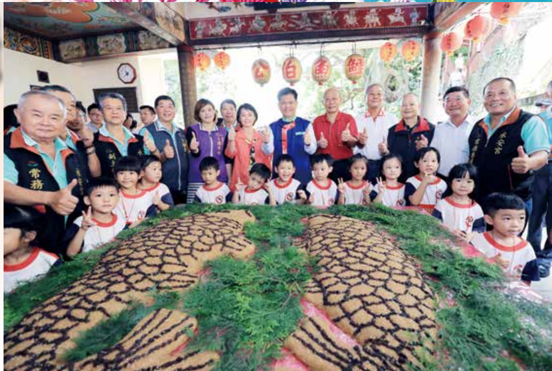
▲總重108斤雄、雌鯉魚造型米糕。

迎接「鯉魚伯公文化祭」到來，客委會製作36斤雄鯉魚、72斤雌鯉魚的造型米糕，總計108斤象徵108星君，代表昔日先民出海、入山靠觀星指引回家，活動當日民眾開心品嚐，大讚好吃。副市長林陵三也前往參加「鯉魚伯公文化祭中秋晚會」，與民眾共賞五洲園掌中劇團演繹鯉魚伯公的傳奇故事。