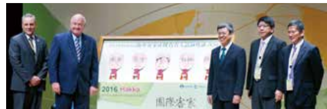
▲吸引海外人士共襄盛舉蒞臨本會

力。除了會議以外，18日下午展開客語沉浸式教學觀摩參訪與首次舉辦的客語合唱觀摩賽，19日更帶著與會貴賓來一場屏東客庄巡禮，讓海外鄉親親身走訪品味南臺灣原汁原味的客庄風情。