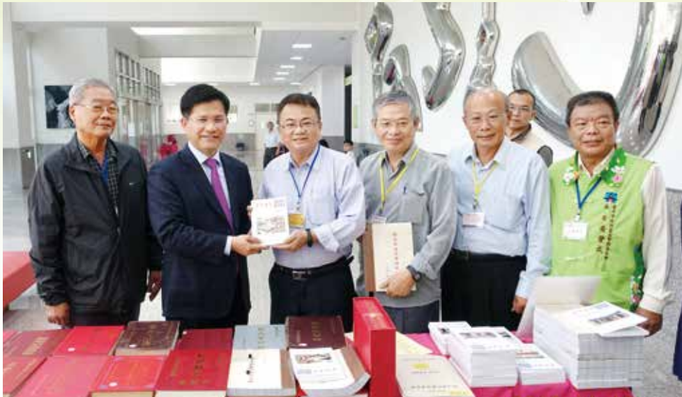
▲臺灣省姓氏學會致贈《閩臺的姓氏族譜與宗族》與《臺灣源流》予市長

二天的綜合交流座談會中，專家學者與與會民衆針對客家議題討論熱烈，激盪出不同的學術火花。本會主委表示，藉此學術研討會提升臺中客家文化的能見度，擴展本市乃至其他國家推動客家事務之方向，更盼中部客家和全球客家學術文化接軌。