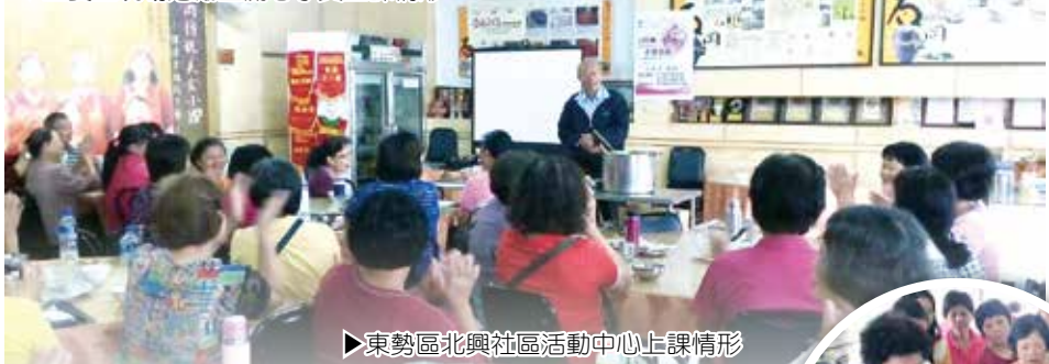
▶東勢區北興社區活動中心上課情形