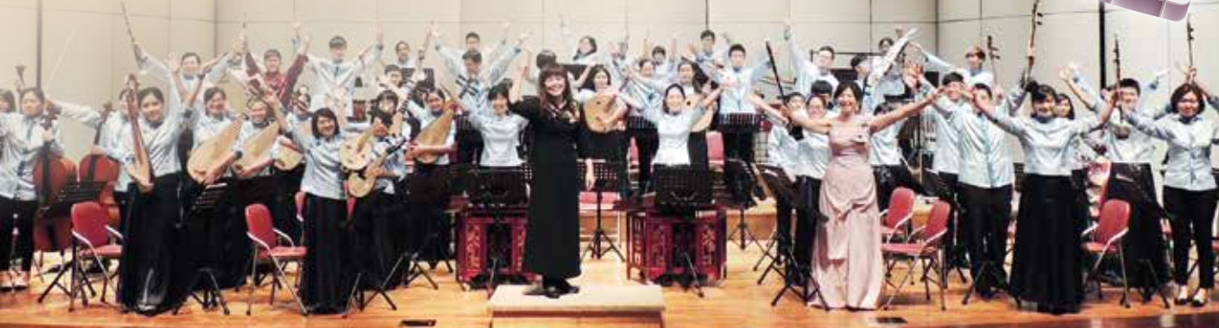
▼港區藝術中心演藝廳演出