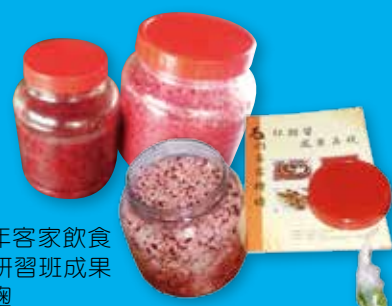
▶105年客家飲食文化研習班成果—紅麩