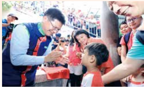
▲林市長幫幼童佩戴神荼

臺中市政府去年起舉辦「鯉魚伯公文化祭」發揚客家文化，林市長於9月11日前往東勢「鯉魚伯公廟」（永安宮）向鯉魚伯公上香，於廟旁的「石母祠」恭祝石母娘娘誕辰，並替孩子戴上「神荼」，象徵作為石母娘娘的「契子女」，保佑孩子健康長大至成年。最後眾人為敬獻的「護土祐民」匾額揭牌，表彰鯉魚伯公神麻顯赫。