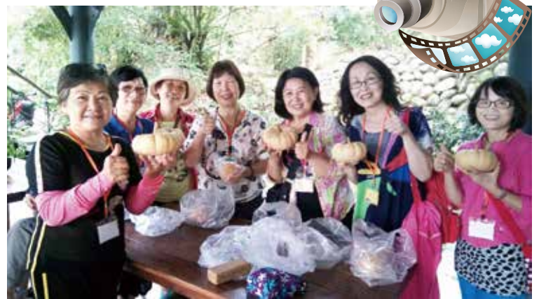
▲民衆踴躍購買在地農特產品

認同與讚許，活動第二梯次更有高齡80歲阿婆報名參加，透過客家文創商品手作DIY體驗，回憶過去，彷彿回到童年時光，同時，深入客庄體驗採果樂趣，放鬆心情，享受悠閒時光，進而提升客庄旅遊附加價值，活絡客庄產業經濟。