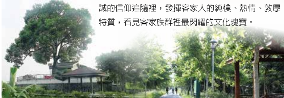
▲紅圳頭義民祠建立在土丘之上

時至今日，地方信士響應無數，義民信仰的活動規模愈來愈大，全臺客家族群聚集的所在，常能看見「義民廟」、「忠義亭」、「褒忠亭」等信仰中心，並辦理祀點活動。每逢農曆七月的義民節，是客家族群所舉辦最具代表性的活動，內容包括：神豬、神羊比賽、豎立燈篙、燃放水燈……等活動，在遵循傳統古典的程序中，除了傳承客家忠義思想與精神，同時也在虔誠的信仰追隨裡，發揮客家人的純樸、熱情、敦厚特質，看見客家族群裡最閃耀的文化瑰寶。