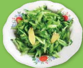
▲105年客家飲食文化研習班成果—嗆菜