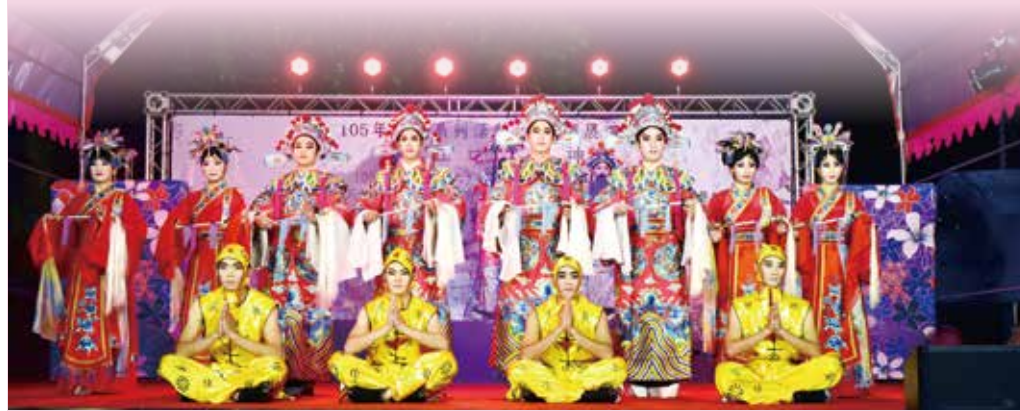
▲文和傳奇戲劇團演出三仙賀壽