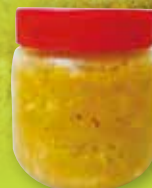
▲105年客家飲食文化研習班成果－泡菜