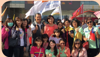
雙十國慶升旗典禮

※新住民(國人配偶)在臺居留連續3年中不斷(每年有183日以上合法居留)，即可申請歸化我國國籍，別讓您的權益受損了。 ※外籍人士取得基本語言能力認定，本所開辦歸化測試隨到隨考服務，親洽本所贈送題庫，助您考試輕鬆過關，歡迎多加利用。(非本區亦可報考喔!) ※外來人士在臺生活諮詢服務熱線0800-024-111，歡迎在臺之外國人及新住民多加利用～ 【國語、英語、日語、越南語、印尼語、泰語及柬埔寨語攏ㄟ通】