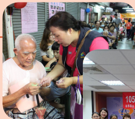
慶中秋戶政業務宣導

※ 指定送達地址：申請人以國內之住居所、事務所、營業所或就業處所的門牌地址擇一指定。 ※ 得向任一戶所臨櫃申辦或以自然人憑證於內政部全球資訊網站申請。