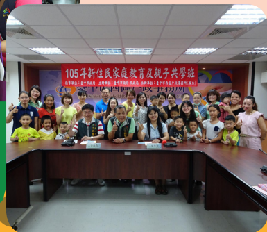
新住民家庭教育及親子共學班