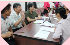
服務禮儀講座 分組討論