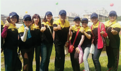
臺中市政府運動會