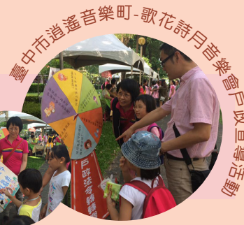
臺中市逍遙音樂町-歌花詩月音樂會戶政宣導活動