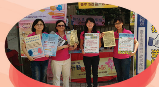
逍遙音樂町-東協廣場 南洋文化戶政宣導