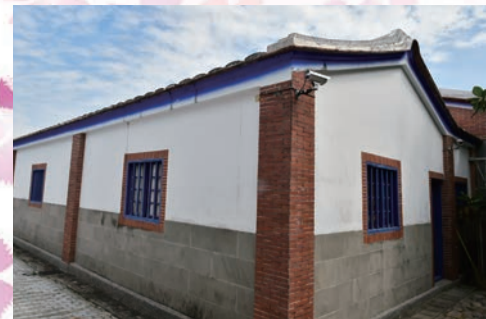
▲傳統客家白牆式建築