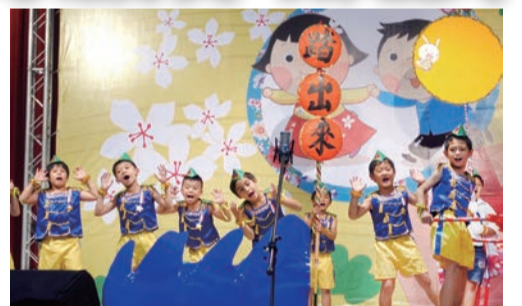
▲手舞足蹈小朋友賣力演唱

為讓國中小及幼兒園學童認識客家、落實客語之傳承及深耕客家文化，本會於105年11月19日（星期六）在陽明市政大樓五樓大禮堂舉行客家歌謠比賽，讓參賽孩童透過客家歌謠演唱，對客家文化有更多樣化的認識及認同。