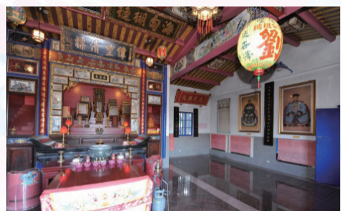
▲正廳供奉土地龍神及先祖

「夥房」（桃、竹、苗稱為「伙房」，臺中地區、屏東地區亦稱為「夥房」）指同一家族居住的合院建築，家人共灶同火，集合一處的居所。夥房特色是以身體為建築概念，正中央「正身」為中心，與左右延伸而出的橫屋。廂房嚴格遵照輩份尊卑安排，講究長幼有序的传统家規。這種圍繞方型的合院建築，正是客家社會和家庭體制的展現。