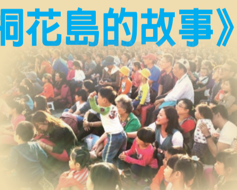
▲ 觀賞人潮擠滿東勢客家文化園區

《桐花島的故事》融合客家傳統元素，以客家歌謠、舞蹈、真人與布偶互動方式呈現客家重要傳統節日一天穿