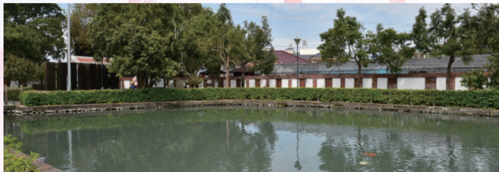
▲夥房半月池象徵有水斯有財的意涵

夥房門前的半月池，又稱「風水池」、「魚塘」，除了有消防、灌溉、洗滌及調節溼度的功能外，也具有風水上的意義。夥房的半月池由於地勢比化胎為低，形成「前低後高」之勢，表示家運步步高升。化胎屬陽，半月池屬陰，陰陽兩儀生四象，更有生生不息的吉兆，反映先民務農祈求子孫滿堂、人丁興旺的希望。