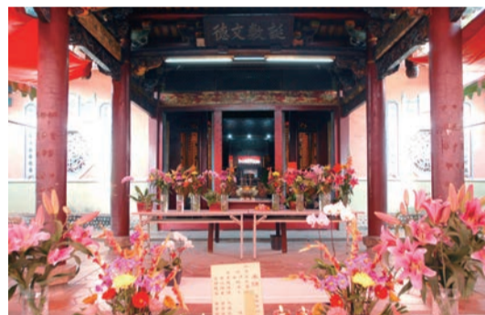
▲文昌廟由文蔚社和文炳社所創立

原創匠師已不可考，但根據文獻記載，廟方曾經多次修復，考量文昌廟特殊歷史文物價值，早年匠師在修復過程中大多保留原有建築風貌和型式。