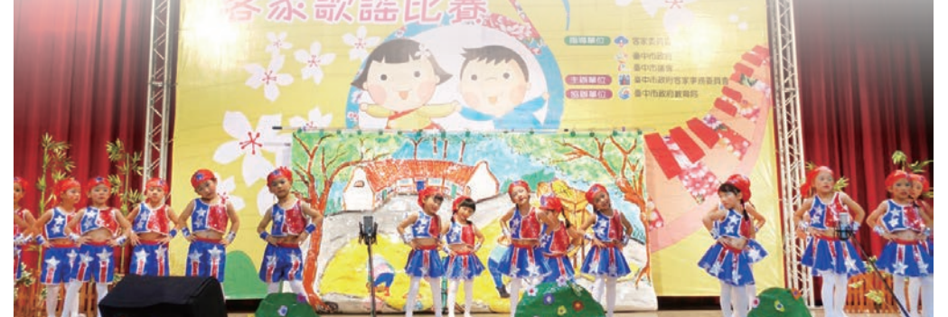
▲幼兒的表演讓人百看不厭

本次活動中更有過動兒、玻璃娃娃等罕病兒登台積極參與演出，各校的家長均到現場為孩童加油打氣，讓舞台上的小朋友們更加賣力地舞動手腳，舞台魅力爆表，熱情支持的盛況顯示出客家歌謠的推廣更為成功，客家文化的精神永久流傳！