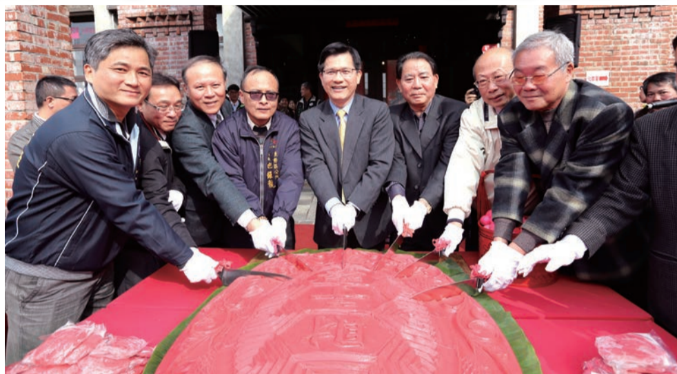
▲ 市長齊心切下120斤新丁粄

為力求客家儉樸精神，強化在地民衆參與，本會也打破以往在東勢客家文化園區舉辦大型晚會的方式，改在貼近