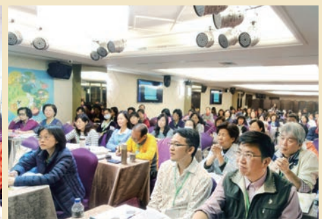
▲各縣市代表及學員認真參與課程