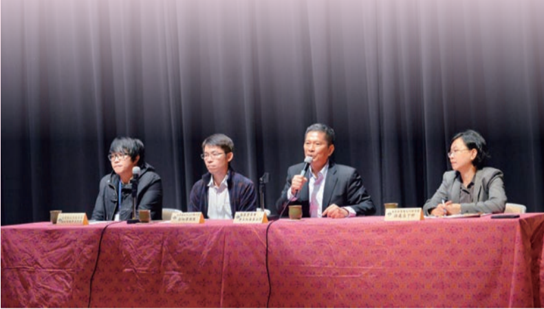
▲座談會提出製作優良客語教材提升學習動機

客家語言的保存及發展一直是客委會成立以來最重要的政策，但15年來在中央、地方政府與社團、民間共同努力下，客家話仍持續流失，李主委指出，在家庭、學校及社區講客家話的機會越來越少，據統計全臺約420萬的客家人口中，會講客語的只有47%，而20至30歲的客家人，會講客語的剩不到20%，客語流失的形勢已經越來越嚴峻。李主委指出，從「還我母語運動」以來，臺灣民眾已經漸漸接受客家文化是臺灣文化不可或缺的一部分，現在客語保存最大的問題就是客家人自我認同的覺醒。李主委也強調，應設法提高下一代學習與使用客語的動機，讓客語使用變成有價值、具實用性，才能有效傳承客語。