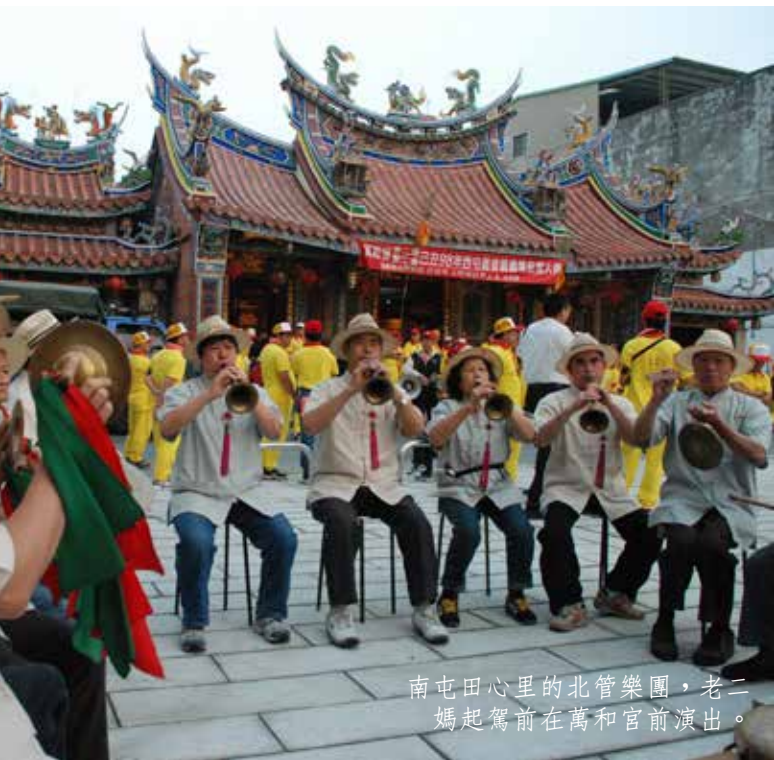
南屯田心里的北管樂團，老二媽起駕前在萬和宮前演出。