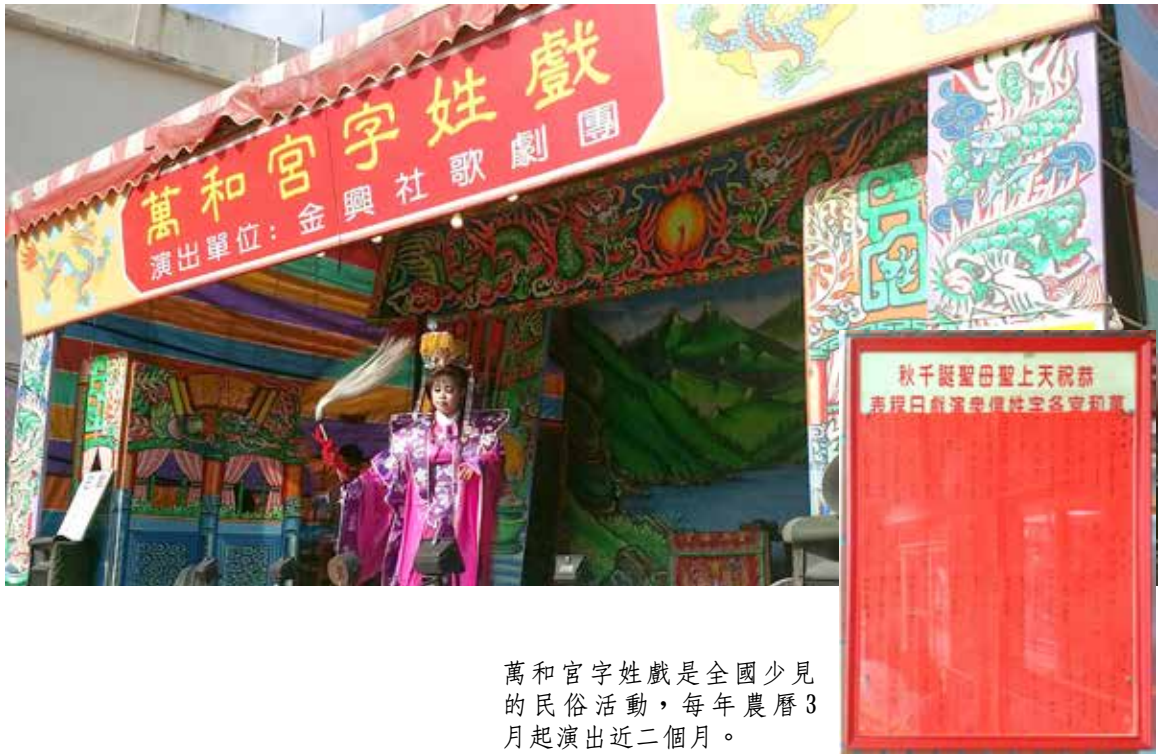
萬和宮字姓戲是全國少見的民俗活動，每年農曆3月起演出近二個月。