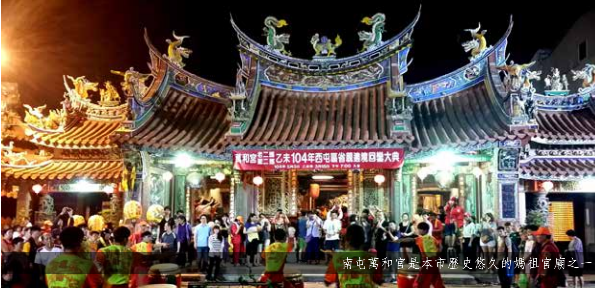
南屯萬和宮是本市歷史悠久的媽祖宮廟之一