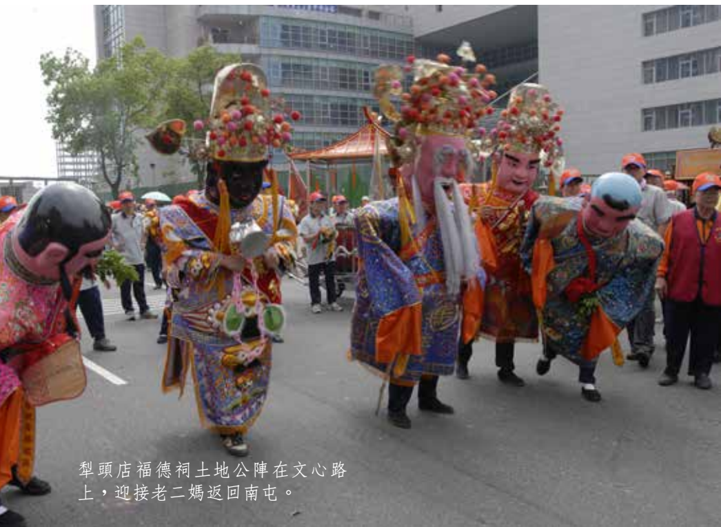
犁頭店福德祠土地公陣在文心路上，迎接老二媽返回南屯。