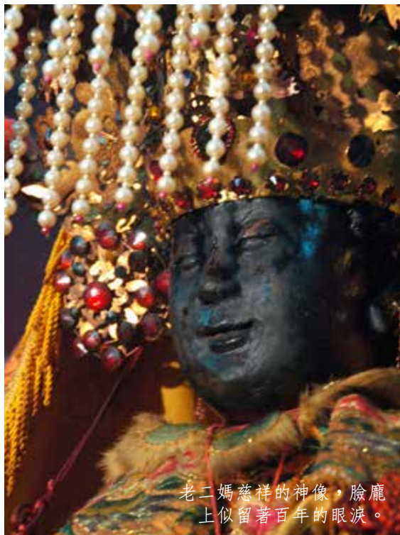
老二媽慈祥的神像，臉龐上似留著百年的眼淚。