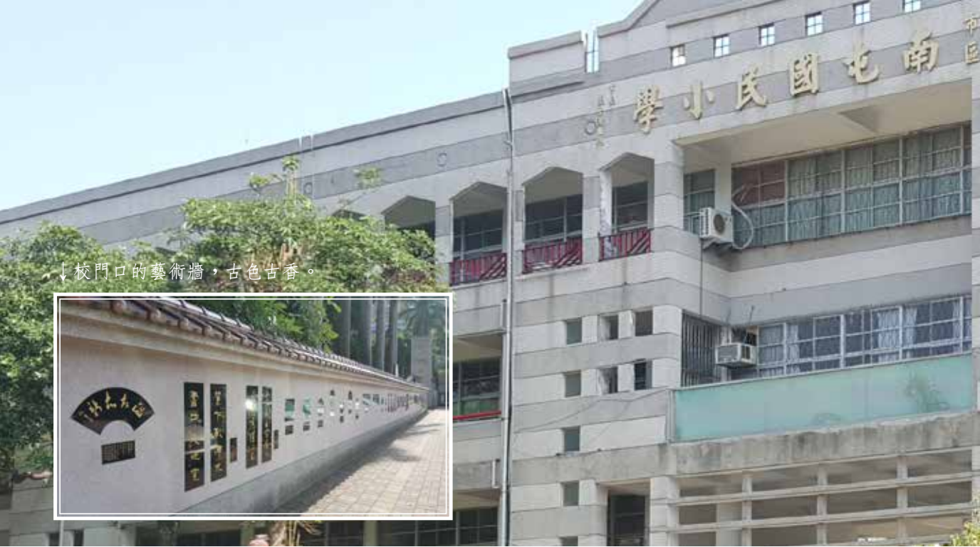
↓校門口的藝術牆，古色古香。