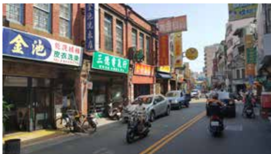
犁頭店街是彰化 - 西大墩、葫蘆墩之間的要道。

萬和宮主祀湄洲天上聖母 - 媽祖，相傳清康熙 23 年 (1684) 聖母神像是張國由大陸福建省湄洲恭請護船來台，墾拓南屯地區落腳於此。最初僅建一小祠祭祀，經常顯見聖蹟，地方倡議建廟，各方信眾祈禱膜拜，南屯一帶居民 - 張、廖、簡、江、劉、黃、何、賴、楊、戴、陳與林等十二大姓氏集資擴建，雍正 4 年 (1726) 九月廿日大廟建竣，定名為萬和宮。「萬和」寓意，希望藉由祭拜媽祖，保佑南屯地區的不同族群「萬眾一心、和睦相處」，共同合作以發展地方。另依據〈宗教臺帳〉記載，本廟創立於雍正 4 年 (1726)，所在地為南屯犁頭店街 201 番地，信眾約有 2,751 名。