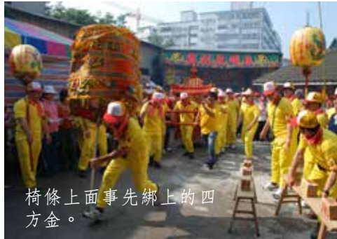
椅條上面事先綁上的四方金。

老二媽西屯省親兩天的活動中，第一天下午，媽祖返回西屯之後，下午即舉行三獻古禮。2015年5月2日下午4:30分，媽祖神轎在清靈宮駐驛之後，隨即在宮內舉行三獻大禮，參與成員均是丹慶季神明會主事者與地方士紳，典禮莊嚴隆重。