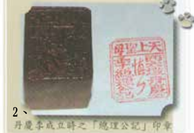
1、老二媽神轎上「嘉慶壬戌年蒲月」，已有 200 多年歷史。 2、3 丹慶季神明會早期的印章。