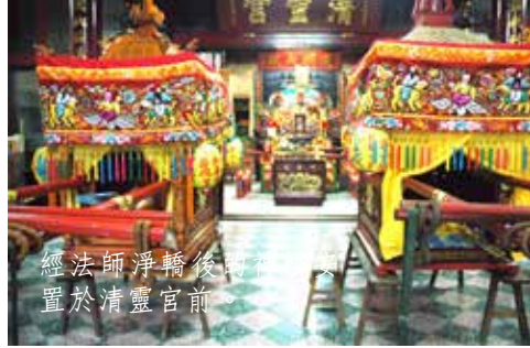
經法師淨轎後將神轎安置於清靈宮前。