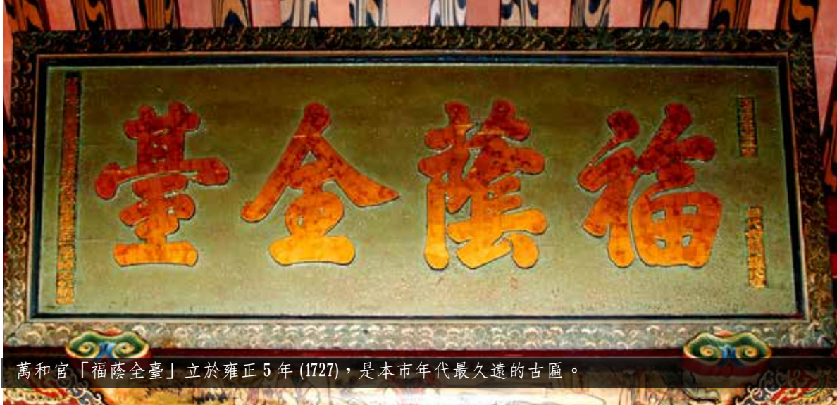
萬和宮「福蔭全臺」立於雍正 5 年 (1727)，是本市年代最久遠的古匾。