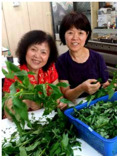
麻芽是本市西南屯地區的特產，在傳統市場與小吃店可以品嚐到可口的麻芽湯。

繩。農人把長成的黃麻砍下來，將皮剝下打成麻繩，剩下的稈子剖成「屎篋」，功能相當於衛生紙。