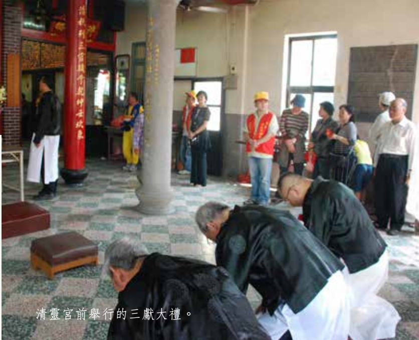
清靈宮前舉行的三獻大禮。