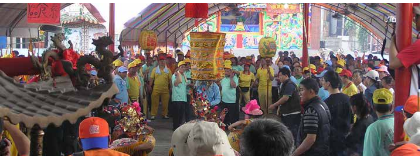
大河里福德祠前，陣頭與信眾擠得水洩不通，廟前並準備豐盛餐點。

大河福德祠位於老二媽返回西屯省親路線上，2015年5月2日當天早上媽祖神轎、各式的陣頭與隨行數千位信眾齊聚，顯得非常熱鬧。廟方準備各式鄉土點心供各方大德享用，並在廟前上演布袋戲，而等待躡轎腳的信眾有如人龍一般。