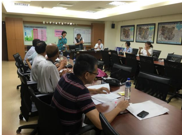
臺中市西屯區 105 年一區一特色計畫推動委員會議 105.05.19