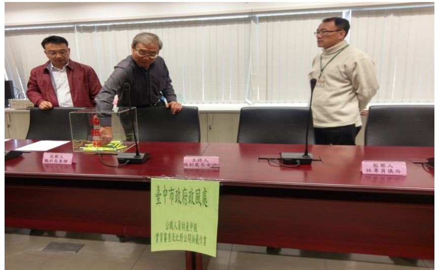
▲辦理 105 年度財產申報實質及前後年比對公開抽籤作業情形