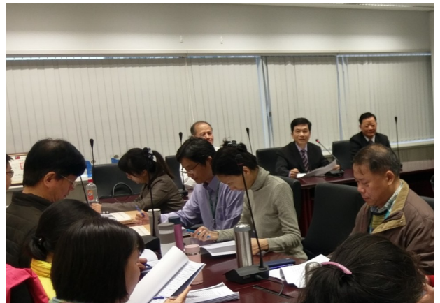
▲本府採購稽核小組 106 年度第 1 次採購稽核業務講習情形

政府採購之效率與施政品質息息相關，採購人員因而責任重大，必須遵守政府採購相關法令，知法才能循法。本府採購稽核小組主要功能即在協助各機關辦理採購業務，避免採購人員不了解或不熟悉法令而誤觸法網，於提升政府採購運作效能及減少採購弊端紛爭上具有正面功能。