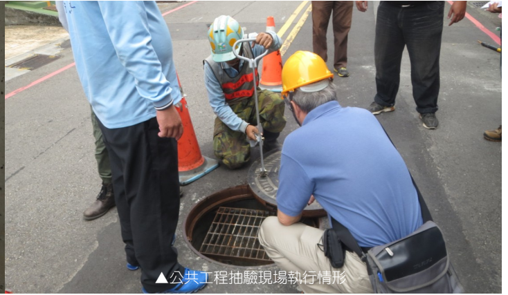
▲公共工程抽驗現場執行情形