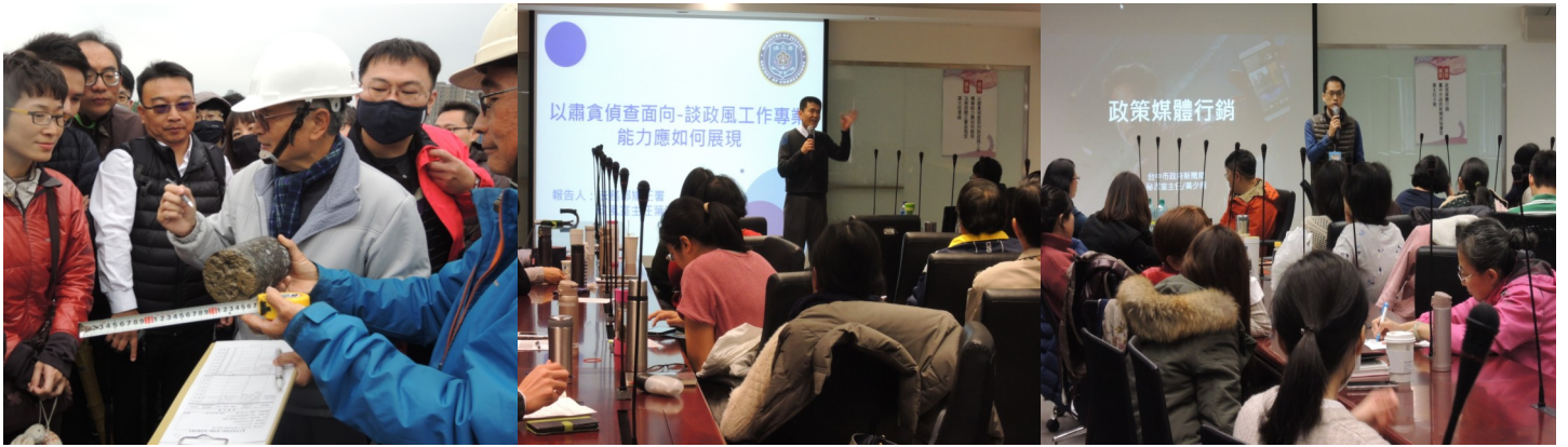
▼提升政風人員專業能力研習情形

肯定；（四）「當前預防業務新思維」及「政策媒體行銷」，特邀請本府新聞局前行銷企劃科長，講授當前新聞媒體行銷方式，增加政風人員對新聞的敏感度，以利行銷政風業務。 為瞭解學員對本案研習之反饋，以供本處未來辦理類案研習參考，於本次課程結束後實施滿意度問卷調查及學習成效測驗，並將該 2 項辦理結果予以統計分析，測驗列前 5 名成績優異者，另擇適當場合公開表揚，以茲鼓勵。