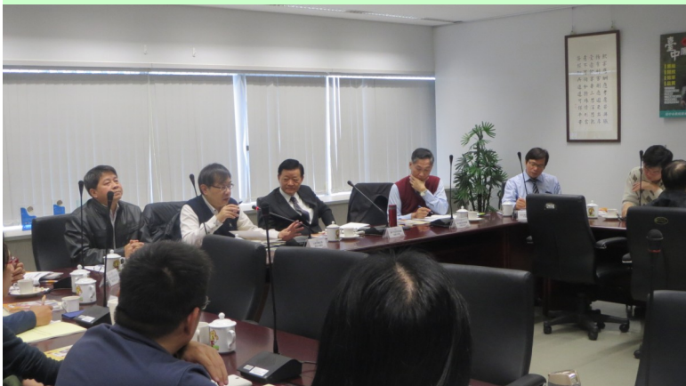
▲中彰投苗區域治理籌備會議四縣市政風處首長及廉政署防貪組組長出席與會

中彰投苗地理位置緊密，各類重大建設與施政作為亦息息相關，甚而各項政策執行過程中所面臨之風險也有其雷同之處，藉由緊密的業務互動及情感聯繫，消弭縣市的疆界，希望發揮團結就是力量的精神，攜手實踐「中臺灣崛起」的共同願景。為延續 105 年「中彰投苗 四處響廉」合作經驗，106 年將結合中彰投苗四縣市機關資源及引進中央政府、NGO 團體及學術力量，共同推動優質廉能治理計畫，建構廉政平台機制，以延伸行銷共創雙贏，並將中彰投苗區域治理平台效能，擴展至全國，以落實「廉能政府・透明臺灣・接軌國際・中部領航」理念。