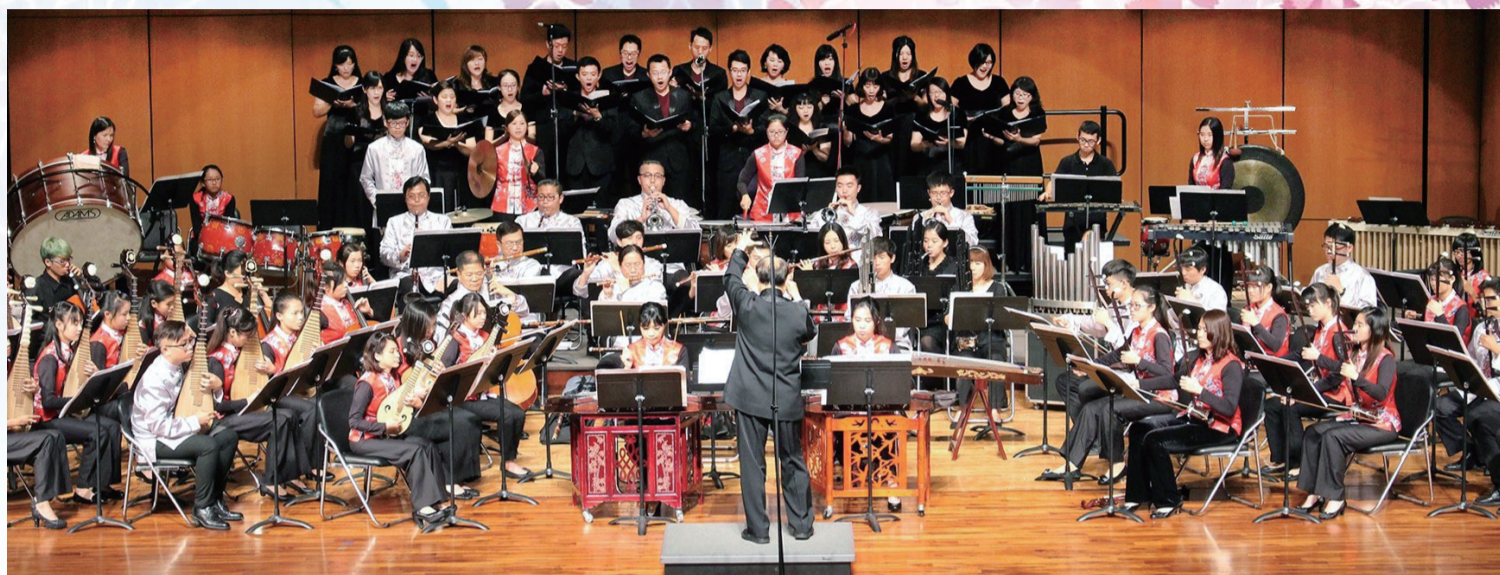
▲「臺中市政府客家事務委員會國樂團」與「臺中藝術家合唱團」共同演出

大雅及西區（國美館）、10月份在烏日安排演出，期待能透過音樂寓教於樂，並將客家文化發揚出去。