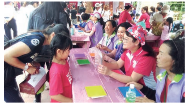
▲客語闖關活動，讓客語學習趣味化。

活動現場除了表演之外，還設有各式花卉及花卉文創商品的展示，讓民眾認識客庄生產的花卉及各種文創商品；此外，本會特別邀請薪傳師設置客語闖關活動，闖關通過者即可領取木藝DIY一份，許多大朋友小朋友都排在闖關攤