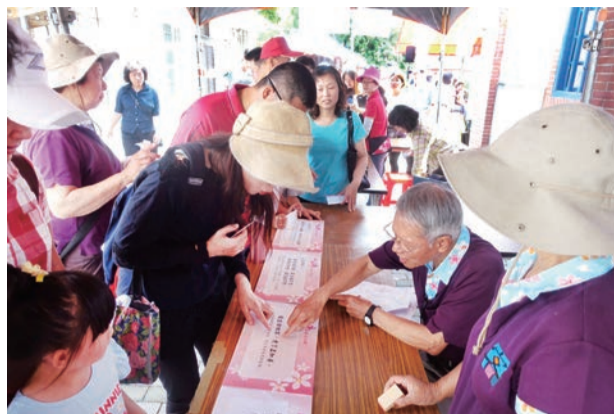
▲民眾參與客家俚語闖關情形

客委會主委劉宏基表示，每年館慶活動對陪著文化館從無到有的人來說，是具有重要意義與標記的里程碑，透過熱鬧的館慶活動讓各界共同感受到滿溢重生的喜悅，未來市府將藉由2018年臺中世界花博的舉辦及浪漫臺三線的規劃，呈現更精緻浪漫山城風貌，也讓所有到訪臺中的旅客，都能走入客庄體驗客家的人文風采。