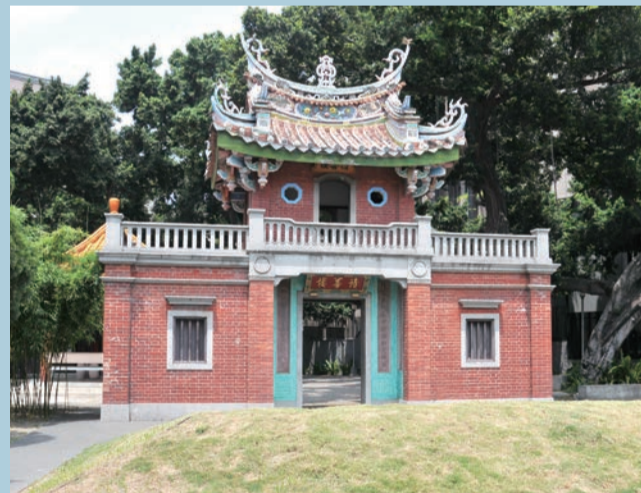
▲積善樓坐落在北屯兒童運動公園旁

後來在民國68年，賴家的「懷恩堂」宅院及「積善樓」被劃為公園預定地，政府計劃予以拆除。經賴姓家族及地方人士大力奔走與爭取，此棟「積善樓」才得以保存，但原來的「懷恩堂」宅院已不復存在，僅留下老榕樹回憶過往風華。