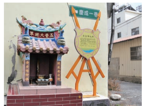
▲坐落四方護土佑民的將寮

東勢區大茅埔庄的將寮祭祀文化，保存最為完善。直到今日，每逢農曆初二、十六和三山國王誕辰日，都定期舉行犒將祭典，庄民發起組織祭祀，由慶東里的各鄰，每次1鄰派出10人作為將首，準備牲禮祭拜，用以犒賞神兵神將的辛勞，人人誠心祭拜，體現庄民對神明的感恩之心，更是居民的精神之寄託。