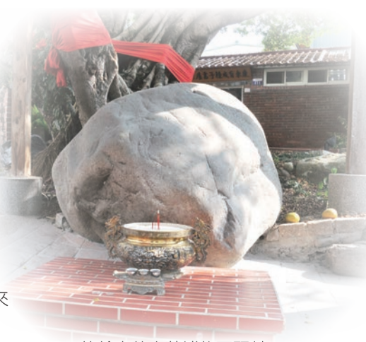
▲位於東勢大茅埔的石頭娘

石母信仰體現了人神一體親密感，更呈現了的獨特臺灣民間信仰內涵；而背後的发展脈絡，不但見證百年來客家人的生活文化軌跡，也維繫著人與土地的鏈結。