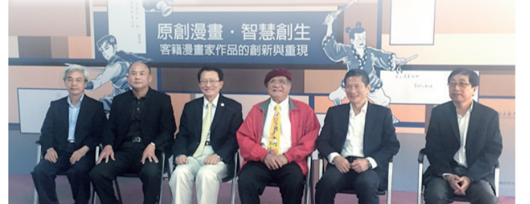
▲客籍作家經典作品重現

客委會表示，葉宏甲、劉興欽及陳定國係臺灣早期著名且重要的漫畫家，不僅皆出生於新竹，也與客家文化有著千絲萬縷的關係。客委會希望能運用現今流行的虛擬實境，讓客籍漫畫藝術家與原創作品從以往靜態保存、平面呈現與單向傳播的形式，轉變為虛擬互動、立體展示與多媒介傳播的數位文化型態，讓客家文化所蘊生出的文化資產經由智慧科技的創生，重獲鮮活的靈魂與創造力。