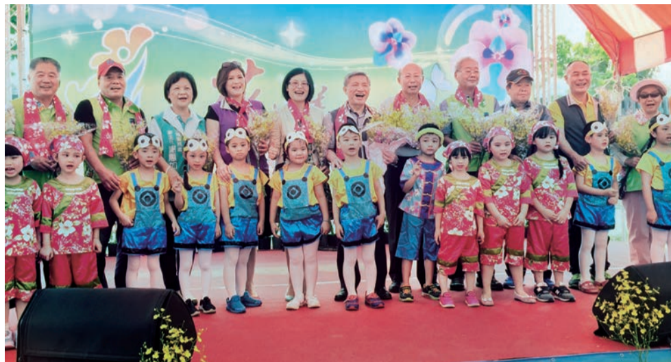
▲幼兒園小朋友為副市長張光瑤、本會主委及長官來賓獻上花束。

本次花漾客家音樂會活動融合客家傳統元素，以客家音樂、舞蹈形式展現，並結合2018臺中世界花卉博覽會宣導，展示各式客庄花卉，讓山城美感覺醒，也讓客家文化覺醒！