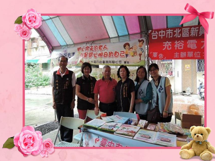
1060520 新興里新興社區發展協會 「端午粽香傳愛心」戶政宣導活動