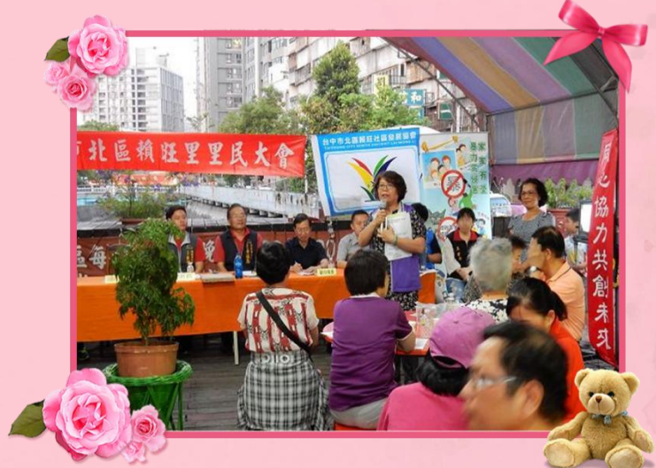
1060514 賴旺里里民大 會宣導戶政業務