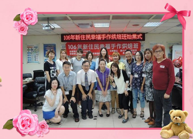
106 年新住民幸福 手作烘焙班