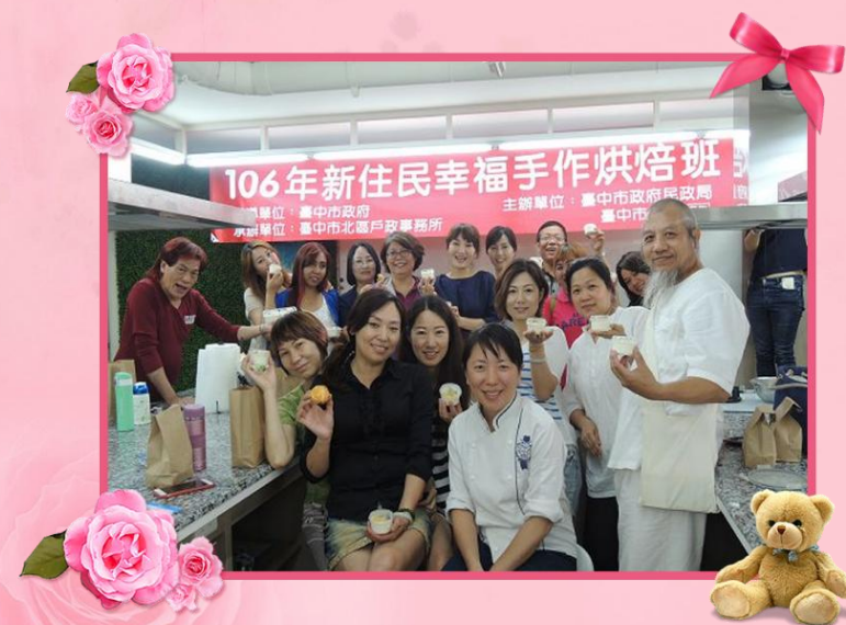
106 年新住民幸福 手作烘焙班