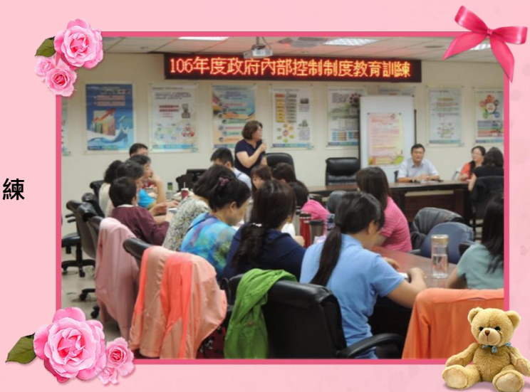
1060610 內部控制教育訓練