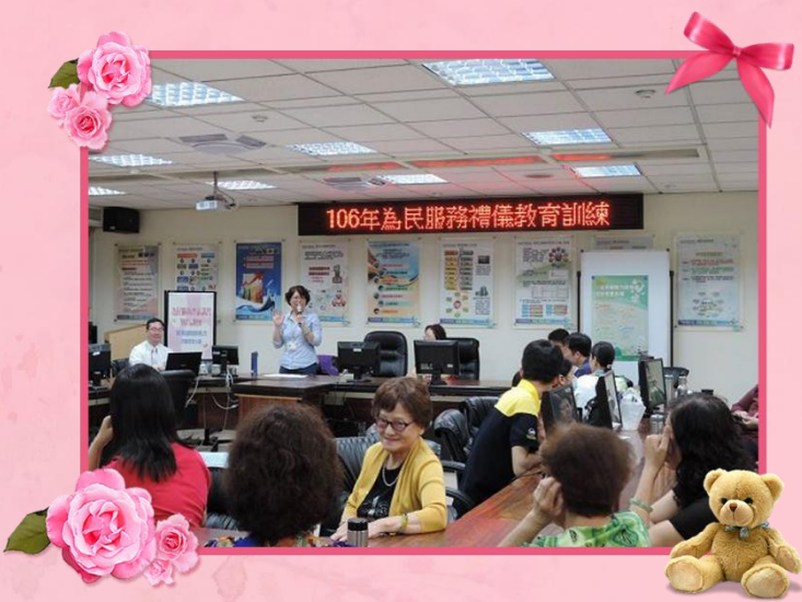
1060429 為民服務 禮儀教育訓練