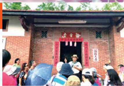
▲導覽員解說豐原涂家夥房其姓氏堂號之源流與歷史發展。