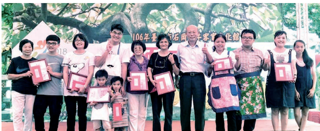
▲親子麵包果創意賽得獎者合照