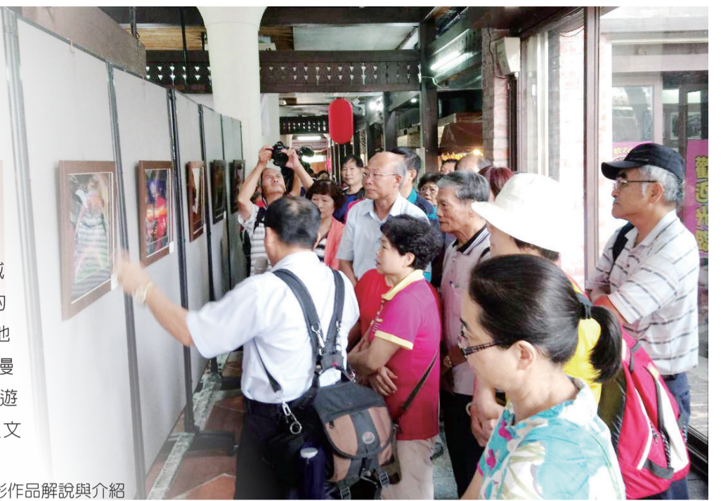
▶ 導覽人員為攝影作品解說與介紹

本會主委表示，東勢是本地山城區的客家重鎮，亦是臺三線上重要的樞紐，此次攝影展透過鏡頭，凝結各地風景人文最美的一刻，呈現瞬間的浪漫於東勢客家文化園區，希冀藉此帶領遊客更進一步走近山城，體認客庄的人文藝術風采！