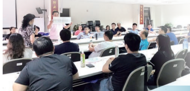
▼ 講師教授常用字彙、詞句

客語在強勢文化衝擊之下，面臨快速消失的危機，本會積極輔導本市機關、學校辦理客語研習，包括警察局、石岡區公所及梧棲戶政都已陸續成立客語認證班，更鼓勵民衆、公教人員參加客語能力認證，