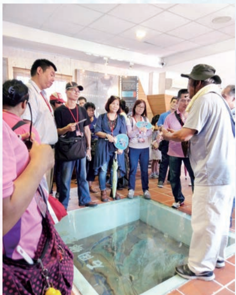
▲透過導覽員口述「土牛」來由，讓視障朋友想像並形塑歷史場域。

「2017客家傳統空間文化巡禮」活動於7、8月舉辦，計有100名鄉親熱情參與，其中更有視障朋友共襄盛舉。參訪導覽景點為大肚區磺溪書院、石岡區土牛客家文化館與豐原區涂家夥房，聘請客家文史專家以深入精闢的解說客家建築工法，讓活動參與者全神貫注聆聽與欣賞客家建築文化呈現之幽美，返溯傳統時空，置身歷史場域，並賦予客家文化傳承的意義。