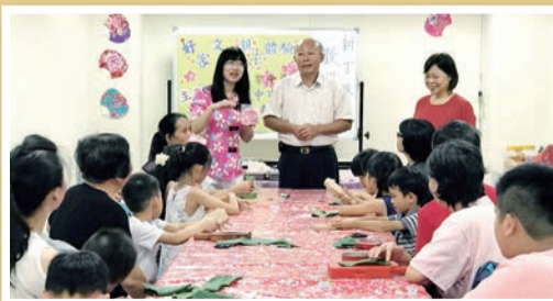
▲講師介紹新丁板的做法