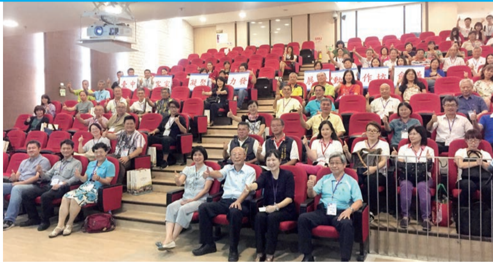
▲林副市長同全體與會嘉賓合照

定是具有客家血統的客家人，大家對於客家文化既熟悉又陌生，希望透過「隱形客家」意象，共同重新找回客家認同感及尋回客家根源。