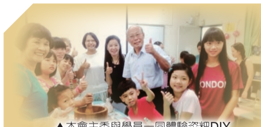
▲本會主委與學員一同體驗糰粿DIY

客語傳承面臨世代斷層的危機，為修補家庭傳承母語之失能，本會積極推廣親子共學客語，除教導家庭成員認識客家語言及文化外，並結合日常生活經驗，透過遊戲、手作等親子互動課程，營造親子共學環境，讓民衆自然而然的開口說客語，落實客語學習家庭化。