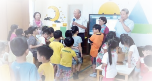
▲本會主委與亮亮幼兒園小朋友互動熱絡。

每年暑期客家小學堂精心安排的客語、歌謠傳唱、歷史文化、客家戲演練、美食DIY、藍染、紙傘彩繪等傳統客家工藝創作與客庄景點參訪等課程，均獲得學童們的熱情參與及家長的肯定。希冀以輕鬆、活潑及多樣化的教學方式，啟發小朋友對客家文化的興趣，一同來體驗、感受客家文化魅力，陪伴學童度過一個知性客家風的暑假。