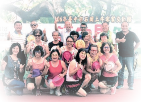
▲本會主委與表演團隊合影

今年首度舉辦「臺中市客家數位典藏專輯發表會」，精彩的專輯開播廣受現場好評，數位典藏電視專輯共有四集，分別為「移民史與建築風格」、「三山國王與文昌廟」、「供品與豆米文化」以及「漆藝與客家音樂」紀實，於7月31日起每日上午7:30至8:00在豐盟有線電視臺第3頻道播出，另西海岸有線電視臺第3頻道於8月14日起每周一至周四晚上9時至9時30分播出，歡迎市民朋友踴躍收看！