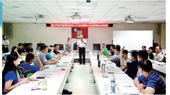
▲ 本會主委嘉許警察局同仁保有進取的熱忱

警察局表示，同仁使用客語與客家籍民衆交談，能讓民衆備感親切；今（106）年7月8日一位北屯派出所警員使用客語與一名失智長者溝通，成功協助長