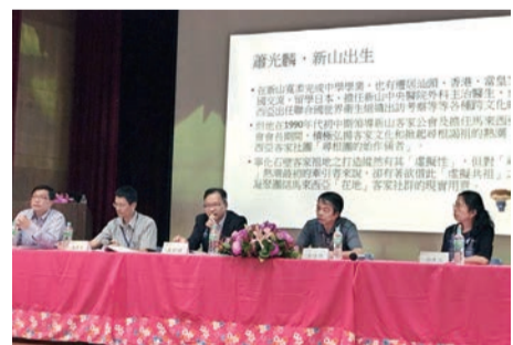
▲學術研討會專家學者針對客家議題討論熱烈。

黃秘書長於致詞時表示，客家文化為大臺中重要的資產，涵蓋伙房建築、新丁板節、巧聖仙師及鯉魚伯公