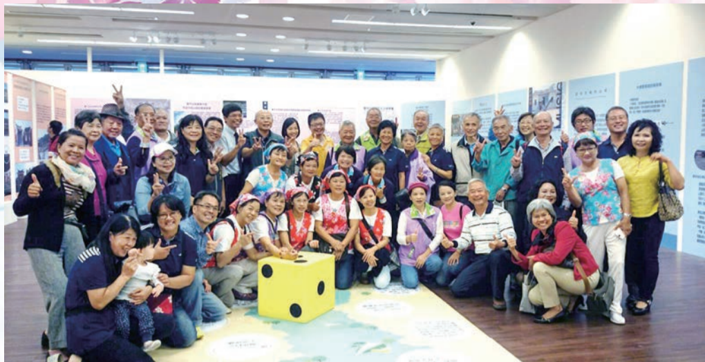
▲本會劉主委、何主任、石岡區長及與會貴賓大合照

客發中心何主任表示，此次特展是中央館與地方文化館首次合作，使更多人認識支持客家文化，12月16日台灣客家文化館將與日本民族博物館、交通大學文化交流合作，讓台灣