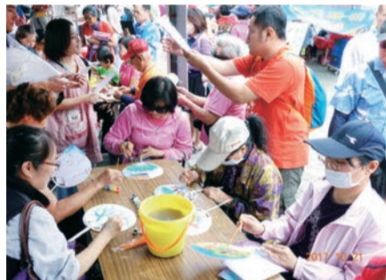
▲民眾體驗手繪樂趣，彩繪出各具特色的圓扇與波浪鼓。

為展現中部縣市豐碩之客家表演藝術及迎接2018世界花卉博覽會在臺中，本會以「花漾」為主題，於10月21日在臺中公園舉辦「花漾客家嘉年華～野餐音樂會」，活動集聚來自中部縣市13個客家表演團隊，場面溫馨熱鬧！