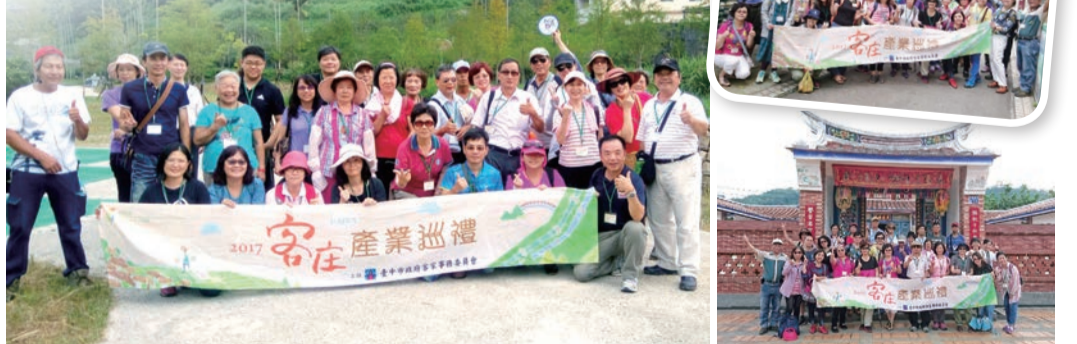
▲新社中和社區生態導覽，造訪新社馬力埔聚落彩繪小徑，並於石岡土牛客家文化館合影。