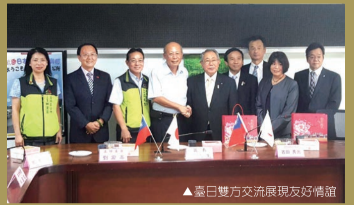
▲臺日雙方交流展現友好情誼