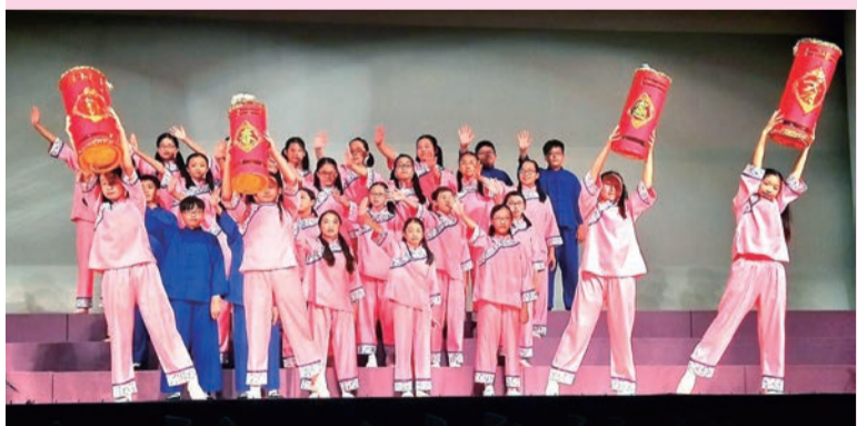
▲花漾客家音樂會演出精彩

本會劉主委表示，音樂會中有多首描述客家農村風光的歌曲作品優雅而細膩，藉由聆聽能了解客家早期農村生活，體認客家人純樸以及腳踏實地打拚的精神。希望用音樂旋律、音符舞動傳遞花博訊息，傳達客家文化、音樂之美。