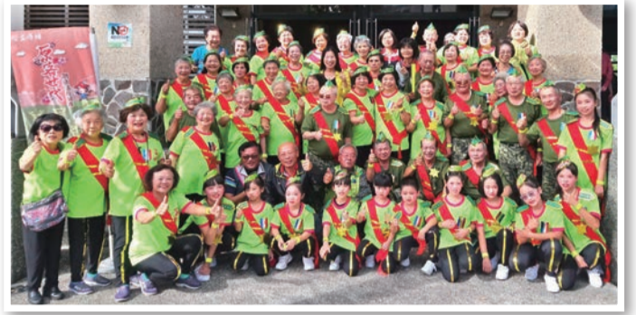
▲原客文化活力秀冠軍-上城社區發展協會

並促進更多年輕人參與、投入社區據點的運作以及地方文化的培植，將年輕人的熱情與行動力挹注在原、客社區據點中；共同創造社區具備在地照顧功能外，也更具備文化傳承使命。