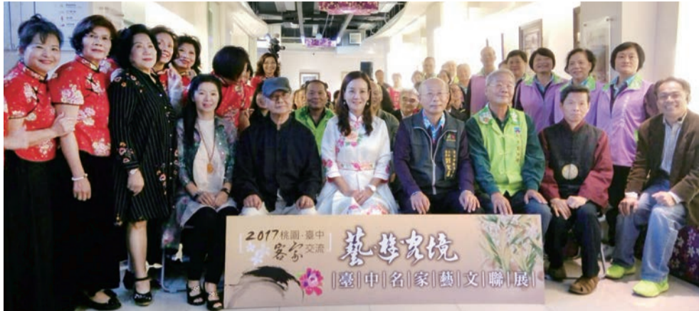
▲開幕茶會與會來賓合影

本會劉主委表示，打造臺三線浪漫客庄大道是臺中市政府的重要政策之一，臺中為浪漫臺三線文化廊帶南端入口，桃園則為文化廊帶北端入口，此次展覽為南北端兩市交流，期望透過展覽呈現客家藝文之美及人文的交流。