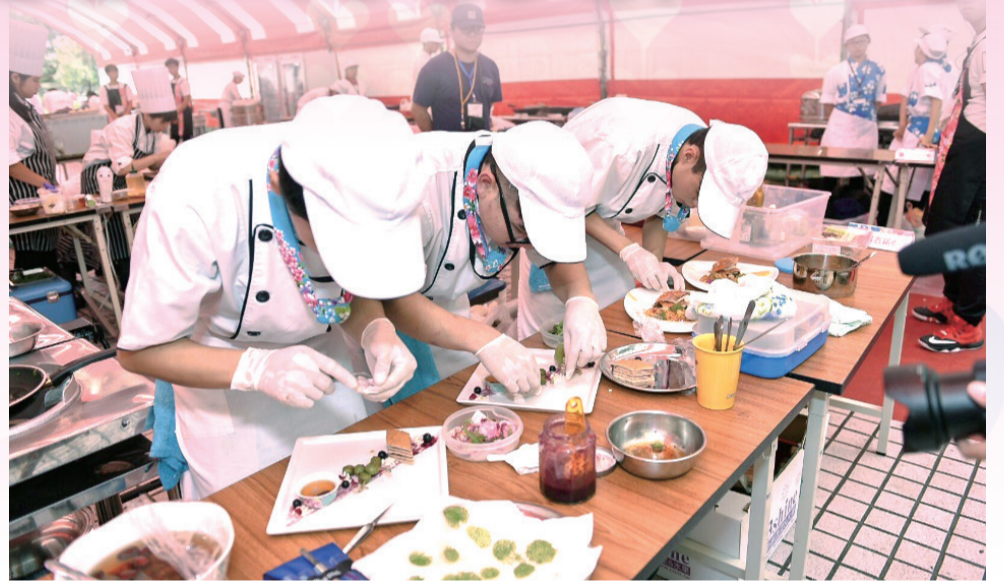
▲參賽隊伍發揮創意讓花、果「入菜」或「擺盤」並與醬汁融合。

主題，來自中彰投苗20組隊伍展開競賽，學生組第一名是由來自臺中市弘光科技大學「弘·桔」奪得、社會組第一名是由來自臺中市「客騎士」奪得。另外學生組第二名是臺中市明道中學「新九降風」、第三名是南投縣同德家商「好客同德」、佳作是臺中市弘光科技大學隊伍「小當家」及苗栗縣私立育民工家隊伍「YMH.M.」；社會組第二名是彰化縣「怡園婚宴會館」、第三名是南投縣「同德御手作」及苗栗縣「卓也小屋」。各組前三名及佳作，可獲得四萬元、兩萬五千元、一萬五千元、一萬元