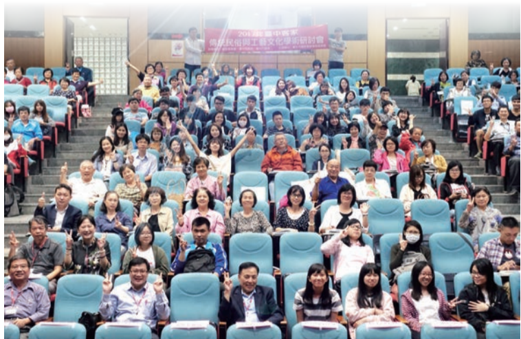
▲學術研討會吸引專家學者與民眾一同參與交流。

本次研討會專家學者針對客家議題討論熱烈，激盪出不同的學術火花，期盼藉此學術研討會提升大埔客家文化、族群、民俗工藝的能見度，更期許以學術研討會為基石，深耕與豐富臺中學內涵，讓更多人認識大埔客家、認識臺中。