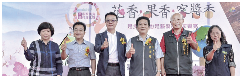
▲2017中區客家美食料理比賽-開幕式

決賽現場除了料理大賽，還有免費的客家美食、好看的客家藝文表演、客家特色商品展售會、互動區等多項活動，其中客家特色商品展售會現場，結合QR Code行動條碼之掃碼，搭配攤位牌上國語、客語文字轉換翻譯，以視覺與聽覺提供民眾立即學習簡易客語的教學服務，讓更多人開口說客語。