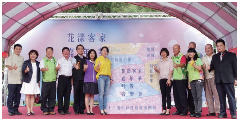
▲長官貴賓手持圖卡，將花漾客家嘉年華～野餐音樂會元素共同拼貼完成，為活動揭開序幕。

本次活動以音樂會活動之形式推展客家音樂、語言、技藝、文創、產業、美食等，希望透過活動促進中部客家語言與文化的交流，期盼臺中成為一個多樣文化與藝術之城市，亦打響2018世界花卉博覽會在臺中。